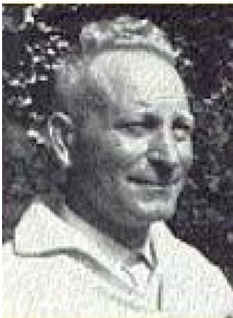
Piet Van Aken (foto van het Internet)

vroege menselijke bewoner van deze streek. Dat laatste moet de oudste menselijke vondst zijn in Vlaanderen. Het museum is niet constant geopend. Slechts op zaterdag en zondag en dan nog enkel tussen het tweede weekend in mei en het derde weekend van september. Van de entreeprijs wordt je niet armer: die is slechts 1,00 Euro.