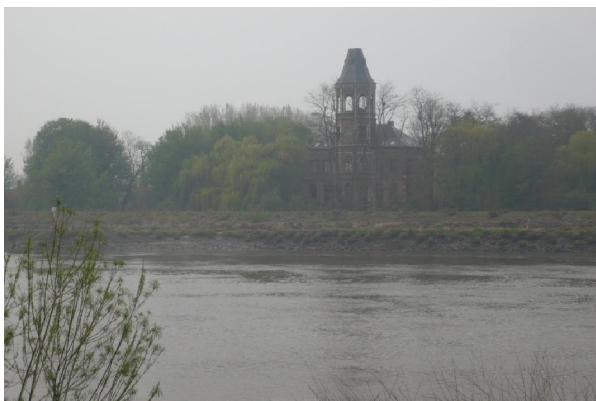
Het kasteeltje De Bocht vorig jaar...

Aan de overzijde van de rivier was een kasteeltje zichtbaar dat ik reeds bij eerdere wandelingen had gespot. Het kasteel „De Bocht“. Het heeft daar lang staan vervallen maar sinds een aantal jaren hebben enkele enthousiastelingen zich toegelegd op het restaureren ervan. Geen geringe taak. De toren is totaal vernieuwd en sinds kort weer geïnstalleerd. Wat in dezen de juiste omschrijving is want die spits werd niet ter plaatse daar boven gemaakt maar wel volledig op de grond afgewerkt en later naar boven gehesen. Iets wat klaarblijkelijk met succes is gebeurd.