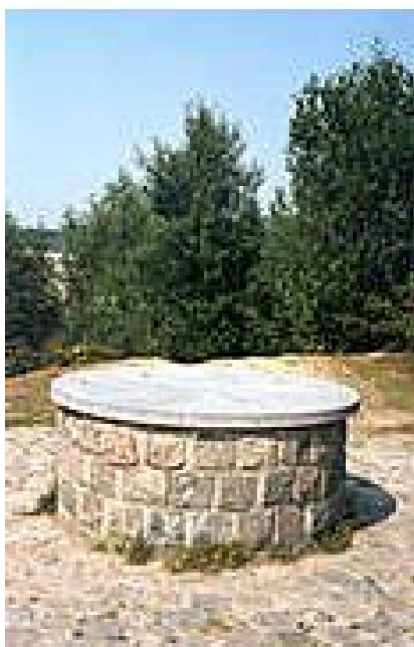
De orientatietafel op het hoogste punt van de wandeling.

om te beletten dat een deel van het pad opeens in de diepte verdwijnt. Wat ik echter nogal raar vind aan die oriëntatietafel, en zelfs wat storend, is dat ze gebouwd werd met een soort natuursteen dat zeker niet eigen is aan deze streek. Waarom werden hier niet met enig gevoel voor de couleur locale oude bakstenen gebruikt? Ik heb onderweg heel wat bouwwerken gezien die toch maar te vervallen staan. Daar had men toch makkelijk het bouw materiaal vandaan kunnen halen? Maar goed, van hier af moest ik op mijn schreden terugkeren om onderaan de helling nog eens in oorspronkelijke richting te stappen. Zo kwam ik weer in de voormalige kleiputten van Rumst terecht. Deze putten zijn een groot gebied tussen de wijk Bosstraat in Boom, het dorp Terhagen, de dorpskern van Rumst en het huidige, nog actieve kleiontingningsfront ten zuiden van Reet. In totaal zo'n 150 ha. Het is een uniek stuk landschap in deze regio. De kleiputten slepen een beladen verleden met zich mee. Het ontginnen van de klei beet steeds noordelijker grote gaten in het landschap. De oude, afgedankte putten lagen daar maar te liggen en dus werden er nieuwe bestemmingen voor gezocht. Niet dat het veel moeite of geld mocht kosten. In tegendeel,