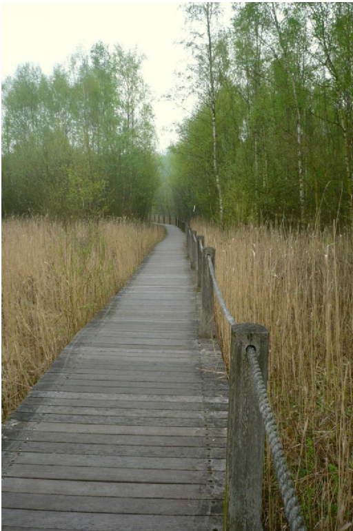
Een vlonderpad door het moeras van De Schorre.

delijk voor is. Op het domein staat ook een circus. Schijnbaar is dat daar (semi)permanent verankerd. De tent plus de eventuele vertoning kunnen gehoord worden. Voor verjaardagspartijtjes en communiefeesten, bijvoorbeeld. Het is eens wat anders dan de MacDonaldis. Al hebben ze daar ook wel een clown. Over diverse waterplassen liggen bruggen en vlonderpaden zodat je door het moeras kan wandelen. Op de terugweg ging het traject nogmaals doorheen dit gebied. Voor een groot deel precies over de genoemde vlonderpaden. In tegenstelling met mijn wandeling hier vorig jaar kwam ik nu wel degelijk voorbij aan de grote kleibaggermachine die hier reusachtig rustig roestend is achtergelaten als een relict uit vroeger tijden. Een soort monument voor het industriële verleden van deze plek. Het ongeluk diende echter dat het geheugenkaartje van mijn cameraatje vol was en ik jullie dus alweer niet kan vergasten op een beeld van deze stalen dinosaurus. Het wissen van opnamen is met deze camera namelijk zeer onpraktisch en dus doe ik liever niet onderweg. Daarom ook zijn sommige foto's bij dit stukje niet op deze wandeling gemaakt maar op de vorige. Je merkt het wel aan de andere weers- en lichtomstandigheden. Of ze