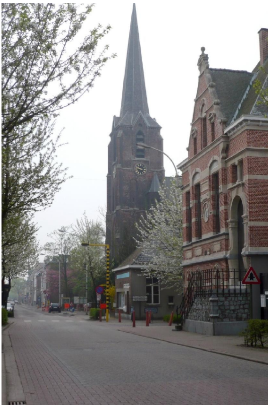
De kerk van Terhagen

Wie zich, zoals ik, naar Terhagen wil begeven moet goed uitkijken. Ten eerste bestaat er een Terhagen dat een gehucht is van Sippenaeken in de gemeente Blieberg. Daar zal men allicht wel spreken van Plombières want de plaats ligt in de Belgische provincie Luik. Dan is er ook een Terhagen als buurtschap bij het dorp Elslo in de gemeente Stein in Nederlands Limburg. En tenslotte is er het doel van mijn uitstap dit keer: Terhagen, een deelgemeente van Rumst in de provincie Antwerpen. Daar organiseerden de plaatselijke Kleitrappers hun Klinkaertocht. Net zoals de vorige keer toen ik in deze streek wou gaan wandelen verliep de rit naar het beginpunt van de tocht niet zonder hindernissen en vertwijfeling. Toen kwam ik terecht in een „Omlegging“ die me in cirkeltjes rond stuurde. Die verschrikking is hier te lande, onder het adagio „wat we zelf doen, doen we beter“ uitgegroeid tot een culturele verworvenheid die met jaloerse zorg wordt in stand gehouden. Nu was het alweer een „Omlegging“ die onverzettelijk op mijn weg lag en bovendien vertoonde de GPS kuren. Die wilde me mordicus een straat insturen die er niet was. Het lijkt wel of de duivel ermee speelt. Tenslotte ben ik toch, na ruime omzwervingen door de doolhof van straten en wegenbouwwerven, nog bij de kerk in Terhagen geraakt. Zij het dan bijna een half uur later dan voorzien.