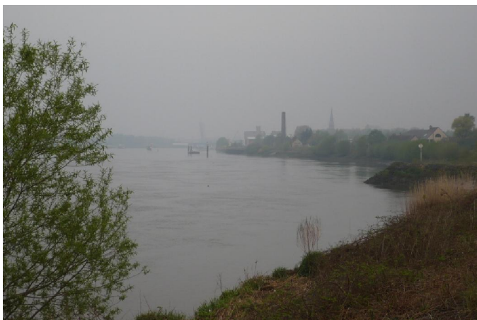
De brede Rupel ter hoogte van Terhagen

gere ABVV- voorzitter Louis Major. Het ABVV was (en is) het Algemeen Belgisch Vakverbond van socialistische signatuur. Van Aken tekent dit personage als een meedogenloze, niets en niemand ontziende carrièrist die de vakbond in de eerste plaats gebruikte uit eigen belang. De titel van het boek zou verwijzen naar een dikwijls gebruikte uitdrukking van Major: "dan ga je maar" („dan godde moar“ in het dialect, wat ongeveer „hoepel op“ betekent). Ik betwijfel sterk of Major er kon om lachen toen het boek uitkwam. Daarvoor zal het vertelde wellicht iets te dicht bij de realiteit gestaan hebben.