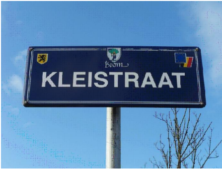
Klei, overal klei...