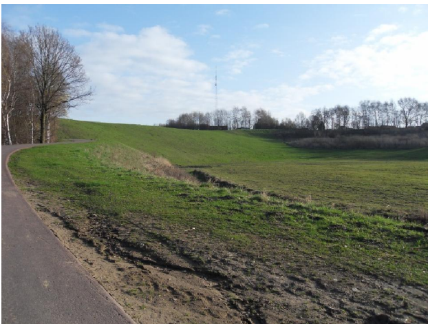
De deltahelling in De Schorre

Het traject leidde nu naar De Schorre. Dat is één van die gigantische putten die de ontginning van de klei hier heeft achtergelaten. Nadat ze als wingebied hadden uitgediend verdienden diverse partijen er nog een rijkelijke cent aan door de putten te gebruiken als stortplaats. Gelukkig is daar paal en perk aan gesteld. Zo ook hier in De Schorre. In het kader van de reconversie van de streek werd hier het Provinciaal Recreatiecentrum Rupelstreek aangelegd. Het gebied strekt zich uit over de gemeenten Boom en Terhagen. Het geheel ziet er nogal strak rechtlijnig en weinig speels uit. Men kan er fietsen,