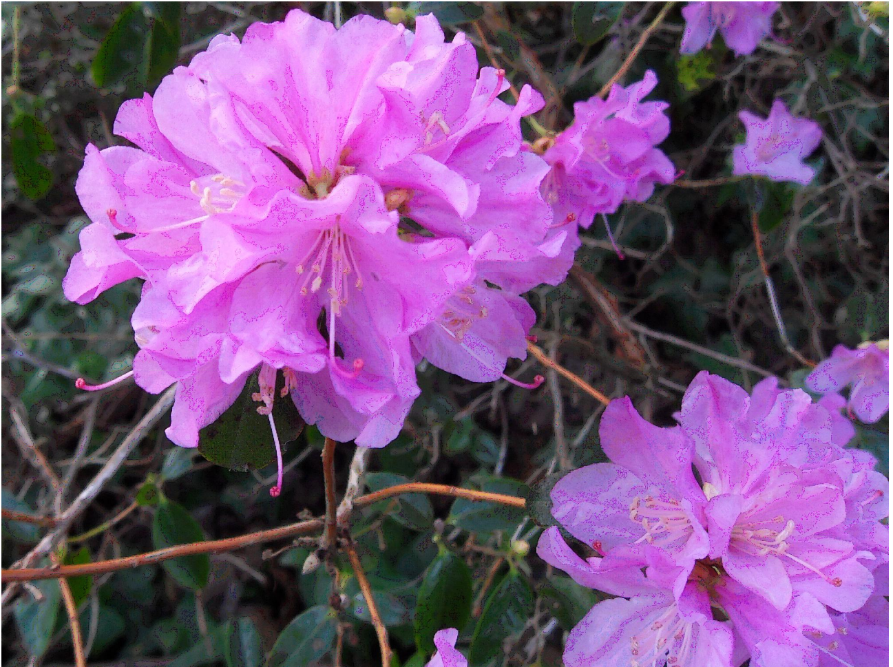
Ze zijn er weer: bloemetjes!

deze gebieden. Zowel Swenden als Prayon Rupel waren echter, zoals te verwachten, niet bereid om hieraan mee te werken. Het laatste woord is in dezen nog lang niet gezegd of geschreven maar na 22 kilometer door het gebied, ben ik voorlopig wel uitverteld.