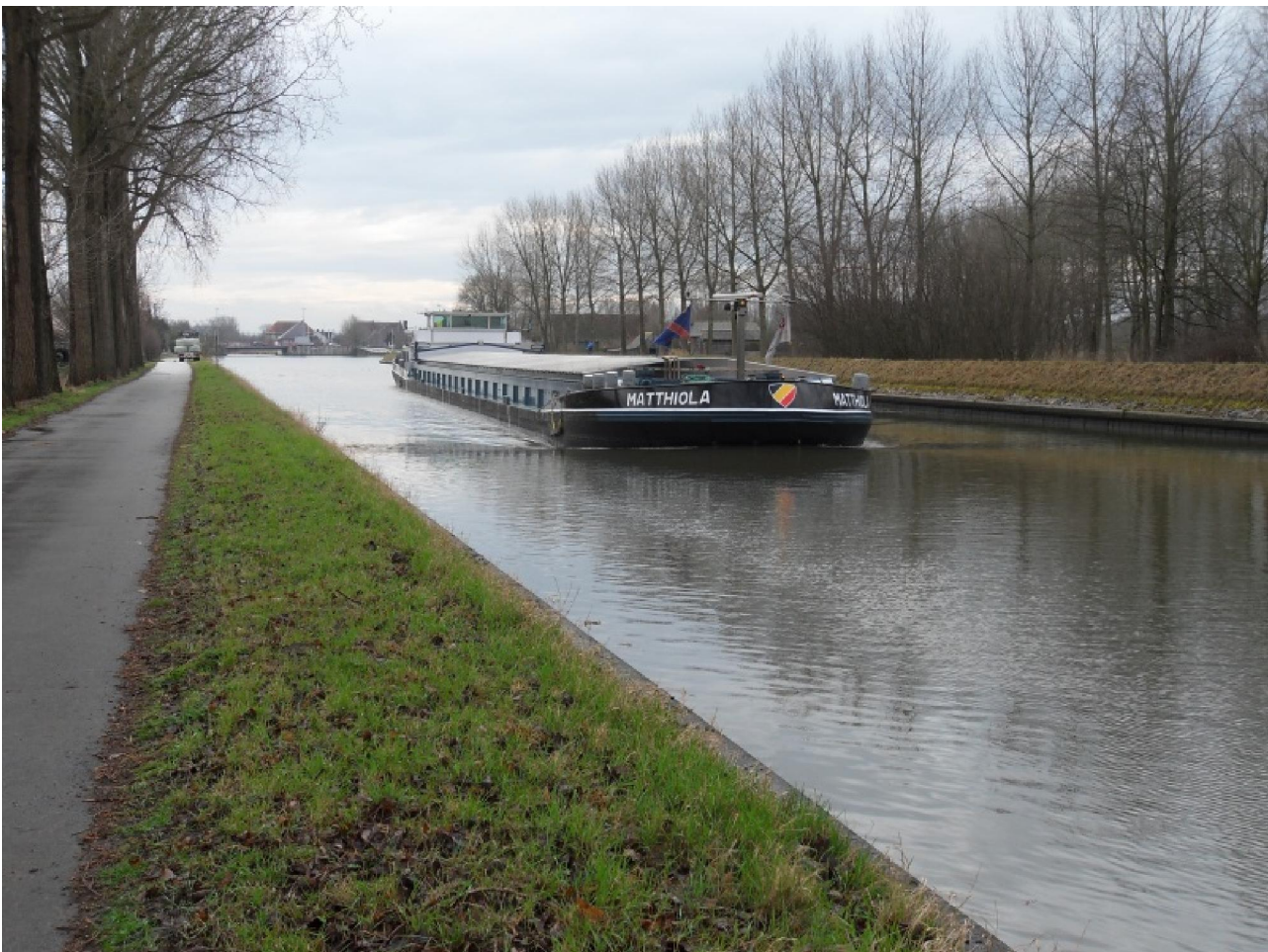
Het erg grote binnenschip op het kanaal Gent-Brugge.

Om een wel erg breed binnenschip te laten passeren. Wanneer die verderop, waar het kanaal beduidend smaller is, een schip van hetzelfde kaliber tegenkomt, is er een probleem. Tegen de tijd dat ik aan de brug arriveerde was die alweer dicht. Het scheen me toe dat de wandeling wel ongeveer gelopen was want de auto's stonden daar in dichte rijen geparkeerd. Niet zo. Het traject leidde naar een kloosterachtig gebouw, een school, waar de