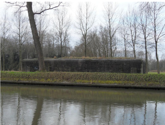
Een lelijke, grimmige bunker op de kanaaloever.

Eigenlijk lag de startplaats voor deze wandeling niet direct in Oostkamp maar wel in Moerbrugge. In het Cultureel Centrum „Zuidleie“. Inderdaad bevindt men zich daar in de Vallei van de Zuidleie. Dat is een historisch riviertje waarvan nu nog slechts wat rudimenten over zijn. In de 13 de eeuw werd door het nabije Brugge in deze vallei een kanaal gegraven met de bedoeling een waterwegverbinding te maken met de „echte“ Leie. Het duurde echter nog tot 1625 voordat het kanaal van 42 kilometer lang tussen Brugge en Gent werd afgevoerd. In de vallei liggen nu nog oude armen van de Zuidleie en daar rond heeft zich een heel bijzonder landschap kunnen ontwikkelen. Het zijn meestal natte graslanden omringd met knotwilgen waar verschillende moeras- en overplanten groeien. Het was nog net iets te vroeg op het jaar om dat al in zijn volle pracht te kunnen zien maar dat kan nooit lang meer duren. Dan ontploft het landschap hier in een orgie van kleuren. Delen van de vallei en de kanaaldijk zijn ooit opgehoogd met zandig materiaal dat afkomstig was van historische verbredingen van het kanaal. Het is een bovenlaag die kalkarm is en waarop een specifieke, bloemrijke plantengroei voorkomt. Langs het kanaal staan ook zeer oude populieren. Zowat de oudste van het land, schijnt het. Dat de mens niet altijd heeft bijgedragen tot de schoonheid van het landschap werd geïllustreerd door een paar grote, grauwe bunkers die op de oever van het kanaal stonden.