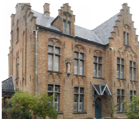
De riante pastorie in Ver-Assebroek