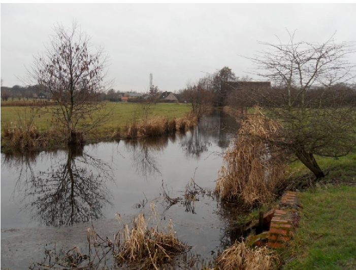
De Gemene Weidenbeek

gestreden over het eigendoms- en gebruiksrecht. De Aanborgers werden tenslotte in het gelijk gesteld. Nu zijn er nog steeds zo'n 1200 Aanborgers en wordt het beleid gevoerd door een bestuur dat om de 3 jaar gekozen wordt. Er bestaat overigens ook een „Aanborgersstraat“.