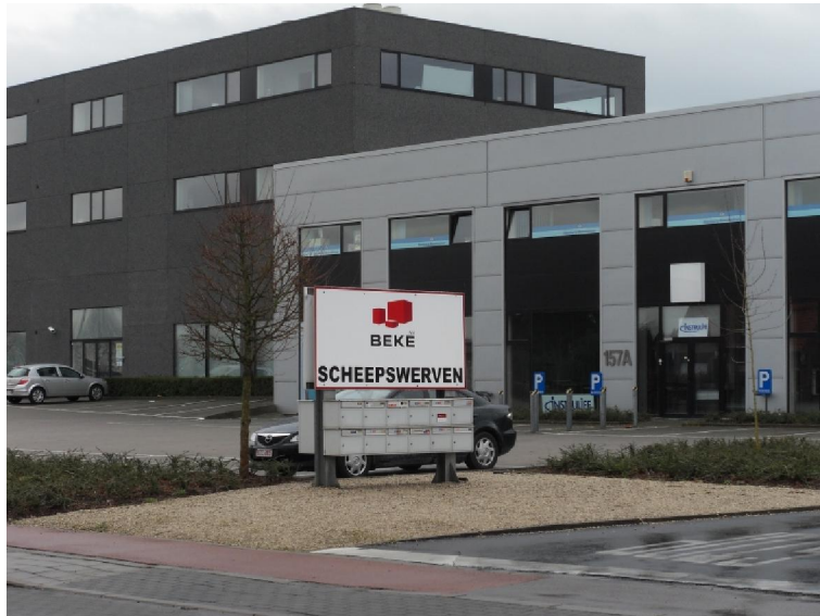
De scheepswerven van Oostkamp

Na een tweede bezoek aan Patria in Assebroek wezen de pijltjes daar naar links en werd ik weer de weiden en de polder ingestuurd. Via dikwijls erg modderige wegeltjes belandde ik dan in een soort industrieterrein langs een rechte baan met niet al te veel verkeer. Er zijn hier zelfs scheepswerven. Tenzij die hun schepen of boten te water laten op het kanaal, zie ik maar weinig zin in het vestigen van een dergelijk bedrijf op deze plaats. Maar vlak er naast ligt een bouwonderneming die „Christiaens“ heet. So what...? Er volgde nog een hele trot langs het kanaal. Van ver zag ik dat de brug in Moerbrugge open stond.