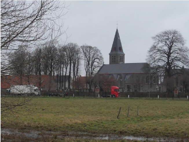
De Onze-Lieve-Vrouw-Onbevlekt-Ontvangenkerk met het miraculeuze Mariabeeldje in Ver-Assebroek .

schap liggen. Volgens sommige archeologen gaat het hier om een prehistorisch monument. Opgravingen hebben aangetoond dat er hier al zeer, zeer lang bewoning moet geweest zijn.