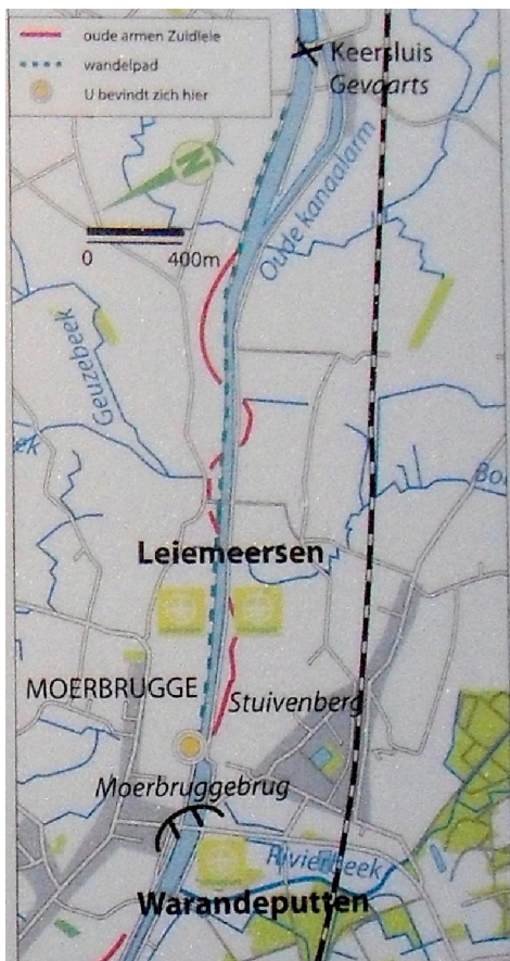
Een kaartje van de vallei van de Zuidleie

Toen ik de vallei van de Zuidleie verliet, scheen de zon. En dat maakt toch een boel goed, nietwaar?