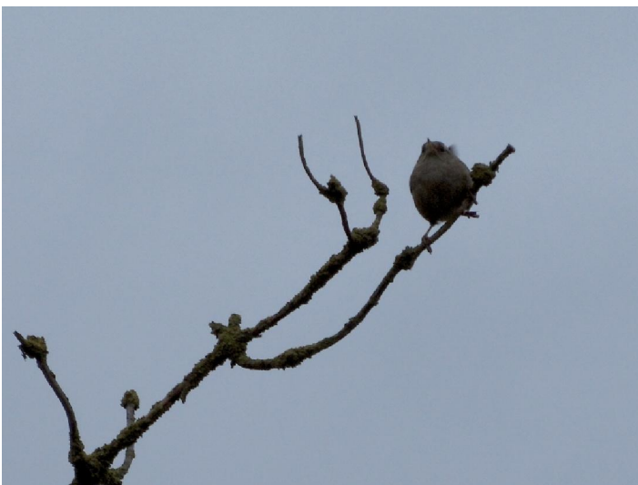
Het winterkoninkje op zijn tak: „Hallo lente“.

Overigens hield het sofort op met regenen toen ik nog maar net aan de wandeling begonnen was en behalve één keer dat er kortstondig werd overgegaan tot het ernstiger werk, heb ik er zelfs niets meer van gemerkt. In tegendeel, naar het einde van de