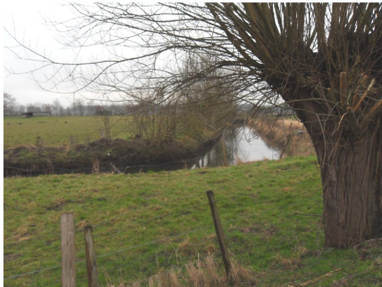
De Assebroekse Meersen

landbouwers. Overigens heeft, onder andere, de landbouw ervoor gezorgd dat veel van de plantenrijkdom in het gebied verdwenen is. Er is echter hoop want sinds het natuurbeheer ernstig is ter hand genomen, is de soortenrijkdom op sommige percelen weer toegenomen. Daarvan heeft ook de zeldzame vlinder, het Oranjepijpje, geprofiteerd. Die begint nu stilaan weer voor te komen in dit landschap. Het was te zien dat sommige plaatsen rijkelijk nat, zo niet overstroomd, waren. Iets wat typisch is voor laag gelegen meersen. Daardoor echter zijn deze meersen een verblijfs- en foerageerplaats voor allerlei gevogelte