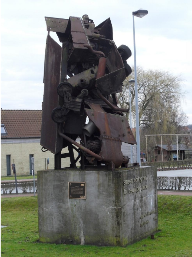
Het anti-oorlogsmonument aan de Moerbrugge

hoogd. Nadien kon de natuur weer zijn rechten