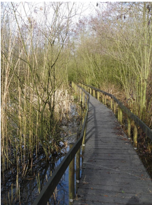
Het „knuppelpad“ door een dode meander van de Rivierbeek.

hoogd. Nadien kon de natuur weer zijn rechten