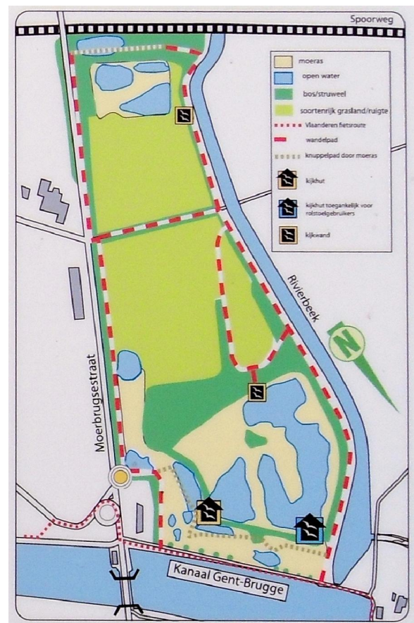
Een kaartje van de Warandeputten