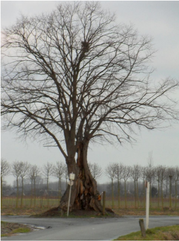
De spooklinde. Ongelooflijk geteisterd maar nog steeds levend.

in brand heeft gestaan en dat hij door de bliksem werd getroffen. Deze boom zou echter niet met spoken verbonden zijn indien er niet allerlei verhalen daarover de ronde deden. Sinds de middeleeuwen al wordt er van alles over deze plaats en deze boom verteld. Wie vroeger 's nachts tussen Bavegem en Vlierzele op weg was zou nooit de linde voorbij zijn gegaan zonder een kruis te slaan. Zoals bekend gaan heksen, tovenaars en spoken daarvoor schielijk op de vlucht. Het staat namelijk vast dat de heksen hier dikwijls een sabbath hebben gehouden. De beruchte roverhoofdman Jan de Lichte, die Zuid-Oost-Vlaanderen met zijn bende op het einde van de 18 de eeuw onveilig maakte, zocht ooit een schuilplaats in deze spooklinde en genoot zo tijdelijk van de gastvrijheid van de onzure creaturen. Nu ja, soort zoekt soort, nietwaar? Later werd hij toch gegrepen en met een deel van zijn trawanten terechtgesteld op de Grote Markt in Aalst. Een ander verhaal vertelt van een veekoopman die daar bij avond voorbijreed, vergezeld van zijn vrouw. Veekooplui zijn, zoals bekend, zo arrogant als de