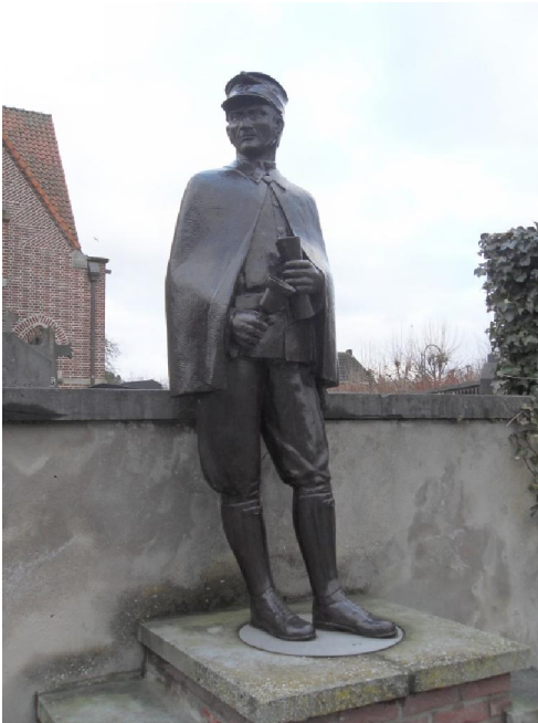
De veldwachter, annex belleman