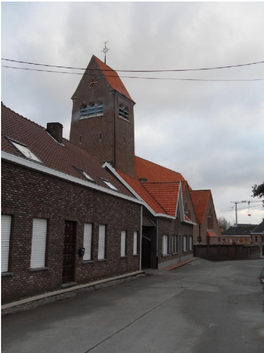
De kerktoeren van Letterhoutem

ziekte en zo brutaal als de pest en dus sprak de man tot zijn vrouw: 'Men zegt dat de duivels hier 's nachts komen. Laat ze dan nu maar eens komen!' Het volgende ogenblik werd de paardenkoets omringd door kleine mannetjes met rode mutsjes. De man vertrok zo snel hij kon en is nooit meer op die plaats terug geweest. Volgens mij heeft hij echter onschuldige kaboutertjes gezien maar ik kan het natuurlijk verkeerd voorhebben.