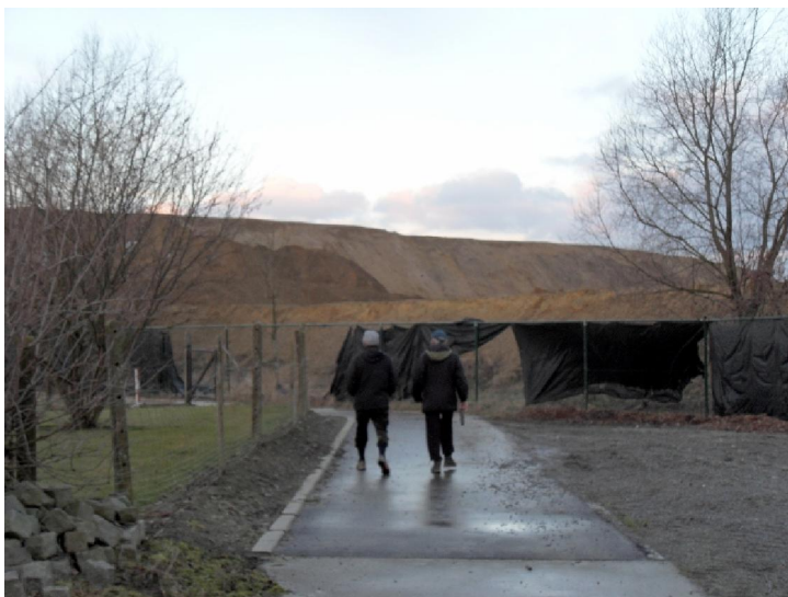
De deponie van Vlierzele. Al dragen deze bulten een mooie naam, ze stinken evengoed infaam.

Vanuit deze hemelse sferen tuimelde ik al snel weer naar de aarde. Niet alleen doordat er op eigen kracht 18 kilometer moest gestapt worden maar ook doordat er zeer hoge heuvels in het zicht kwamen. In eerste instantie was het me niet duidelijk wat men hier aan het uitvoeren was. Het was namelijk zonder meer duidelijk dat die heuvels mensenwerk waren.