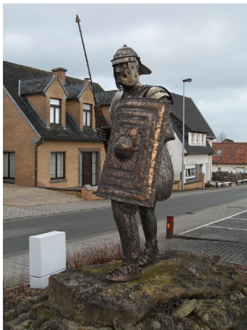
De Romein. Hij bewaakt nu een kastje van de teledistributie.

Het spreekwoord zegt: „Rust, roest“ maar hier was het „rust, Rot“. Het heet daar nu eenmaal zo: Rot. Kort en goed(?) Er zijn hier nog wel wat curieuze plaats- en straatnamen. „Uilenbroek“ bijvoorbeeld, waar de wandeling begon. En Hasselten-Broek. Of Morelgem. Dat laatste