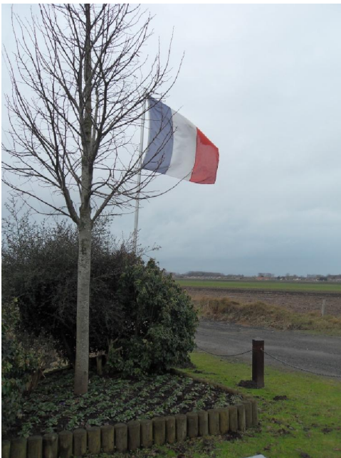
De „vriendschapsboom“ met de Franse driekleur.

plaatst omdat het beter uitkwam met de aanleg van een pleintje maar dat heeft men snel weer moeten corrigeren. In de hiërarchie van de grenspalen staat dit soort vooraan. Hier heeft men de grenssteen extra verzorgd door er een perkje rond aan te leggen dat in een ander seizoen vol staat met bloemen.