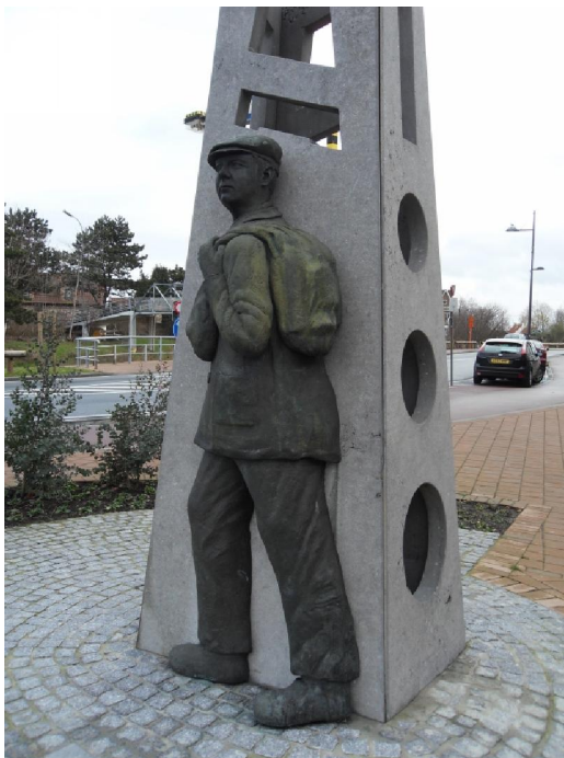
...en zijn tegenhanger: de Blauwer.

in Vlaanderen en vermits Adinkerke aan de Franse grens ligt, komen ook vele Fransen zich hier bevoorraden. Te midden van al dat commerciële geweld staat een beeldhouwwerk dat gewijd is aan een tamelijk recent verleden toen de grens nog diende om de huidige lidstaten van de EU van elkaar te scheiden. Het illustreert de voortdurende strijd tussen de douanier en de zogenaamde „Blauwer“. Een smokkelaar dus. Aan de ene kant van de zuil staat een douanier met een fiets waarvan de band plat staat, aan de andere kant iemand met een „balluchon“ over de schouder, de smokkelaar. Wat verder heeft een particulier een heel andere kijk op de beeldende kunsten. In het tuintje is een duizelingwekkende verzameling beelden samengebracht van... kabouters!