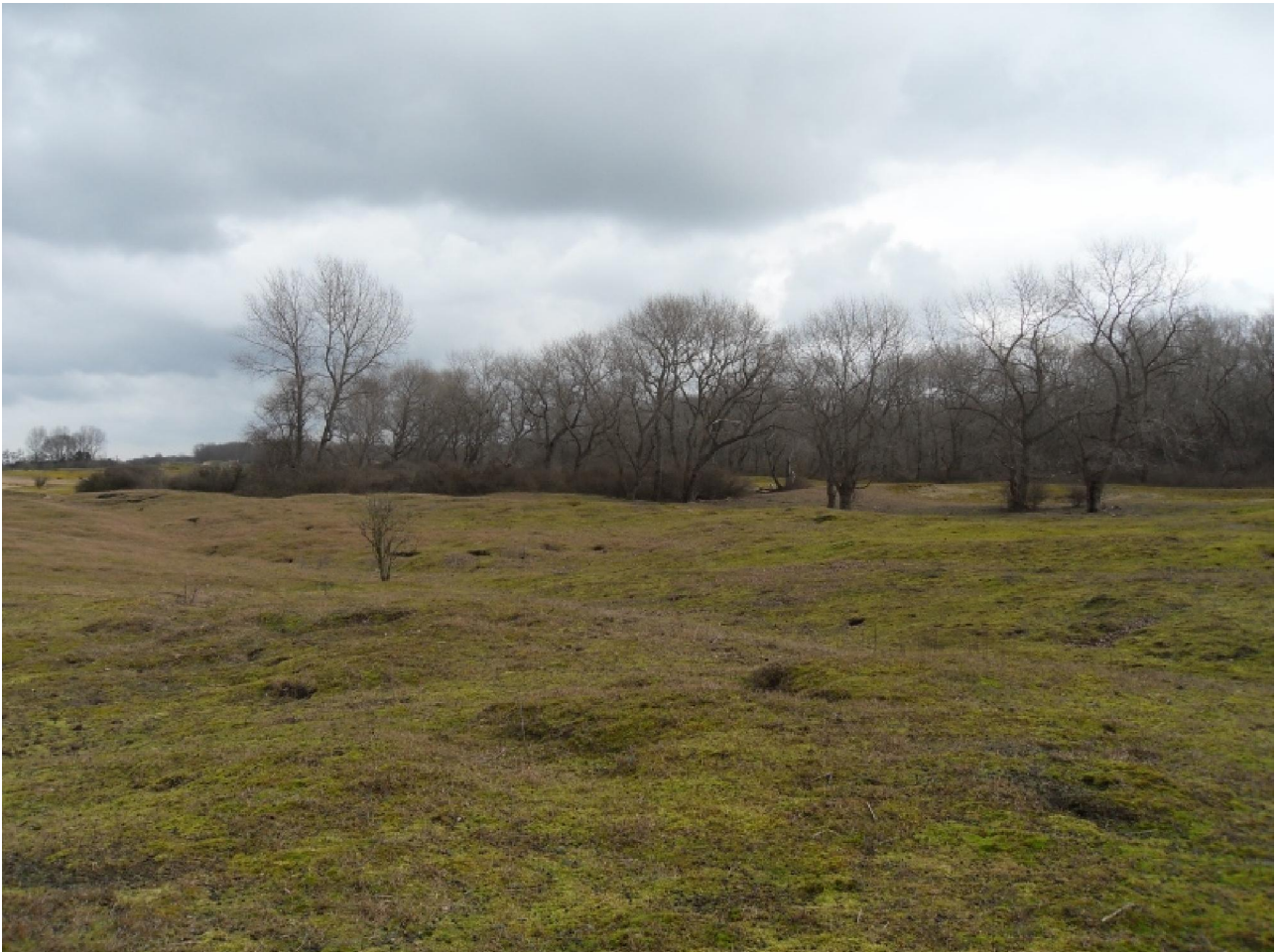
La Dune Fossile de Ghyvelde. Met konijnenplaag.

gemaakt van de Maginotlinie. Een Franse verdedigingslinie die tussen de twee wereldoorlogen is gebouwd. De bunkers hier dienen nu tot fort voor de vleermuizen die er willen in verblijven.