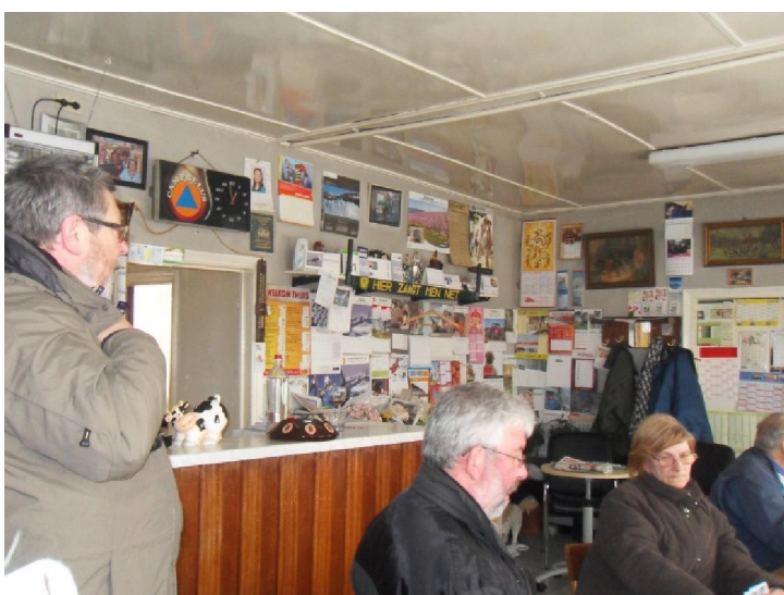
Een stukje van het interieur van het café Au retour de la chasse. De kleurrijke vlakken zijn allemaal maandkalenders.

Aan het einde van de Cabourweg botsten we, figuurlijk gesproken, op de staatsgrens. Die is vrij concreet doordat er nagenoeg op de grenslijn een afsluiting staat. Die afsluiting zijn we naar rechts gevolgd tot bij het bruine volkscafé „Au retour de la chasse“. Een benaming die nog dateert van toen meneer Cabour hier zijn jachtgronden had. Het café schijnt in zeer brede kring bekend te zijn. Het interieur munt uit door de aanwezigheid van een hele