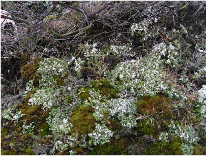
Zomersneeuw of Elandgeweimos (Cladonia foliacea)

het waarnemen vanaf de zijkant. Bij de afsluiting groeide op een bepaalde plaats het zeldzame Zomersneeuw. Een mossoort die je nagenoeg nergens elders meer aantreft. Het ontleent zijn naam aan de blinkend witte vlekken die het de toeschouwer toont. Vlakbij Ghyvelde was er nog een opvallende witte vlek te zien tussen de voor de rest wat dorre bodembedekking. Dat was echter geen Zomersneeuw maar het waren sneeuwvlokjes. De eerste die ik dit jaar heb gezien.