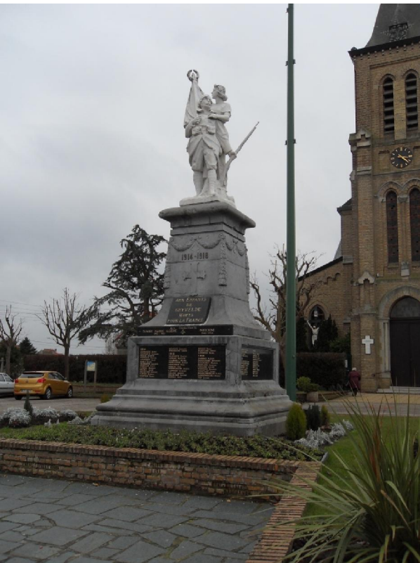
Het gedenkteken voor de gesneuvelden in té vele oorlogen, met té veel namen erop

nieuw gebouw ondergebracht te zijn. Het monument voor de kerk „Aux enfants de Ghyselde, morts pour la France“ toont een indrukwekkende reeks namen. Niet enkel voor de tijd tussen 1914 en 1918. Blijkbaar zijn er ook nog wat Ghyseldenaren achtergebleven in „Indochine“ en in Tunesië, Marokko en Algerije.