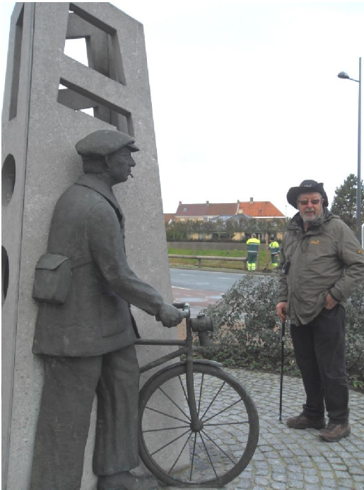
De douanier (links)