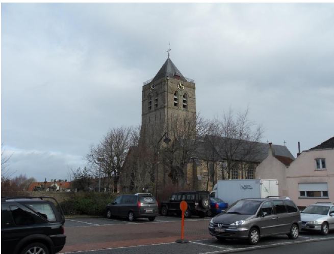
De Sint-Audomaruskerk in Adinkerke