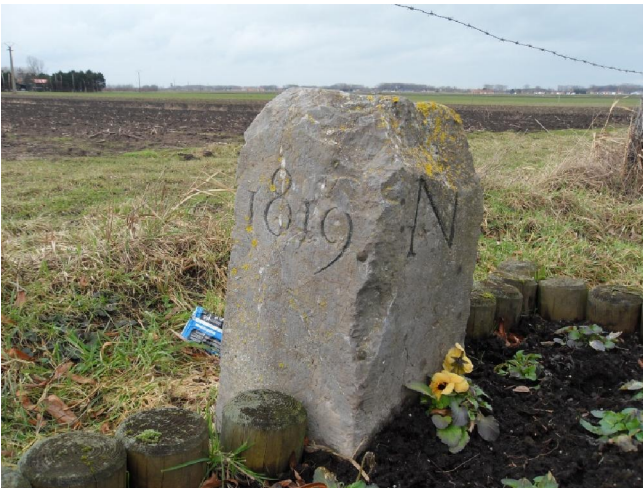
De aloude grenssteen nabij het café.

zetten wanneer de maand wisselt. Er is ook een opschrift dat zegt: „Verboden te zagen“. Volgens sommigen kunnen ze dat beter gaan zeggen in het Cabourdomein.