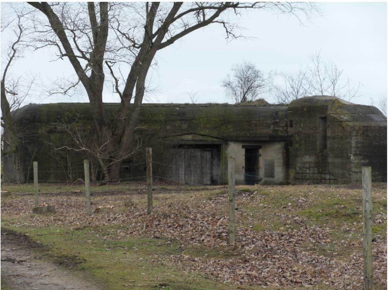
De grootste, nog vrij goed bewaarde bunker van de Schlieffenbatterij.

Tijdens de Tweede Wereldoorlog was hier de veldbatterij Schlieffen gelegerd. Die is in twee fasen gerealiseerd. Eerst, tussen juni 1940 en maart 1942, werden zes open geschutsbatterijen geconstrueerd. Hierbij behoorde ook een schietstand. In een tweede fase, tussen eind 1942 en 1944, kwam in het kader van het “Schartenbauprogramm” de eigenlijke veldbatterij tot stand. Eind 1942 werd begonnen met de bouw van de commandobunker; begin 1943 volgden de geschutsbunkers. De uitvoering gebeurde door de Organisation Todt en de firma Bytebier uit Gent. Voor de camouflage van de commandobunker werden graszoden uit een nabije weide gebruikt. De veldbatterij Schlieffen werd op 6 september 1944 door de Duitsers verlaten, zonder ooit actief aan de strijd te hebben deelgenomen. Sommige van die bunkers zijn nog in zo goede staat dat ze kunnen bezocht worden. Al kan dat alleen onder leiding van een gids en mits aanvraag met de nodige administratieve rompslomp vooraf.