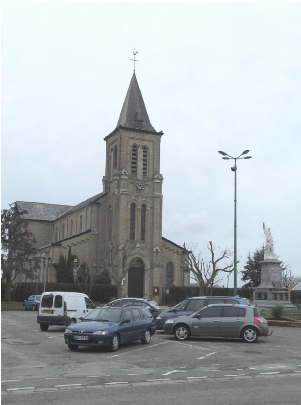
De Eglise Saint-Vincent in Ghyselde