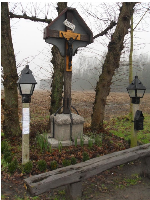
Een stiltegebied met knallende jachtgeweren. Het rijmt niet maar het schijnt hier wel te kloppen

Op het laatste deel van de wandeling zag ik op een stukje braakgrond een bordje staan met de tekst: „Sluikstorter, we zien je! Gemeente Sint-Gillis-Waas“ Met daarbij een opgestoken vinger. Nee, niet die opgestoken vinger. Laten we het deftig houden zeg. Een opgestoken WIJsvinger. Ik vermoed dat de gemeente een bril nodig heeft want ik zag daar meer blikjes, PET-flessen en andere troep in het rond gestrooid liggen dan elders. Misschien was het wel doordat ik er daar vanwege dat bord meer op lette. Tenslotte word je spijtig genoeg toch gewoon aan al die rotzooi.