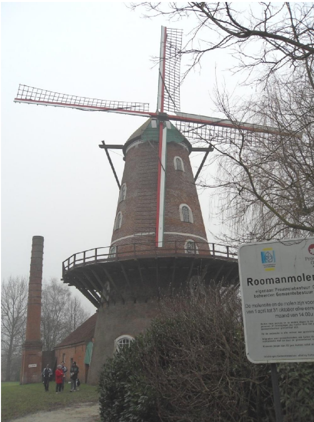
De wel heel indrukwekkende Roomanmolen in Sint-Pauwels. Links de schouw van toen er ook met stoom gemalen werd.