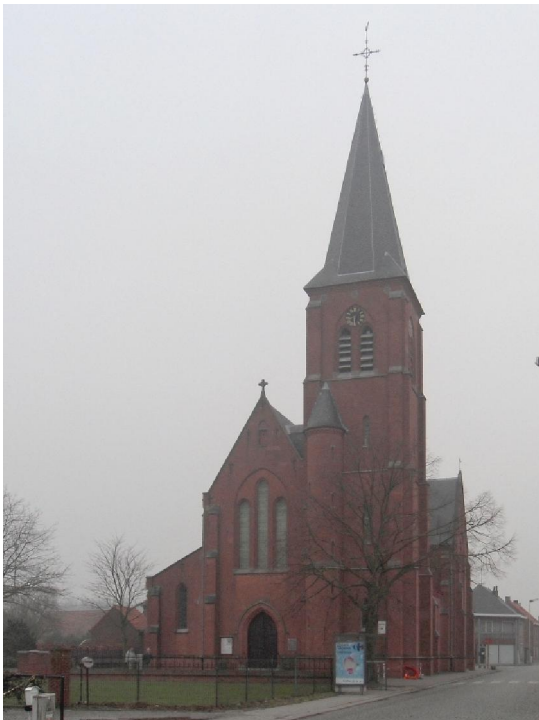
De kerk in Puivelde die we op deze tocht vier keer gepasseerd zijn.

Sint-Pauwels is een dorp in de Belgische provincie Oost-Vlaanderen en het is een deelgemeente van Sint-Gillis-Waas. Het ligt even ten noorden van Sint-Niklaas. In het Waasland dus. Behalve op een paar punten is er over dit dorp nauwelijks verder wat mee te delen. De naam duikt wel op in het verhaal „De Vedelaar van Sint-Pauwels“ in de stripreeks „De Rode Ridder“. Maar alleen daarop kan je natuurlijk geen reputatie bouwen. Desondanks vertoonde de wandeling toch een paar interessante aspecten. Dat was wel nauwelijks te wijten aan de inrichters van deze Lichtmiswandeldoortocht, de Wase Steinbockvrienden. Zoals ik van hen gewoon ben, was er hier en daar nogal met de natte vinger te werk gegaan om