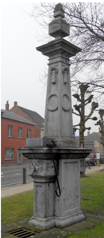
De arduinen dorpspomp uit 1777 op de Dries.

Na nog een rondje door de velden ging het op het einddoel af. Het landschap is hier helemaal vlak en open. Dat is natuurlijk niet verwonderlijk voor deze streek. Wat me echter wel verraste was dat in enkele beekjes die ik overstak het water klaterde en snel vlietend was. Hoe dat te rijmen is met het overigens zo waterpas liggende land, is me niet duidelijk. Op weg naar mijn parkeerplaatsje viel me in het voorbijgaan op de Dries (die inderdaad driehoekig is) nog een oude, arduinen waterpomp op. Ik vond later dat die daar neergezet was in 1777.