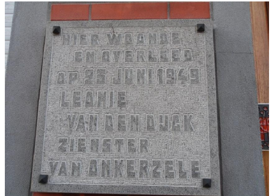
De gedenksteen aan het huis in Onkerzele waar Leonie Van den Dijck gewoond heeft en waar ze ook is gestorven.