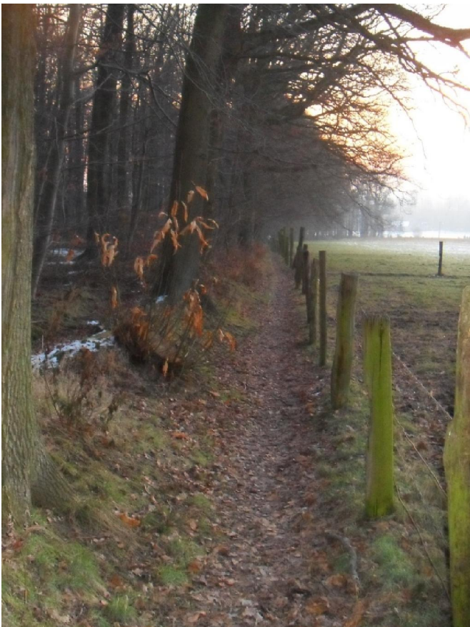
Het paadje op of net over de taalgrens

Het eerste stuk van de wandeling liep langs de Dender die daar in Geraardsbergen een diep dal met steile wanden heeft uitgesleten. Ik heb eens ergens de Dender als een „snel-stromende rivier“ omschreven gezien. Hetgeen me in spontaan gelach deed uitbarsten want ik ken de rivier niet anders dan als een luie, smerige, trage stroom. Die in Aalst lange tijd tot een stinkende, giftige slang was ontaard. Dat is nu wel wat beter geworden. Het leek er echter op dat ik mijn mening over de natuur van deze rivier moest herzien want op een bepaalde plaats scheen het water hier rond twee eilandjes te bruisen en te borrelen. In het schemerlicht van de maan meende ik iets te onderscheiden als een stuwsluis. Het pad draagt daar ook de naam van „Sasweg“. En inderdaad, veel later bij het bijna laatste stuk van de wandeling, ging ik op de andere oever voorbij aan een complex waar iemand