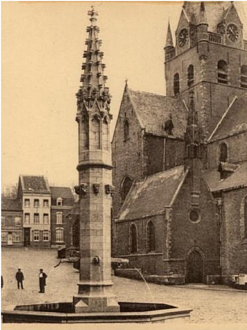
Nog eens de Marbol

Vanaf hier ging het op Onkerzele af. Wel moest eerst nog de hindernis genomen worden van de uitgang van het park die én zeer steil, én zeer glad was. Iedereen sukkelde daar dat het een aard had. Nog iets waar men best wat aan had gedaan. Verder was een aanduiding waar een ongebaande wegel moest ingeslagen worden me niet duidelijk. Dus ging ik weer eens de verkeerde kant uit. Hetgeen me minstens een kilometer extra heeft gekost voordat het muntje gevallen was en de vergissing recht gebreid. Eigen schuld... ja, ja, ik weet het.