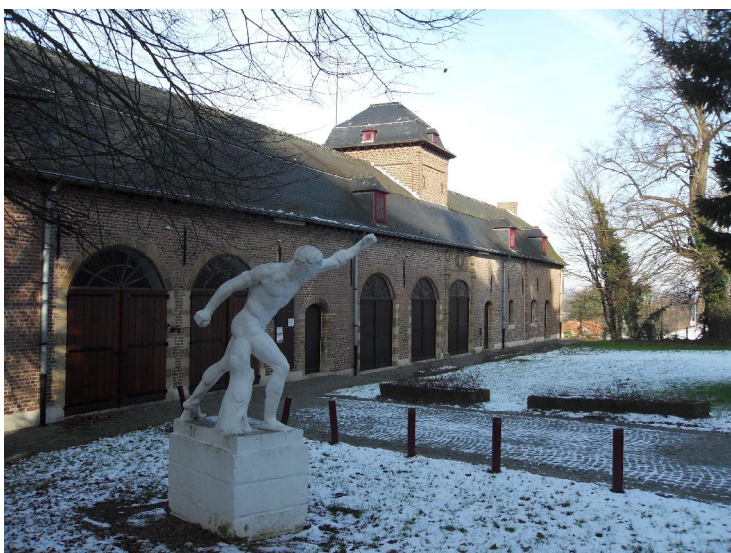
Een deeltje van de huidige abdij.

Langs smalle klinkerstraatjes of kasseien ging ons traject naar het centrum van de stad terug. Waardoor we andermaal in het park terechtkwamen. Na een rondje door een vroegere abdij konden de liefhebbers zich laven aan een gratis jenever die in een tent werd geschonken.