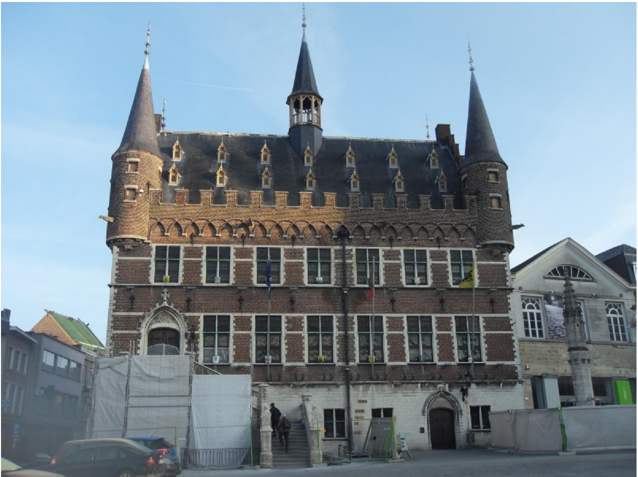
Het stadhuis met rechts ervan de Marbol. Manneken Pis blijft verborgen.

reld een hoge waarde hebben, de kantindustrie met de wereldvermaarde zware Chantilly en in latere jaren het maken van lucifers en sigaren. Een nijver volkje, zo te zien. De Marbol is een verhaal apart. Het is een fontein en een bron op de Grote Markt, voor het stadhuis. Wat er nu staat is een replica van de oorspronkelijke fontein die in 1930 werd verhuisd. Het woord „Marbol“ is een verbastering van „Marktbron“ of “Merckborre“.