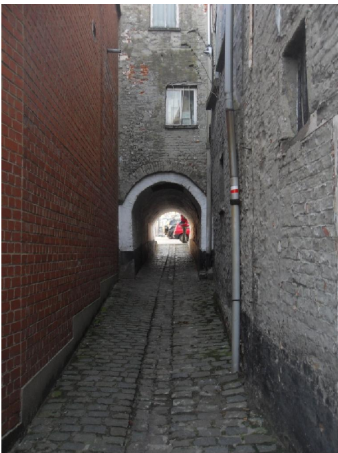
Op naar de Grote Markt. Doorheen deze rioolbuis.

enkel geïnteresseerd is in het bewegen maar ook in de achtergrond van waar die beweging plaats vindt. Behalve in een drietal gevallen heb ik het nog niet meegemaakt dat er onderweg door de inrichters informatie wordt verschaft over wat men daar ter plaatse aanschouwt. Heel jammer dikwijls, want zo mist men veel van het gebodene onderweg. In dit geval heb ik pas achteraf gezien dat een stuk van het pad net over de taalgrens en er evenwijdig mee liep. Een stukje triviale wetenschap, ik weet het. Maar toch... Voor het echter zover was, presenteerde zich alweer een bron van twijfel over het te volgen pad: een ontbrekend pijltje. Moest men nu links of rechts? Van het te hoop lopend kluitje wandelaars boden zich twee vrijwilligers aan die op verkenning uitgingen en die even later beiden met de tijding terugkwamen dat er verder ook geen pijltjes meer te zien waren. Eén van de wandelaars wist te vertellen dat het wegnemen van pijltjes in Geraardsbergen vaste prik is en waarschijnlijk een bron van vermaak voor een aantal lieden. Ons dilemma werd opgelost door een opgetrommeld iemand van de inrichters die voorzien van een reservepijl ons weer op de goede weg zette.