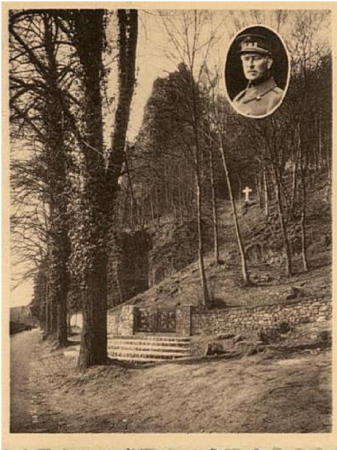
De rots van de koning in Marche-les-Dames. De inzet is een foto van Koning Albert I die daar verongelukte