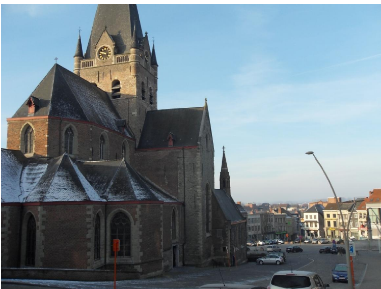
Een kijkje op de Grote Markt met de Sint-Bartholomeuskerk

reld een hoge waarde hebben, de kantindustrie met de wereldvermaarde zware Chantilly en in latere jaren het maken van lucifers en sigaren. Een nijver volkje, zo te zien. De Marbol is een verhaal apart. Het is een fontein en een bron op de Grote Markt, voor het stadhuis. Wat er nu staat is een replica van de oorspronkelijke fontein die in 1930 werd verhuisd. Het woord „Marbol“ is een verbastering van „Marktbron“ of “Merckborre“.