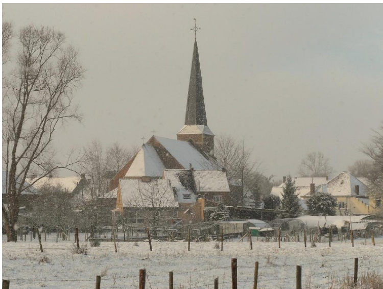
De kerk van Aspelare. Zon én sneeuwval tegelijk.