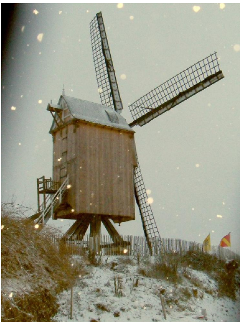
De Molen ter Rijst of Buysemolen in Sint-Antelinks. De witte vlekken zijn sneeuwvlokken!

Deze tocht begon met het bol liggende asfaltweggetje vlak tegenover de kerk, de Krekelbos. Dat weggetje daalt eerst tussen de huizen maar even later verliest het straatje zijn naam en maken de huizen plaats voor de aanblik van een heuvelend landschap. Iets waarvan dit keer slechts weinig te zien was. Dat kwam doordat het nog donker was om ongeveer half acht in de morgen en bovendien doordat de sneeuw nog altijd dicht door de wind werd voortgejaagd. Het tegelpaadje leidde vrij steil naar beneden, naar de Steenbeek toe. Deze wandeling had immers als ondertitel „Steenbeektocht“ meegekregen. De bewuste beek ontspringt op de Hoogkouter en mondt even verder bij het Oud Dorp uit in de Molenbeek. Vanaf de Steenbeek gaat het pad weer omhoog. En nogal steil ook want het gaat hier naar het hoogste punt op de wandeling: 80 meter boven de zeespiegel. Hoewel het hier nog niet zo heet, heeft het landschap toch de allure van de Vlaamse Ardennen. Met hoogteverschillen tussen 20 en 80 meter. Boven op de 80 meter hoge kam ligt het gehucht Hoom en de baan heet hier dan ook Hoomweg. Bij voorgaande wandelingen had ik van een weinig verder kijk gekregen op een houten windmolen. Die was nu, in het aarzelende ochtendlicht en door de immer vallende sneeuw niet te zien. Dat was ook niet nodig want dit keer ging de wandeling er recht naartoe!