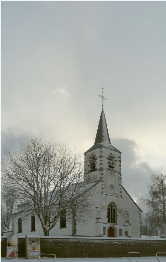
De kerk van Nederhasselt

In de vers gevallen sneeuw was het eigenlijk wel gemakkelijk stappen. De schoenen hadden een redelijk goede grip op deze poederige ondergrond. Waar echter auto's gepasseerd waren, was het uitkijken want die harde sneeuw was echt soms gevaarlijk glad. Nu en dan verborg de sneeuw ook een verrassing. In de vorm van waterplassen die waren dichtgevroren met een dun laagje ijs dat bij het betreden met een hol geluid knapte. Niet dat dat an sich zo link was. Wel soms onaangenaam. Erger waren de ondiepe plassen waarvan het ijs niet brak maar die daardoor uitglijden tot een reëel gevaar maakten. Ik heb het echter zonder belangrijke uitschuivers overleefd.