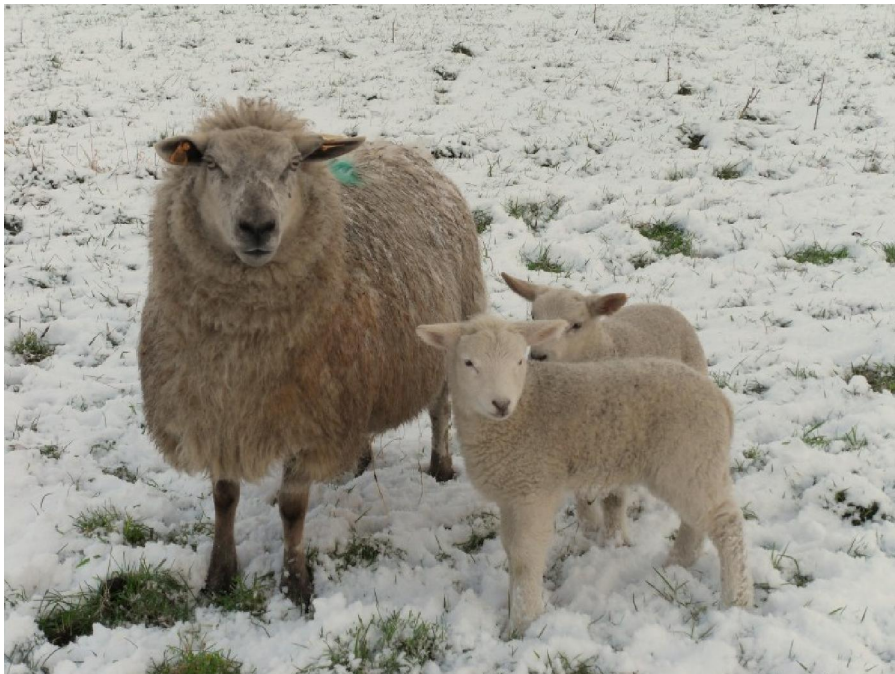
Nieuw leven in de sneeuw. Zou de lente dan toch op komst zijn?

Het laatste stuk van de af te leggen 18 kilometer had niet zoveel geschiedenis. Behalve dat het traject leidde door geleidelijk aan meer bebouwd gebied doordat we Heldergerm naderden. Daardoor werden de stukken weg met verharde sneeuw talrijker. Wat het stappen minder ontspannen maakte. Ondertussen was de zon er in al haar glorie doorgekomen en was de sneeuw ijverig aan het dooien gegaan. Schoonheid is nu eenmaal vergankelijk.