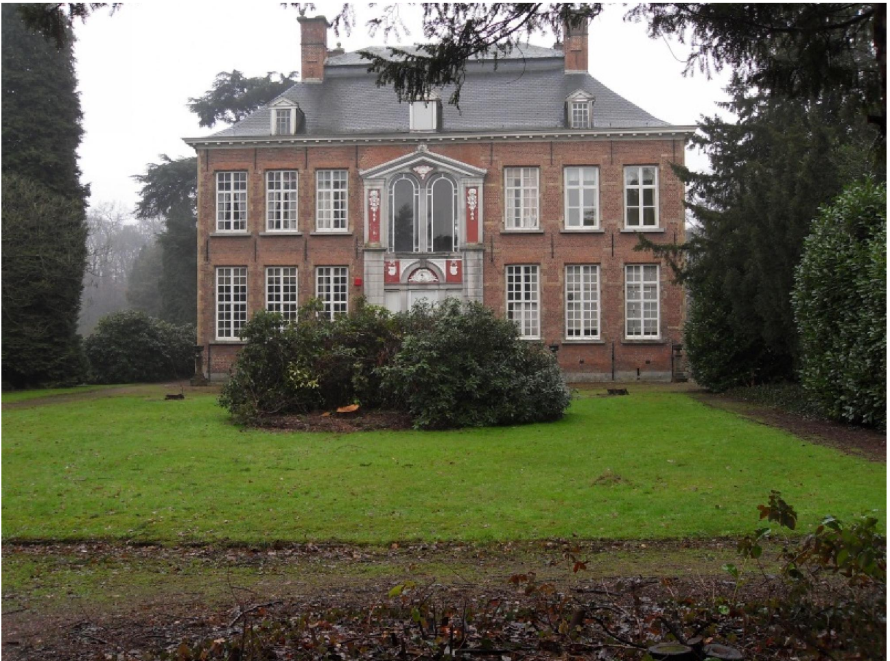
En het kasteel zelf.

Hoewel ik een kaart had gekregen voor de „Witkap trofee“ heb ik het noodzakelijke stempeltje gemist. Die bewuste trofee kan je verdienen door aan elk van de drie wandelingen van de Boerenkrijgstappers in hetzelfde jaar mee te doen. Dat wordt beloond met een kartonnetje... bier. Dat ik mijn stempeltje niet haalde komt waarschijnlijk wel omdat ik niet tot het eindpunt gewandeld ben. Het traject kwam zo dicht bij mijn huis in de buurt en het begon nog wat meer te regenen zodat ik de weg naar huis heb genomen zonder nog eens naar de Festivalhall te gaan. 't Zal me leren!