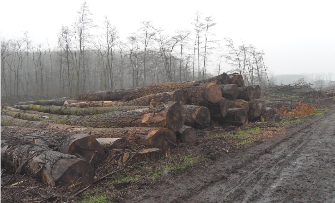
Een wat trieste aanblik, al die geveldde stammen.

Via een met stalen hekken afgesloten, kaarsrechte dreef langs het megalomane stulpje van de eigenaar van die dreef mochten we het Broek induiken. Daar wordt voor het ogenblik lelijk huis gehouden want een groot deel van de populieren is kort geleden geveld en die stammen liggen nu her en der op ophaling te wachten. Waarbij een kaal en zelfs wat