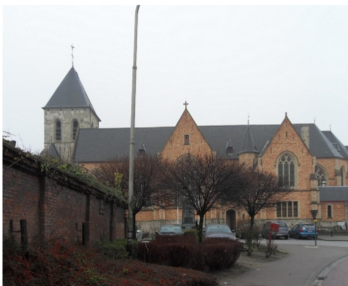
De Sint-Martinuskerk in Berlare

Ter hoogte van het eerder genoemde, moderne, pompstation ging het traject weer op de bewoonde wereld af zodat we terecht kwamen in wat ooit de kasteeldreef was. De uitweg voor de koetsen van de bewoners van dat kasteel. Toen nog afgeboord met monumentale beuken. Die laatsten hebben de Tweede Wereldoorlog niet overleefd want ze werden geveld om tot brandstof te dienen. Wat overigens ook het geval was met de turf die toen uit het Broek werd gehaald. Om maar voorbij te gaan aan de bomen daar die toen illegaal werden omgelegd. Nu begint de kasteeldreef stilaan weer een beetje van zijn oude allure terug te krijgen. De beuken die er zijn aangeplant in een vierdubbele rij, beginnen weer wat omvang te krijgen. Op het driehoekige stukje gras voor de poort van het kasteel stonden, toen ik nog naar school ging in Berlare, de overblijvende majestueuze beuken waar we beukenootjes gingen rapen voor en na schooltijd. Ze zijn er niet meer... Die school trouwens ook niet meer.