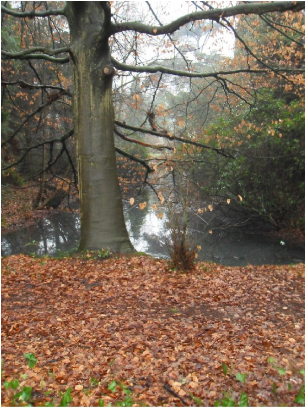
Een kijkje op het domein van het kasteel van Berlare (door het hek)

Ik weet dat er ook nog een Paul Cammermansstraat is. Dat was een acteur. Bekend van televisie, de film en het theater. Maar in die straat kwamen we dit keer niet. Via de insteek aan „De Halve Maan“ (een café) ging het weer het Broek in. Over het Schuitje op de aankomst aan die daar nog een drie- of viertal kilometer vandaan was.