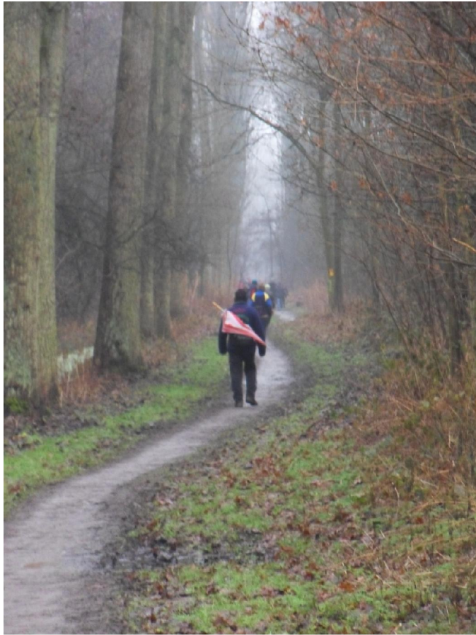
Volk, volk, zover je kijken kon!