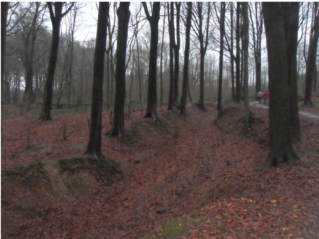
Holle wegen, beuken, beekvalleien... je vindt het allemaal in het Kluisbos.

is en dat tot vreugde van een aantal vogelsoorten, zoogdieren en zwammen. Mettertijd zal dus een veel gevarieerder beeld ontstaan. met een veel grotere rijkdom aan soorten.