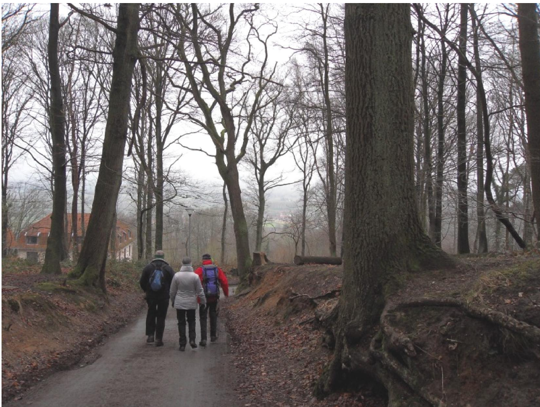
Aan mooie vergezichten was er op deze wandeling geen gebrek. In de diepte is nog net de vlakke Scheldevallei te zien.

Er was ons 21 kilometer beloofd maar ik had de stellige indruk dat ik minder ver had gelopen. Een indruk die later bevestigd werd door mijn wandel-GPS. Die beweerde dat het „slechts“ 18,6 kilometer geweest zijn. Tot slot had ik nog even moeite om het autootje terug te vinden. Het was nog donker toen ik het achterliet en dan is het later soms moeilijk oriënteren. Bleek het uiteindelijk te staan vlak tegenover de Sint-Corneliuskerk en de steen die het begin van de Eddy Merckx-route aangaf. Dat ik dát niet gezien had!