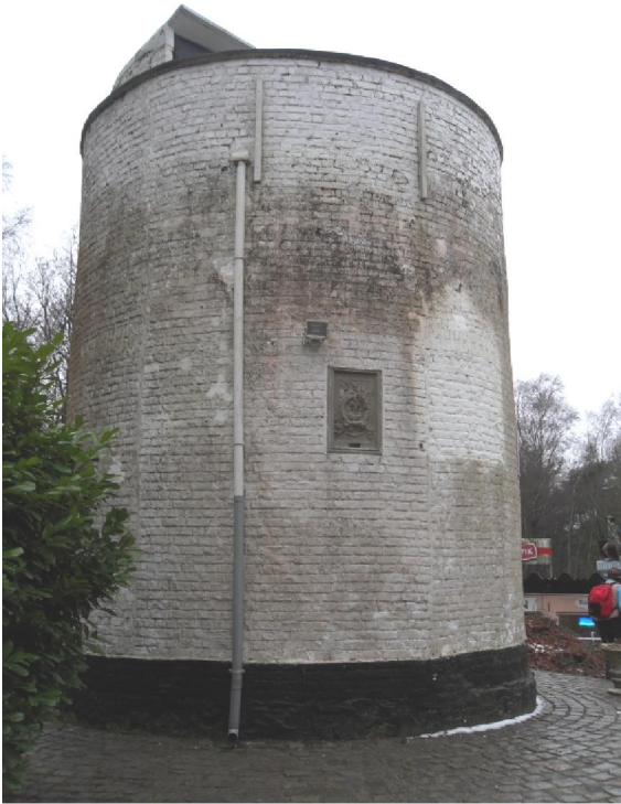
De uitkijktoren van Napoleon op het hoogste punt van de Kluisberg. Let ook op de authentieke plastic afvoerbuizen.

schijnt ondertussen wel vast te staan dat hij met baksteen uit de 18 e eeuw is gemetseld. Het schijnt verder dat hij Napoleon tot uitkijktoren heeft gediend.