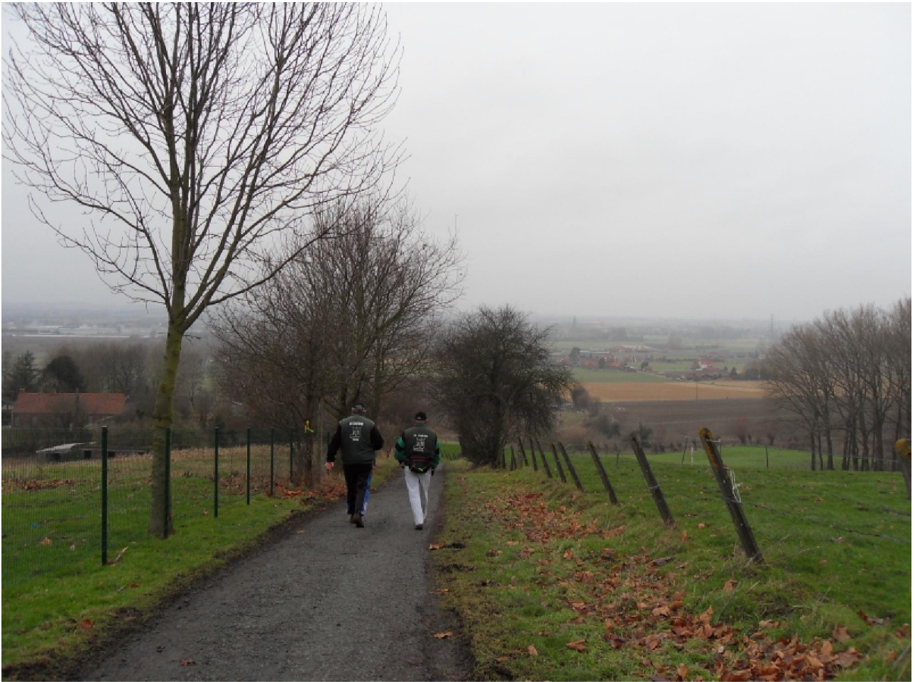
En nog eentje, om het af te leren