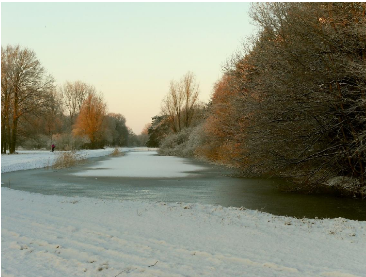
De Linie in volle wintertooi

Via Het Kalf (zo heet het daar echt) en De Gavers leidde de wandeling ons in het Stropersbos. Afhankelijk van de bron zegt men dat het Stropersbos tussen de 250 en de 480 ha groot is. Voor onze streken is dat gigantisch groot. Het is hoe dan ook een natuurgebied met zowel naald- als loofbomen, met akkers en schrale gronden. Het bos is doorweven met een netwerk van sloten. Die dienden in het verleden om de grond te draineren zodat er bomen konden op geplant worden die een economische waarde hadden. Zo zijn daar de grove den, de lork, de douglasspar en de fijnspar verschenen. Eigenlijk horen die bomen daar helemaal niet thuis want die verkiezen een veel drogere grond. Er bestaan concrete plannen om die soorten te vervangen door inheemse zoals els en vogelkers. Heel vroeger was het gebied een mozaïek van elzenbroekbos, heide en schraal grasland. Naar dergelijke biotopen moet in Europa binnenkort met een lantaarntje gezocht worden. Daarom zal het lopende project proberen om die vroegere toestand zoveel mogelijk te herstellen. Ik zag dat er delen van het gebied waren die nu al omheind zijn maar die toch publiek toegankelijk blijven langs zelfsluitende poortjes. Het ziet er dus naar uit dat men ook daar