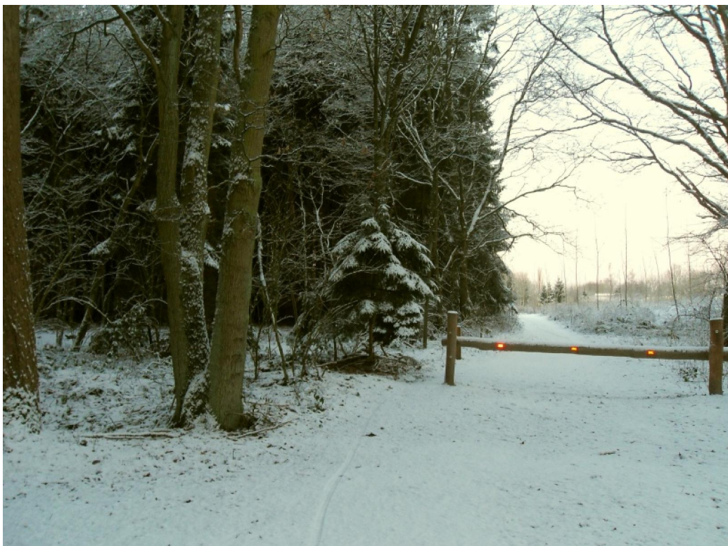
Een klein stukje van het Stropersbos

de kaarsrechte wegen waren die van verre als kleurige schimmen tegen het wit zichtbaar. Ze beschikten, naar ik hoopte, over een beter nachtzicht dan ik. Dat bleek goed gegokt en in de Malcontentenstraat heb ik ze voorbijgestoken. Tot mijn tevredenheid. Niet veel later