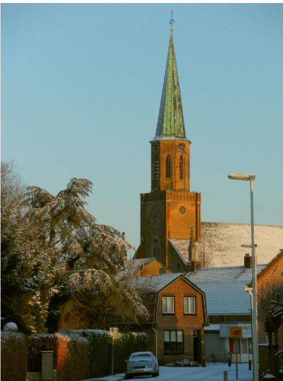
De kerk van Sint Jansteen

Daarbij verweerde de buitenste houtachtige laag van het vlas en zo liet ze zich nadien gemakkelijker verwijderen van de vezels binnenin. Die vezels waren het vlas dat verder gesponnen en geweven kon worden tot lijnwaad. Waar het uiteindelijk om te doen was. De kleinschalige akkertjes werden ingezaaid met rogge. Van beide teelten blijft nu niets meer over. Ten zuiden van Heikant liggen de Wilde Landen. Een gebied met weilanden en populieren. Hier zijn ook enkele plassen van zoet water te vinden die nooit droog komen te staan. Het geheel is een heel mooi en uitgebreid gebied dat intens gebruikt wordt voor recreatie. En wij mochten het dit keer bewonderen in een ongewone setting.