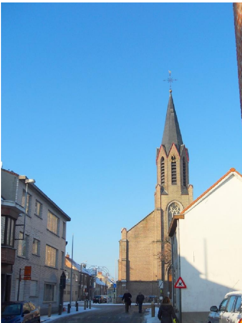
De kerk van De Klinge

gemeenten in 1795 hadden de Fransen de Belgische en de Nederlandse plaatsen tot één gemeente samengevoegd. Koning Willem I maakte daar in 1815 een einde aan. Op de kaart werd een streep getrokken en nu loopt de grens dus tussen de beide dorpen door.