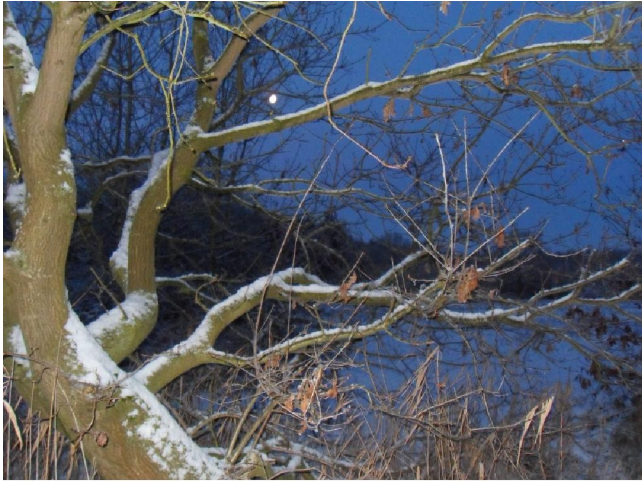
De maan (het lichtende puntje) gaf niet zoveel licht

achterhoofd tegen de grond was gesmakt. Hetgeen hem op drie hechtingen kwam te staan. Hij had nog steeds wat last met hoesten en lachen.