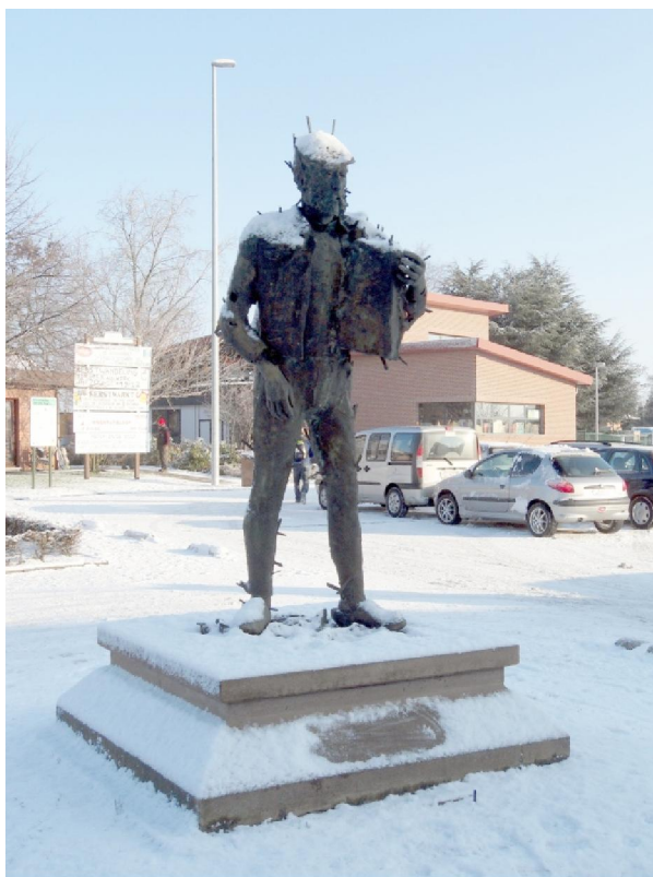
Een beeldhouwwerk voor de zaal waar de wandeling begon (en eindigde).