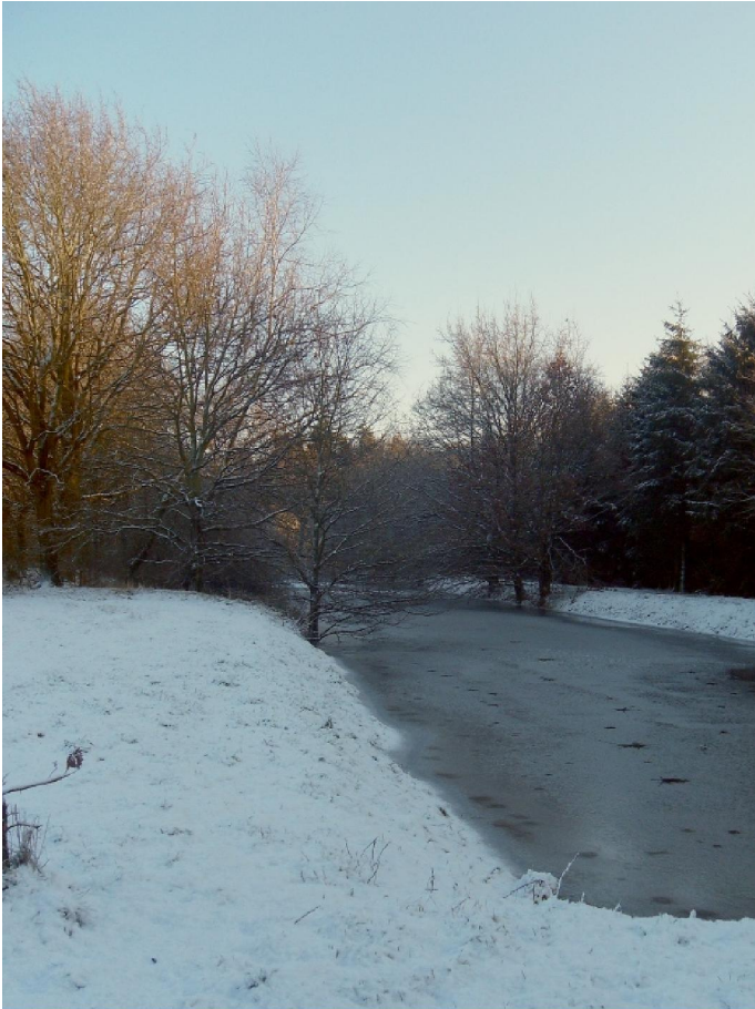
Eén van de kanalen van de waterwinning

Via de Brouwerijstraat en Kapellebrug ging het weer de grens over. Het vroegere grenskantoor is nu een pralinewinkel. Sic transit gloria mundi. Ooit werd ik hier met mijn fietsje tegengehouden en werd mijn „bagage“ (1 boekentas) doorzocht alsof ik verdacht werd van diamantsmokkel. Iedere keer dat ik daar passeer moet ik er weer aan denken. Waarschijnlijk zat die douanier zich daar zo erg te vervelen dat hij het als een verzetje zag om mij eens te doen zweten. Wat verder wachtte het kleuterschooltje „De Paal“. Er staat ook echt een paal. Met een teddybeer er bovenop. Maar meer bepaald staat het schooltje vrijwel op de grens en moet er dus wel een (grens)paal te vinden zijn. Hier was de laatste rust- en controlepost.