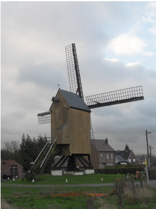
De mooie houten Wildermolen