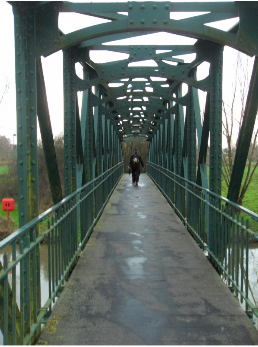
De geklasseerde stalen voetgangersbrug over de Dender in Pollare. De oever waar je naartoe kijkt is grondgebied Eichem.

deze wandellus. De Dender lag er, zoals altijd, heel lui bij en door de overvloedige regen van de laatste weken was het water ook hier modderkleurig en het stond hoog tussen de dijken. Op het laatste stuk dat we van deze trekweg voorgeschoteld kregen, kwam Pollare in het zicht. Het dorp, onderdeel van Ninove, hangt zo'n beetje tegen de steile helling die de rivier heel, heel lang geleden heeft uitgesleten. De dorpskom van Pollare is geklasseerd als dorpsgezicht. Maar dat kregen we enkel van op afstand te zien. Waar de wandelaars wel rechtstreeks mee geconfronteerd werden was de stalen voetgangersbrug over de Dender naar Eichem toe. Deze brug is een balkbrug gedragen door twee stalen vakwerkliggers. De totale constructie is 31,42m lang. Van oplegging tot oplegging heeft de brug een spanwijdte van 31 m. De dwarsverbanden dragen de houten vloer, knooppunten en klinknagels zijn gebruikt voor de verbindingen. Een techniek die heel gebruikelijk was voordat gelaste constructies de regel werden. Wanneer je langs de rivier naar de brug kijkt, blijken de vakwerkliggers een paraboolvorm te hebben. Opmerkelijk is