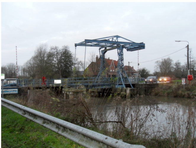
De brug over de Dender in Zandbergen

daar maar zelf eens uitzoeken. In de weiden langs het traject van deze wandeling waren hier en daar zowaar nog trekpaarden te zien. Die staan er constant bij alsof ze nog voor de kar gespannen zijn. Het massieve lijf een beetje naar voor zodat de bovenkanten van hun poten wat voorover staan ten opzichte van de hoeven. Alsof de dieren zich schrap zetten om een zware last voort te trekken. Ondanks dat ze hier niets zwaarder deden dan grazen.