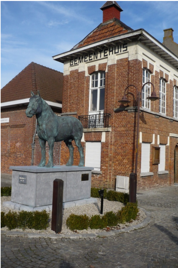
Het standbeeld van Orange I voor het vroegere gemeentehuis in Grimminge. De foto werd gemaakt toen het veel beter weer was.