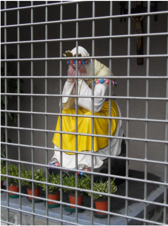
De wenende Lieve Vrouw de La Salette in Appel- terre.

jaar). Een lichtgevende, schitterend geklede, wenende dame die de kinderen toesprak in zuiver Frans. Wat ze geen van beiden verstonden want ze kenden alleen het plaatselijke dialect. Hetgeen niet belet dat ze achteraf haarfijn wisten te vertellen wat de dame had gezegd. Ze kregen een cryptische boodschap mee die het had over "... de arm van mijn Zoon die veel te zwaar is geworden...". Vanzelfsprekend kregen de beide kinderen ook nog een geheim mee dat enkel aan de Paus mocht meegedeeld worden. Elk eentje zelfs. Bij mijn weten zijn die geheimen tot op vandaag nog niet openbaar gemaakt. Vergeten, misschien. De verschijning voorspelde ook allerlei onheil tenzij men zich massaal bekeerde en zich afwendde van gevloek en ander godslasterlijk gedrag. Het is later allemaal uitgekomen en tot in Ierland verrotten de aardappelen. De kinderen kwamen ontsteld in het dorp terug en vertelden wat er gebeurd was. De bron in het dorp die tot dan slechts nu en dan eens water had gegeven begon vanaf dat moment overvloedig te borrelen en dat zou ze nog steeds moeten doen. Met deze verschijning was La Sa-