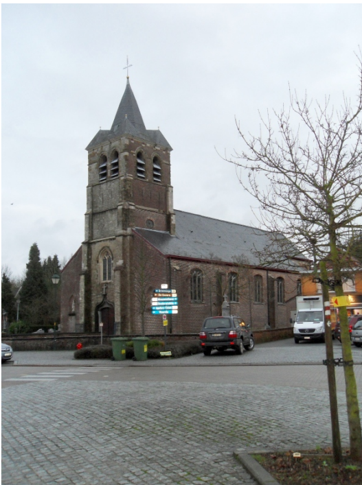
De kerk in Zandbergen

Waarom het zo is, is me niet duidelijk maar in deze tijd van het jaar is het aanbod aan wandelingen buiten de weekeinden meestal beperkt tot Limburg. En dat is me toch wat te ver weg. Misschien dat daar een andere wandelfederatie actief is die door de week iets meer organiseert dan dat hier in „de Vlaanders“ het geval is. In elk geval, de Padstappers uit Geraardsbergen hadden de tweede Wafelentocht gelegd op een donderdag in december. Met succes want de parochiezaal Windekind in Zandbergen was dicht bevolkt. Evenals de straten rond het centrum van het dorp die volop met auto's waren gestoffeerd. Met soms onverhoopte negatieve gevolgen. Maar dat bleek eerst later. Het was een wat moeizame start want degene die de inschrijvingen moest doen kwam maar niet opdagen. Hetgeen wat zenuwachtigheid veroorzaakte. Zowel bij de deelnemers aan de wandeling als bij hen die van dienst waren voor de ondersteunende taken in het zaaltje. Tenslotte nam dan toch iemand het initiatief om onze 1,10 Euro in ontvangst te nemen in ruil voor een deelnemerskaart en een bonnetje voor een gratis wafel achteraf. Er waren er die al eerder zonder inschrijving op pad gingen. Die zijn dus een wafel misgelopen. Tenzij ze er eentje hebben gekocht. Want dat kon ook.