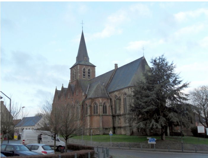
De indrukwekkend grote Sint-Gertrudiskerk in Appelterre

Het is er nog net aan te zien dat dit gebouw vroeger met tabak te maken had. De naam van de eigenaar begint met „TO“. Zou het dan toch Torrekens kunnen zijn?