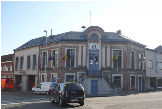
Oudegem: het gemeentehuis met de pui van waar de petattenworp gebeurt.