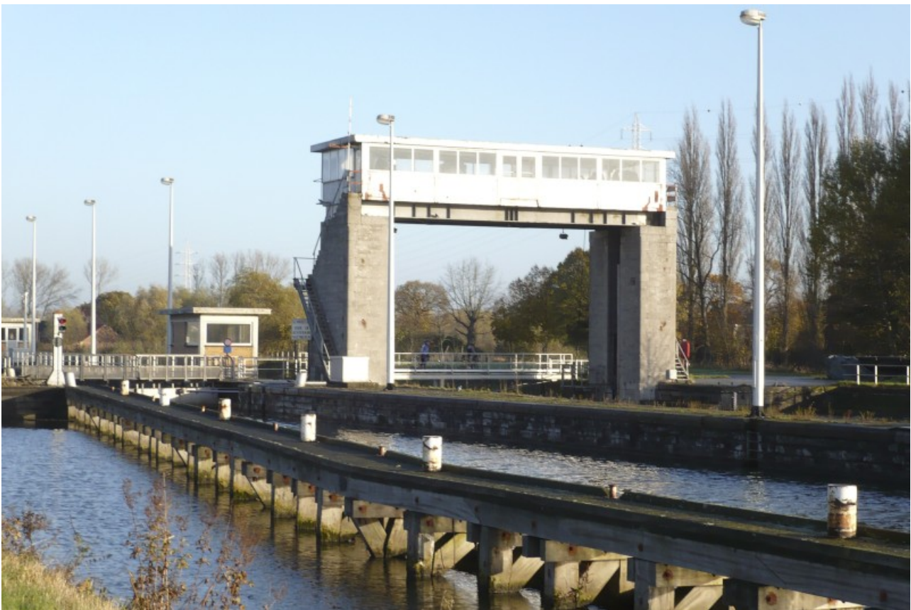
De stuwsuis van Denderbelle op de Dender

aangevangen. Die liggen er lui en werkeloos, niet zelden vervuild en smerig bij. Van de drie wandellussen was de tweede het meest interessant. Dat begon meteen al goed en, zoals bekend, goed begonnen is half gewonnen. Er wachtte ons namelijk al na de eerste bocht een ontmoeting met een heilige. Nee, niet een gipsen beeld zoals er zoveel her en der langs Vlaamse wegen staan, maar een bewegende en pratende goedheiligeman die daar met zijn knecht (pardon: assistent) pontificaal onder een baldakijn aanwezig zat te zijn. Men zal begrijpen dat een dergelijke confrontatie mij terstond met de nodige piëteit vervulde. Tegelijk echter rezen er bij mij ook ernstige twijfels. Immers, hier in de streek wordt men altoos voor het dilemma geplaatst: wie is hij? Ja, ja, het lijkt simpel genoeg. Het is de Sint. DE Sint. Daaraan moet je niet twijfelen. Maar pas op: er lopen hier dikwijls twee soorten Sinten rond: Sint Maarten en Sinterklaas, namelijk. Die twee zien er volkomen gelijk uit en ze doen ook hetzelfde. Ze brengen de brave kinderen lekkers en speelgoed. De ene (Sint Maarten) op 11 november en de andere ergens begin december (ik onthoud nooit precies wanneer, want van Sinterklaas kreeg ik nooit wat, dat vond ik dus eigenlijk maar een wat dikdoenerige zeveraar). In het land van Dendermonde (en zelfs in Aalst!) komt Sint Maarten. Behalve hier en daar wat uitzonderingen. Dus heb ik me ver-