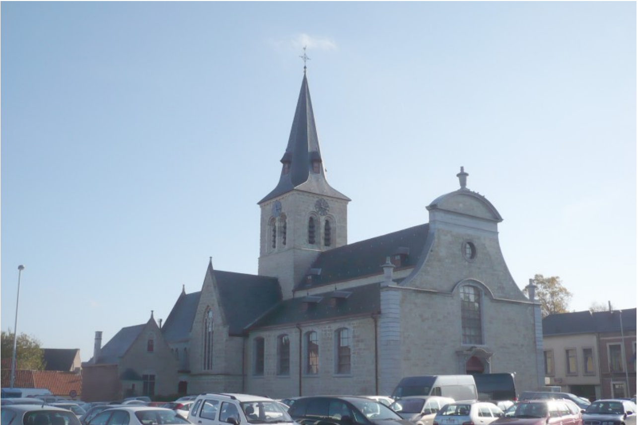
Oudegem: de Onze-Lieve-Vrouw-Hemelvaartkerk

creatief waren dan elkaar communotair afkatten. Een Vlaamse petat is een aardappel. Bovendien is één van de personages uit de roman het jonge, naïeve Petatje, een weesjongen die bij Titten wel een potje mag breken maar die door de zure Naten genadeloos getergd wordt. De petattenworp dus. Daarbij vliegen veldvruchten de inwoners van Oudegem rond de oren. Vanop de pui van het gemeentehuis worden die petatjes in de mensenmenigte gegooid en er is daarmee één enkel handgemaakt gouden sieraad te winnen. Het evenement start om zeven uur 's avonds wanneer Titten himself zijn medeburgers toespreekt. Hij doet dat zoals dat tijdens een echte verkiezingsmeeting, zo'n tachtig jaar geleden, ook gebeurd zou zijn. De schalkse Titten doet daarbij zijn best om het politieke landschap op een heldere manier te schetsen en om iedereen, zonder uitzondering, een veeg uit de pan te geven. Na deze toespraak worden ongeveer 1000 verpakte petatjes in het volk gegooid en in eentje daarvan zit een waardebon die recht geeft op het bovengenoemde sieraad. Of er bij dit gedoe ook gekwetsten vallen is me niet bekend. Het zou me echter allerminst verwonderen.