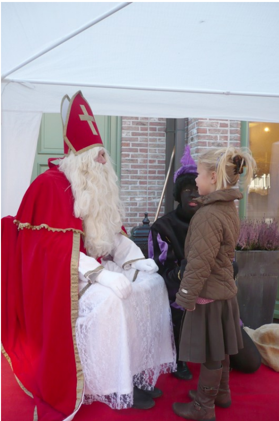
De Sint. Maar welke?

extra in de verf zette, kleurde deze tocht soms wel bijzonder somber of zelfs grimmig. Aan het weer lag het niet. Een vrijwel wolkenloze hemel van een teer pastelblauw, afgeboord met een lichtroze rand, soms een glanzend vliegtuig als een verdwaalde hoogtechnologische meteor. De omgeving is iets waaraan ook de organisatoren niets kunnen veranderen. Die moeten we dus maar nemen zoals ze erbij ligt. De inrichters van de wandeling hadden overigens hun best gedaan het traject zoveel mogelijk anders uit te tekenen dan vorig jaar. Dat bleek uiteindelijk een zeer onregelmatig klaverblad te zijn waarbij we tot drie keer toe in het startpunt terug moesten komen. Waar het derhalve gaandeweg wel heel erg druk werd. Doorheen het gebied loopt de intens bereden spoorweg van Dendermonde naar Gent en die moesten we herhaalde malen oversteken of we liepen er langs. Niet bepaald mijn favoriete wandelomgeving. Het landschap zelf is overwegend vlak. Wat verderop heeft de natuur zich een beetje geoefend in reliëf maken door al eens een plooi te proberen maar de aanwezige beekjes hebben er verder niets mee