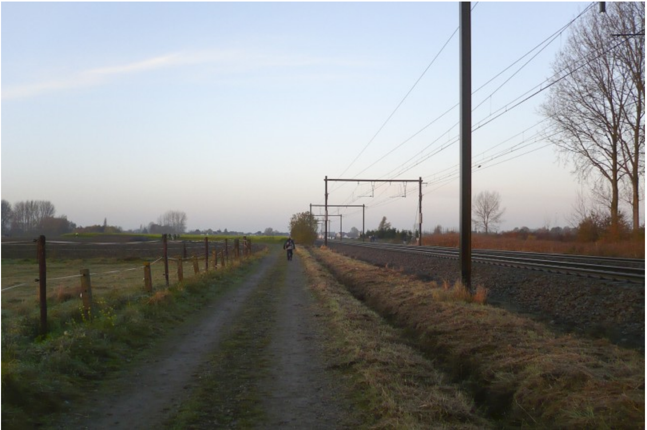
Een vlak landschap met spoorweg. Hier moesten we een lus maken om even verder aan de andere kant langs het spoor weer uit te komen en weer een eind terug te wandelen.