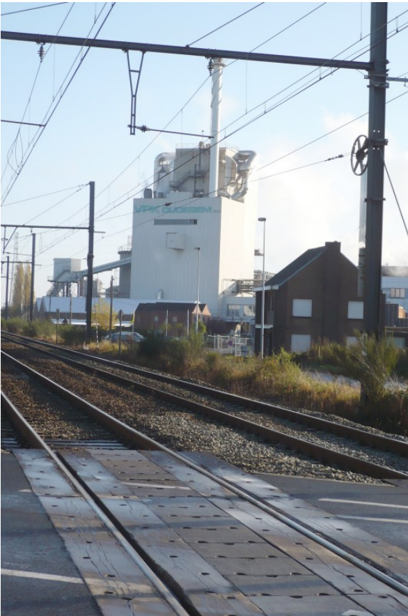
VPK en het spoor

het geval. De Sint Aldegondiskerk is volledig in natuursteen gebouwd op één van de weinige verhevenheden in het terrein. De torenspits ziet er met zijn appel- en peervorm wat eigenaardig uit en, nog merkwaardiger voor zo'n klein dorp, de toren heeft ook nog eens een beiaard met 21 klokken. Je blijft je verbazen. Ik vraag me af wie hier die beiaard komt bespelen. Bij de kerk, op het dorpsplein, staat een zuil waarvan ik dacht dat het een schandpaal was. Dat blijkt eerder ongeveer het tegengestelde te zijn, namelijk een heerlijkheidspaal. Zo'n ding werd er door een rijkard gezet om de heerlijke rechten van een familie duidelijk te maken. In dit geval van de familie Goubau. De paal draagt het gehelmde wapenschild van deze familie. Indien ik niet vergis werd de dorpskern van Mespelare indertijd gebruikt voor de verfilming van De Filosoof van Haagem als dorpskern van... Haagem. Het voldoet inderdaad beter aan het stereotype van het Vlaamse boerendorpje uit de streek dan het authentieke Oudegem. Ze zullen er in het echte Haagem allicht niet mee kunnen lachen hebben.