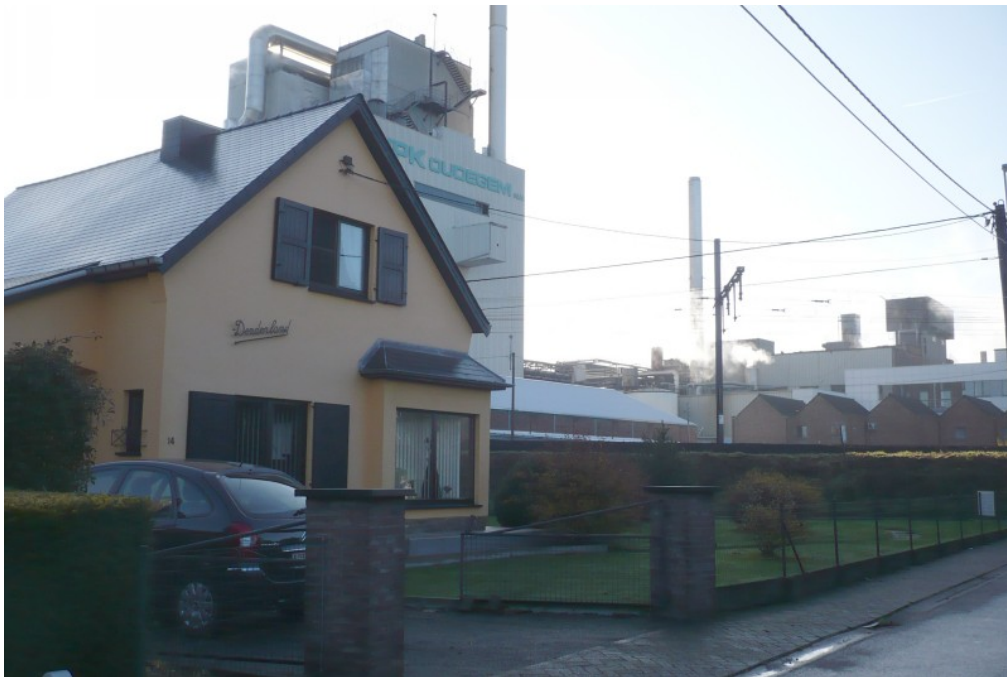
De riante residentie Denderland. Op de achtergrond de papierfabriek. Daarvoor de spoorweg. Stank, stof en stennis. Het enige wat nog ontbreekt voor een volmaakt woongeluk is een drukke autosnelweg. Vlaanderen leeft!

Kom nou Guido, hou het een beetje Gezelle(g) man! Lig daar toch niet zo te draaien in dat graf!