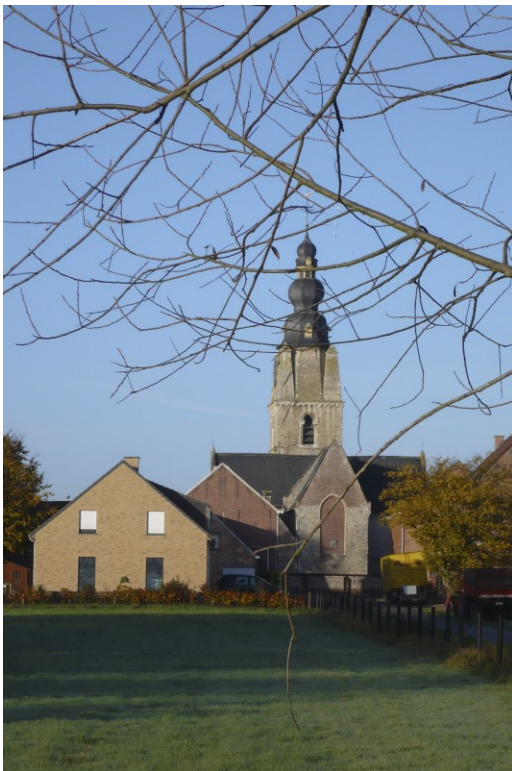
Mespelare: de Sint Aldegondiskerk

ligt dat het bijna niet anders mogelijk is dan dat hier menselijk ingrijpen in het spel is geweest. Op de kaart blijkt het tracé niet zo kaarsrecht te zijn als de aanblik ter plaatse laat vermoeden maar blijkt de rivier een lange, luie bocht te beschrijven. Tot voorbij de