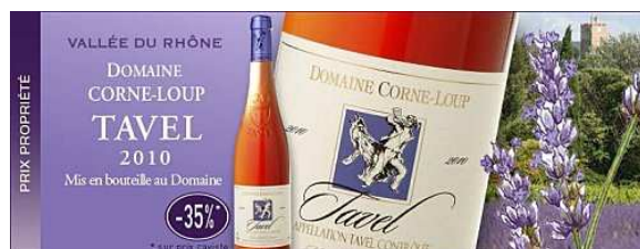
Tavel Rosé 2010 Domaine Corne-Loup.

Découvrez l'appellation Tavel réputée pour ses vins exclusivement rosés, depuis le Xème siècle et unique par sa vinification.