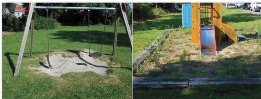
Speeltoestellen in Bassevelde & Oosteeklo

Aan prestigeprojecten spendeert het gemeentebestuur honderduizenden euro's, maar voor de veiligheid onze spelende kinderen kan er blijkbaar zelfs geen halve euro af! Voor ons hebben alle kinderen recht op veilige speeltuigen.