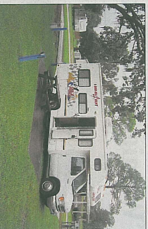
De camper die werd gebruikt tijdens de reis door Florida in 2005.

„Onze eerste vakantie in Turkije, we hadden laat geboekt en er was al niet zoveel keus meer. Dus uiteindelijk een hotel geboekt vlak bij Alanya. We kwamen in