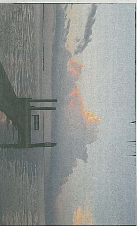
Een fraai uitzicht over het water.

„Meestal sturen we wel een kaartje vanaf onze vakantiebestemming. Misschien dit jaar wel vanuit Las Vegas, met de mededeling dat we de jackpot hebben gewonnen en dat we nog langer blijven.”