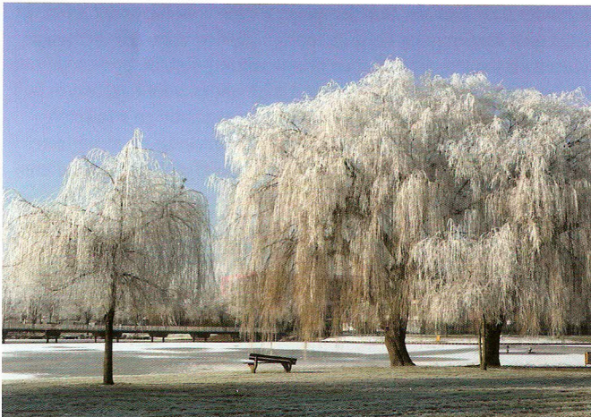
Park Baron Casier