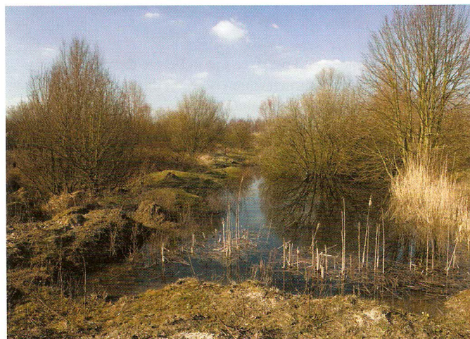
Poel in Orveytbos