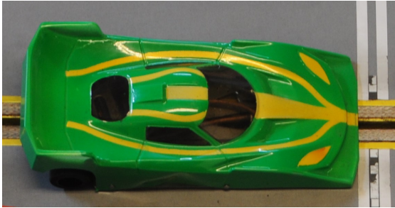
LOTUS Evora GT300