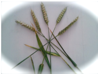
aren uit de graancorkel 10e formatie

In het midden een blauwe saffier cabochon, een brass ring, granen van de 10e graancirkel formatie, een 14 karaat vergulde ring en in de buitenrand goud vergulde kraaltjes, Lapis Lazuli en turkoois kraaltjes. In de lagen daarachter gouden metallic deeltjes, 24 karaat bladgoud, ijzeroxide poeder en zwart toermalijn zand.