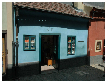
Huis Franz Kafka

De bekende schrijver Franz Kafka woonde hier een tijdje in nummer 22.