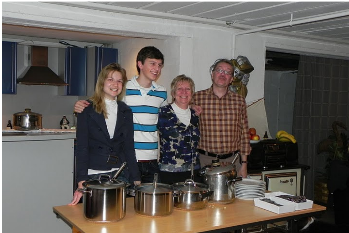
De atleten werden in de watten gelegd door het ETZ-bestuur.