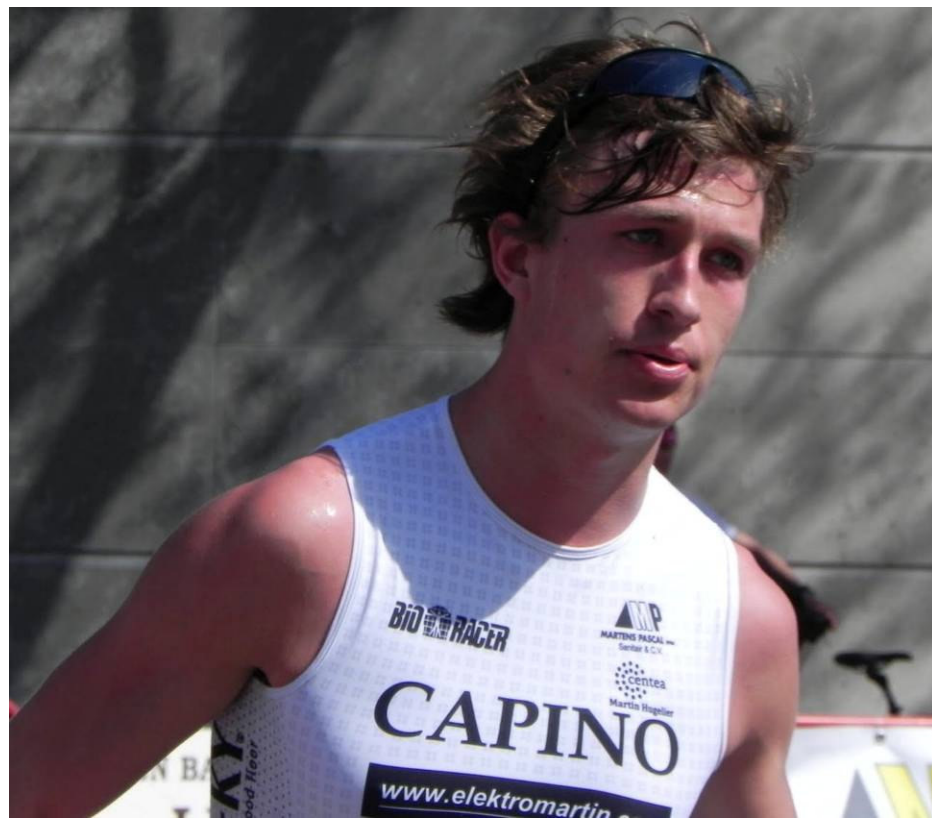
Lander Vanmarcke kende een goede seizoensstart maar deemsterde nadien wat weg door een blessure!