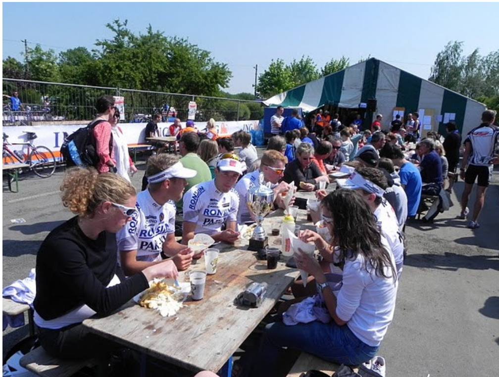
Na winst op het BK ploegenduatlon kon een frietje er wel van af!