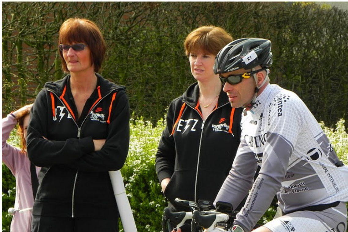
De supporters van ETZ waren dit seizoen vaak op post!