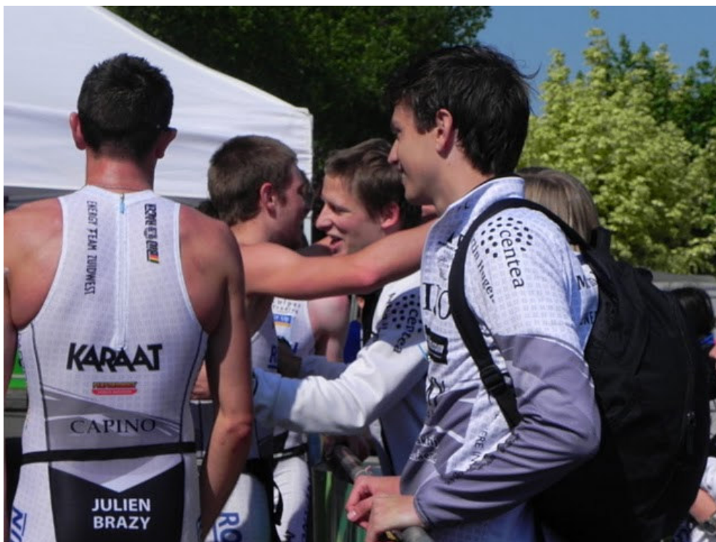
Er is ook een erg hechte band tussen het bestuur en de atleten van ETZ!