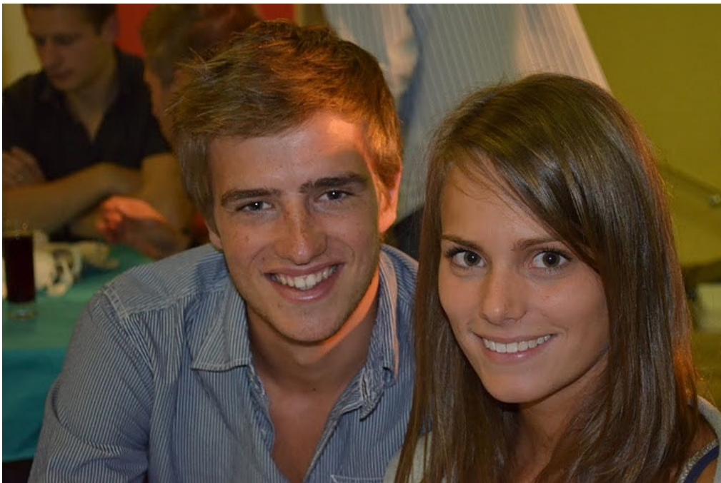
Love is in the air...