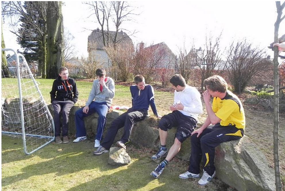
Er werd op het clubweekend ook tijd gemaakt voor een partijtje voetbal!