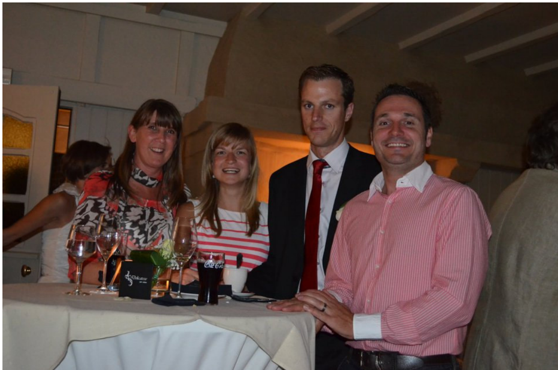
ETZ was uiteraard ook van de partij op hun erg geslaagd huwelijksfeest!