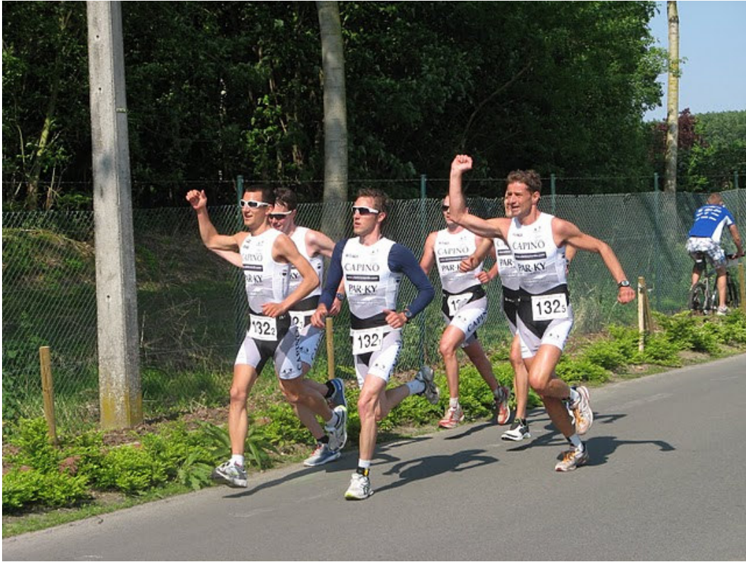
Een schitterend beeld! ETZ 2 juicht het winnende ETZ 1 toe op het BK ploegenduatlon te Doornik!