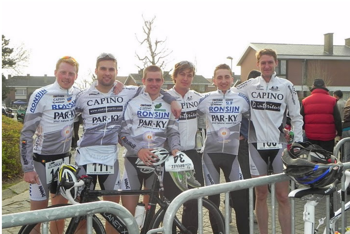
In de seizoensopener ( duatlon Geluwe ) werd meteen duidelijk dat de atleten het goed met elkaar konden vinden!