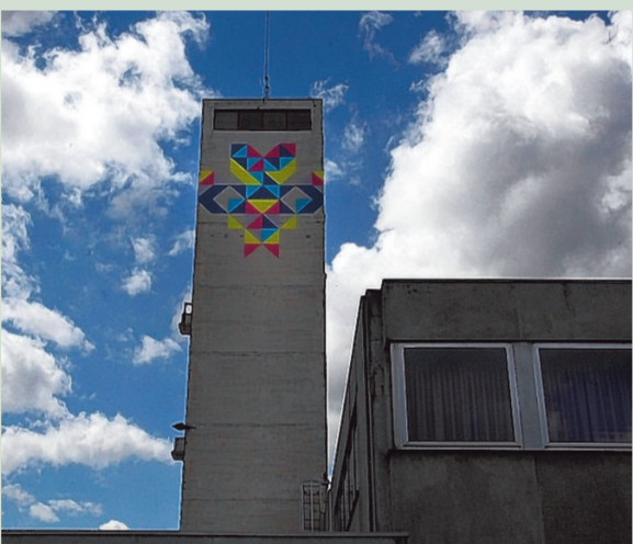
Op de brandweertoren prijkt een kleurrijke tekening.