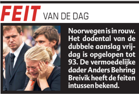
Noorwegen is in rouw. Het dodental van de dubbele aanslag vrijdag is opgelopen tot 93. De vermoedelijke dader Anders Behring Breivik heeft de feiten intussen bekend.