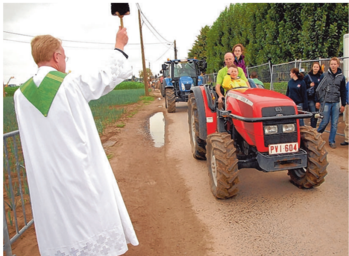
Een priester wijdt zo'n 140 tractoren.

De KLJ van Ingelmunster blaast dit jaar 85 kaarsjes uit en dat kon niet onopgemerkt voorbijgaan. Op hun jaarlijkse feestweekend werd stilgestaan bij het jubileum en waren er tal van activiteiten, zoals de jaarlijkse fuif en tractorweding. De feestelijkheden vonden traditiegetrouw plaats op de terreinen aan de Krelstraat en die werden op donderdag 21 juli reeds ingepalmd door een schare trouwe fans die er genoten van een comedy-avond. Vrijdag stond er een reuzenbarbecue op het programma, terwijl de Far(m) West Party op zaterdag de jeugd naar de Krelstraat lokte. Zondagochtend daagden een 140-tal tractoren op voor de tractorweding. «Een aantal dat we elk jaar steeds zien groeien», zegt verantwoordelijke Tim Vanneste. «Deze vierde editie wordt steeds populairder, zowel bij landbou-