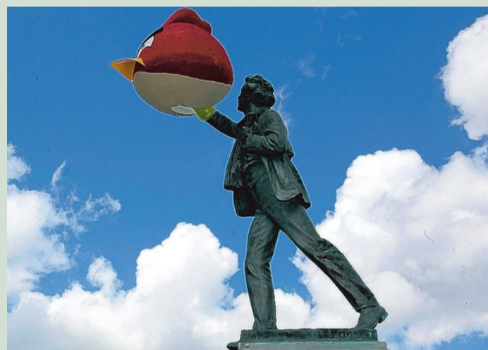
Albrecht Rodenbach met bizarre blauwvoet.