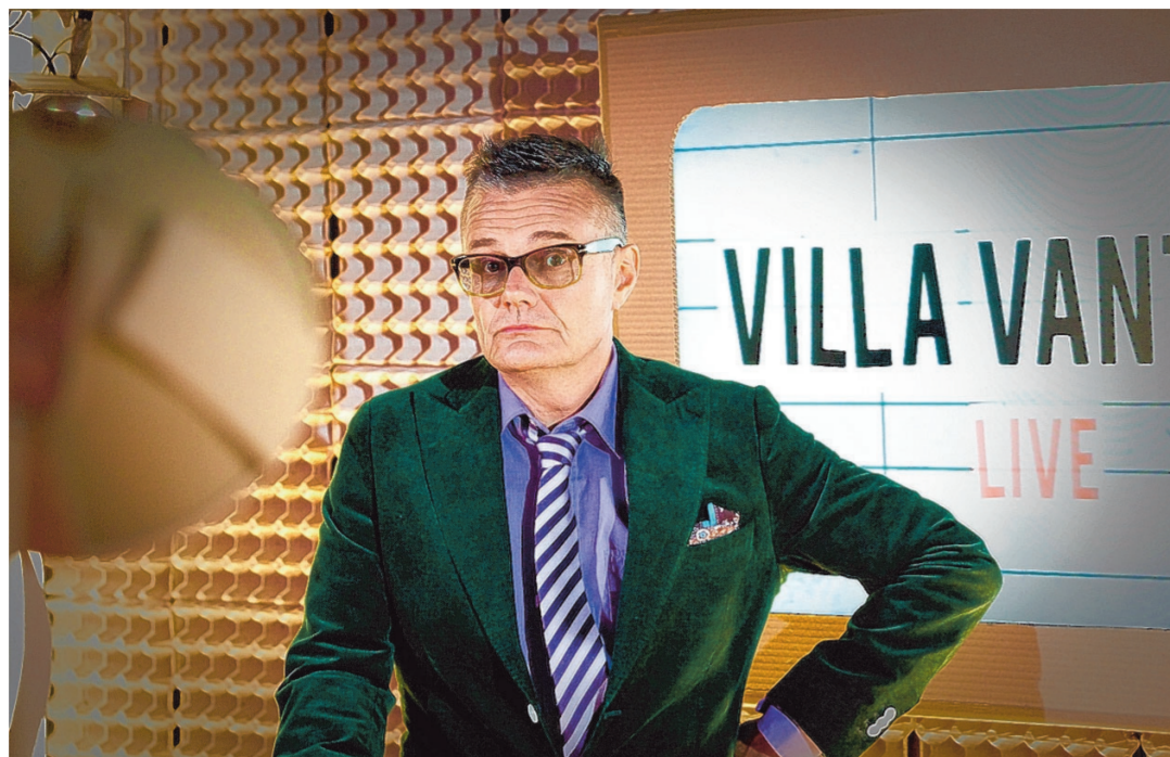
Marcel Vanthilt presenteert vanaf deze avond in zijn villa op de Grote Markt.