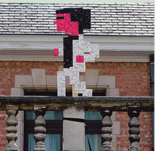
Op het infopunt is een pixelmannetje te zien.