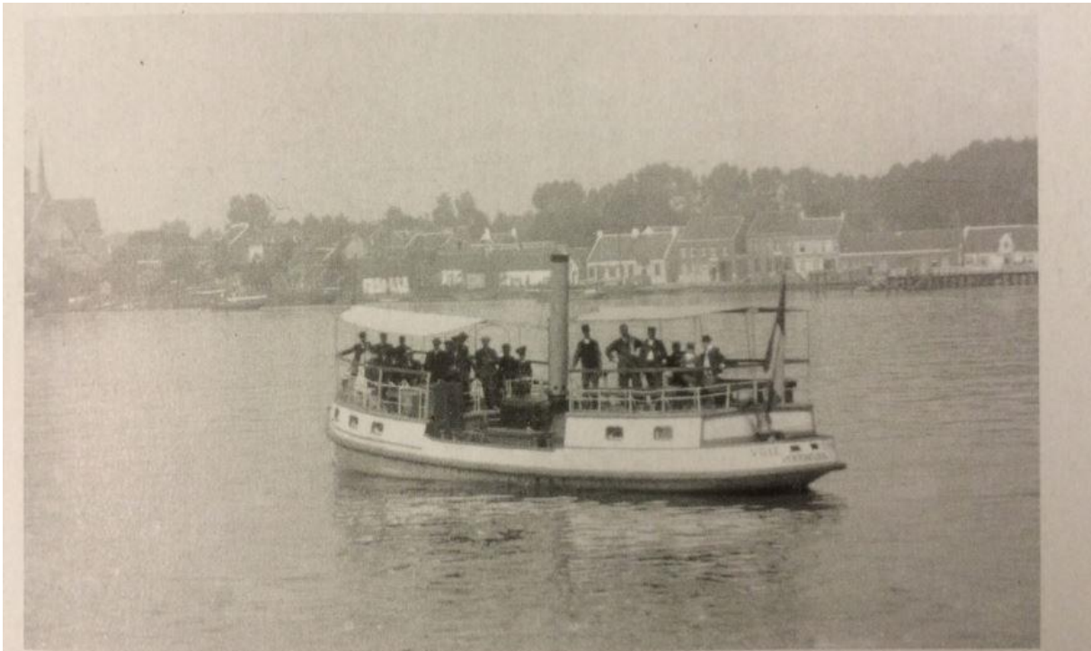
Veerdienst begin 20e eeuw