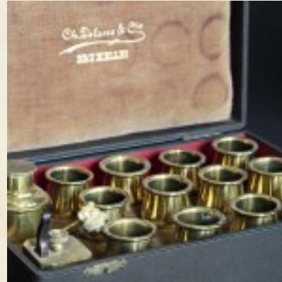
De bokalen met bloedzuigers en de laatkoppen