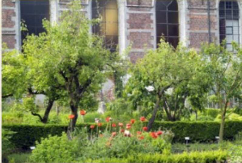
De tuinen met ijskelde