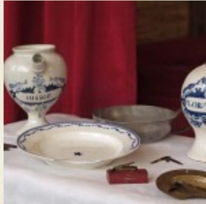
De aderlaatschotel en de laatmesjes