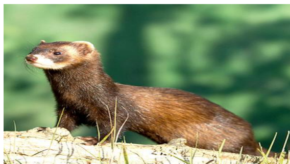
De bunzing met zijn opvallende oogmasker.

De bunzing ( Putorius putorius ) ofwel in het dialect een visch (een vissche) heeft een donkerbruine vacht met lichtere vlekken. De onderzijde van het tot 60 cm lange roofdier is roomkleurig. De kop is bruin met het gekende lichte ' masker '. Het vrouwtje is tot één derde kleiner dan het mannetje. Na een korte dracht van zes weken worden de jongen bijna spierwit geboren. Na twee maanden verlaten zij de nestplaats, meestal is dat een verlaten konijnenhol of een schuilplaats in het hooi in de schuur, en binnen hetzelfde jaar zijn ze nog geslachtsrijp.