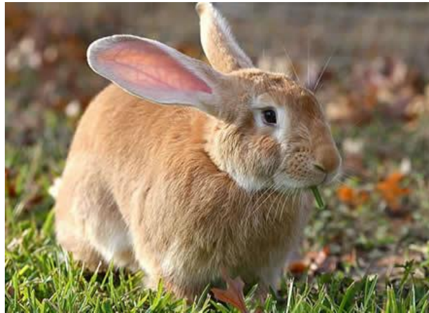
De Vlaamse Reus - een van de grootste konijnensoorten

De zachte vacht en het lieve uiterlijk maakt konijnen huisdier voor uw (klein)kinderen. Voor u beslist om een of meerdere konijnen te houden als huisdier dient u even stil te staan bij de verzorging ervan. Impulsaankopen van huisdieren zijn helaas nog steeds een van de meeste redenen waarom dierenverwaarlozing optreedt of dat huisdieren losgelaten worden in de vrije natuur (denk maar aan steeds talrijker wordende water schildpadden in openbare parken en kanalen).