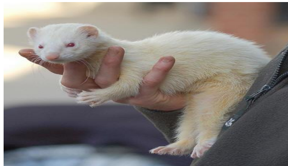
De albino fret, een huisdier dus !

De fret ( Mustela putorius furo ) is een volledig gedomesticeerde ondersoort van de bunzing dat in het wild weinig tot geen slaagkansen heeft om te overleven. Fretten worden gehouden als gezelschapsdier of ingezet voor de jacht . Deze huisdieren komen voor in kleuren van chocoladebruin tot zwart en van spierwit tot licht bruine.