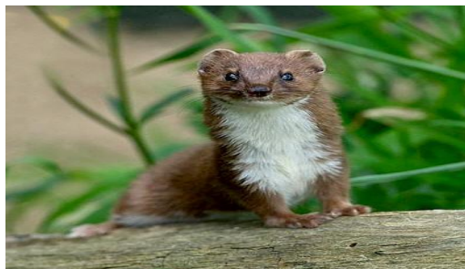
De kleine en sluwe wezel.

De wezel ( Mustela nivalis ) is meteen onze kleinste marterachtige. Van neus tot staartpunt worden de mannetjes slechts 27 cm en ze wegen ca 60 gram (minder dan een kippenei). De wezel heeft een roestbruine vacht met witte buik en borst . De wezel maakt een blaffend geluid , dit in combinatie met zijn favoriete prooi geeft hem de bijnaam ' Muishond '.