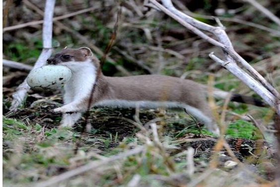
Hermelijntjes zijn verzot op eieren.

worden 3 tot 8 jongen geboren die nog in hetzelfde jaar geslachtsrijp zijn. Als nest wordt vaak een oud rattenhol, een mollenhol of een stapel hout gebruikt.