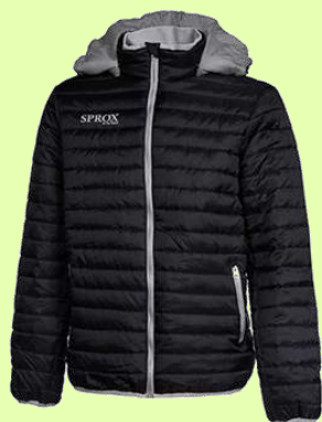
Patrick padded jacket zwart/grijs Ideaal in wintermaanden

28/04/2018 - 29/04/2018 Eindeseizoensfeest jeugd 17:00 - 03:00 De Mast, Torhout