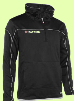
Hooded sweater half zip