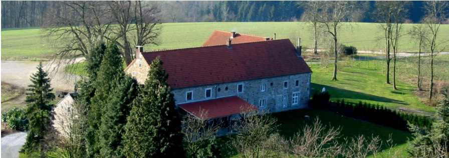
Foto: onze prachtige gite in Maredsous.

Reeds aangekondigd in ons vorige nummer: op 11 tot 14 november ek. trekt HVV naar Maredsous voor opnieuw een super gezellig weekend. Inmiddels lopen de inschrijvingen goed binnen. Zo goed zelfs dat wij een optie hebben genomen op een tweede gite in de buurt.