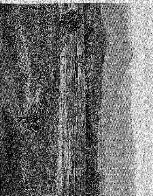
De Australische Crocodile Trophy is alom bekend als de zwaarste mountainbikewedstrijd ter wereld. In een prachtig decor.