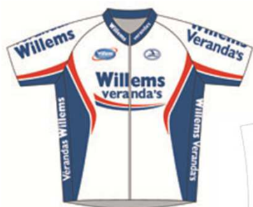
Wielershirt korte mouwen Korte broek met bretellen