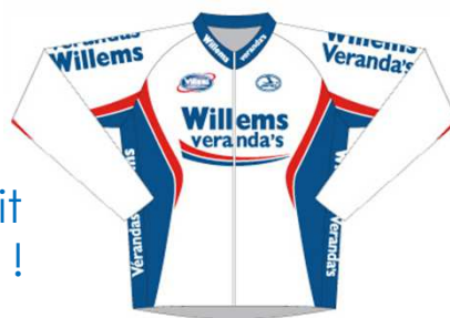
Wielershirt lange mouwen Lange broek met bretellen

Professionele kwaliteit aan sportieve prijzen !