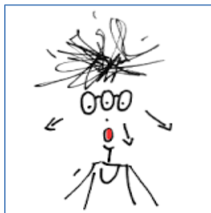
Kijk met drie ogen

“ Kortom” als je vogels koopt, kweekt, bij een goede en regelmatige controle kan men veel problemen voorkomen. Men ziet het tijdig, men kan tijdig handelen zodat men teleurstellingen zeker voorkomt.