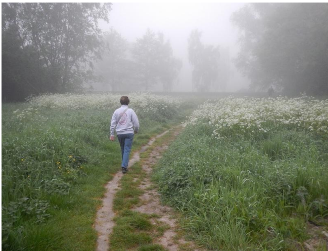
Op naar de Sint-Onolfsdijk

Wie Sint-Onolf mag geweest zijn heb ik niet kunnen achterhalen. Wel bestaat er een