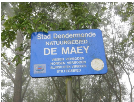
Het natuurgebied De Maaie. Of De Maey. Het is zelfs een stiltegebied. Wat ook klopte met de werkelijkheid.

Die liep (en loopt gedeeltelijk nog) door het stadscentrum en stonk. Verschrikkelijk. En hij durfde wel eens overstromen. Daarom werd er een kanaal gegraven dat ervoor zorgde dat de Dender en de sporadische scheepvaart daarop, buiten de stad bleven. Een gevolg was wel dat daardoor de Sint-Onolfspolder werd gedeeld.