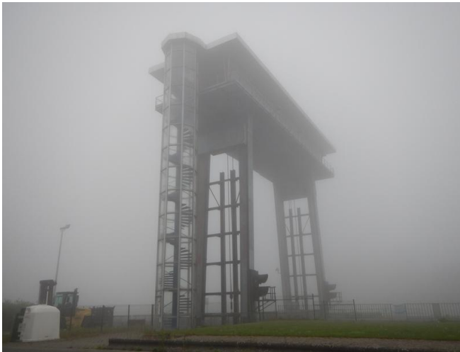
De tijsluis op de Nieuwe Dender. In de mist...

De eerste keren dat ik de wegwijzer naar de sluis op de Nieuwe Dender zag, las ik stee-