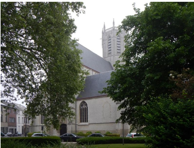
De Onze-Lieve-Vrouwekerk met de merkwaardige toren.

De wandeling eindigde waar ze begonnen was: in de gebouwen van het Heilige Maagdcollège. In de schaduw van de merkwaardig gevormde Onze-Lieve-Vrouwekerk. Aan de buitenkant valt die op door een massieve