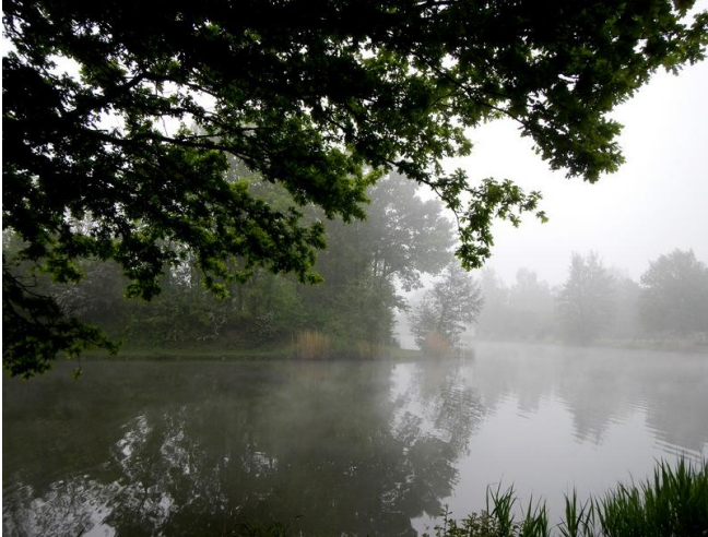
De grote vijver van de Brusselse Forten

Wanneer je „Brusselse Forten“ geschreven ziet staan, dan denk je toch aan strenge, grim-mige fortificaties? Niets daarvan in Dendermonde. Brusselse Forten begrijpt men daar als... een grote vijver! In oorsprong waren de Brusselse Forten inderdaad wel een deel van de stadswallen aan de rand van de stadskern. Veel meer dan het water zelf is er niet van overgebleven. Zo is het nu een vijver van ongeveer 5 hectare groot, met een lengte van 2 kilometer.