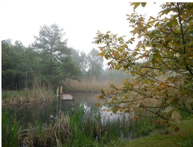
Het zeer diverse landschap in het natuur-educatief reservaat Bastion VIII

Nog steeds kan ik er me over verwonderen hoe groen het tot in de kern van Dendermonde eigenlijk wel is. En dan niet alleen doordat er enkele parken zouden aanwezig zijn. Dat wordt wel in elke stad vertoond. Nee, er liggen daar heuse natuurgebieden op een bewonderend bezoek te wachten. De stad is sinds lang aan het keurslijf van de eerdere vestingen ontgroeid en uitgebreid om naadloos