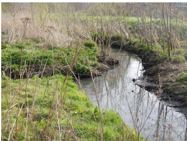
De sterk kronkelende en vuile Neerpedebeek

Het blijkt uit de reproducties duidelijk dat Bruegel vooral inspiratie vond in de Pedevallei. Daardoor werd het kerkje van Sint-Anna-Pede wereldberoemd. Het staat afgebeeld op het schilderij de Parabel der blinden . De meer dan bekende Boerenbruiloft zou hebben plaatsgevonden in de schuur van de Herberg De Kroon aan de Kroonweg. Uitgaande van die niet bewezen overlevering werd op die plaats een nieuwe schuur gebouwd. Verder zijn op de schilderijen de Hooioogst en de Korenoogst de kerken van Itterbeek en Dilbeek te zien.