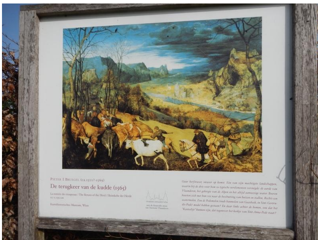
Een paneel van het openluchtmuseum met een reproductie van een schilderij van Pieter Bruegel de Oude.

Het is niet verwonderlijk dat in een gemeente waar Bruegel zo in het hart gedragen wordt, er een Bruegelwandelpad en een Bruegelfietsroute zijn uitgezet. Op zich is dat nog niet eens zo speciaal maar men heeft zich wel nog iets bijzonders laten invallen: een openluchtmuseum. 19 reproducties van Bruegels schilderijen waarin het Pajottenland min of meer goed te herkennen is, zijn opgesteld langs die trajecten. Hoewel de reproducties weerbestendig en kleurrijk heten te zijn, vond ik toch dat de kleuren al wat geleden hadden. De grote panelen zijn wel op eender welk ogenblik te bekijken. Iets wat je van een echt museum niet kan verwachten.