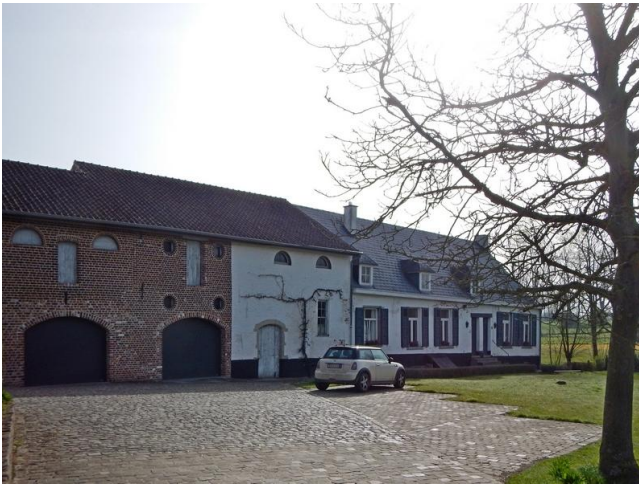
De verdwenen watermolen van Sint-Anna-Pede