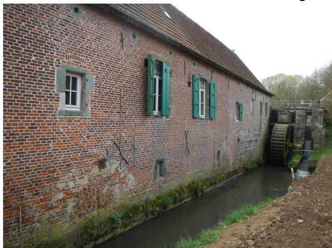
De Pedemolen in Sint-Gertrudis-Pede

De Pedebeek en het voorhanden reliëf maken het ook vanzelfsprekend dat er daar watermolens zouden gebouwd worden. Wat ook gebeurde. Ons is slechts één daarvan overgebleven: de Pedemolen. Die molen kan tegenwoordig weer gebruikt worden om er inder-