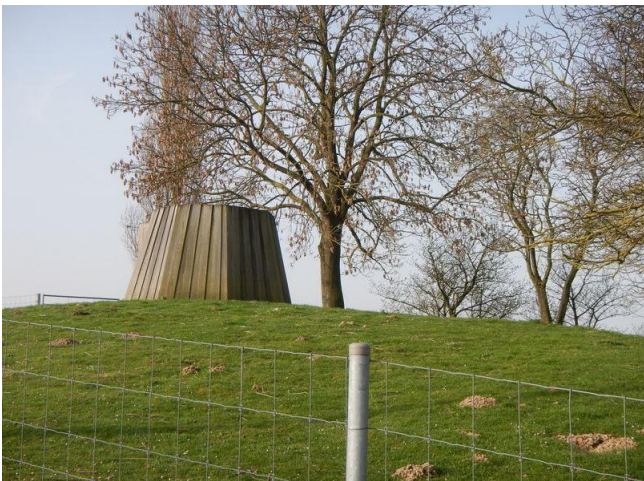
Om aan te geven dat hier, boven op de Tomberg, ooit een molen stond

Een andere molen, die ik ook al eerder was voorbijgestapt, stond op wat het hoogste punt van de tocht bleek, 91 meter boven zeeniveau. Nu is er nog slechts een wat eigenaardige