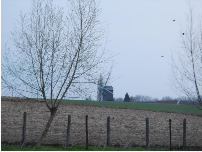
De Hertboommolen vanuit de verte