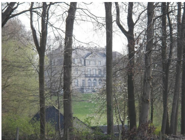
Het kasteel Fontval. Nu Levenslust.

Tegenover het horecabedrijf waar we voor een rust en wat lafenis tot driemaal toe moesten aanleggen, bevond zich alweer een oude bekende. Nog net op het grondgebied van Schepdaal ligt daar een domein van 17 hectare groot. Met, onder andere, een kasteel erop. Dat is het kasteeldomein Fontval. Het is nu eigendom van een zorginstelling die zich