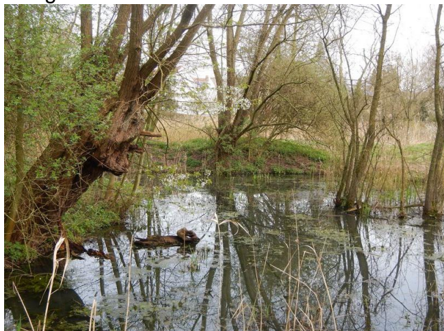
Een spaarvijver bij de Pedemolen

Het geheel van de molensite is veel meer dan enkel de watermolen zelf. Er is ook nog een