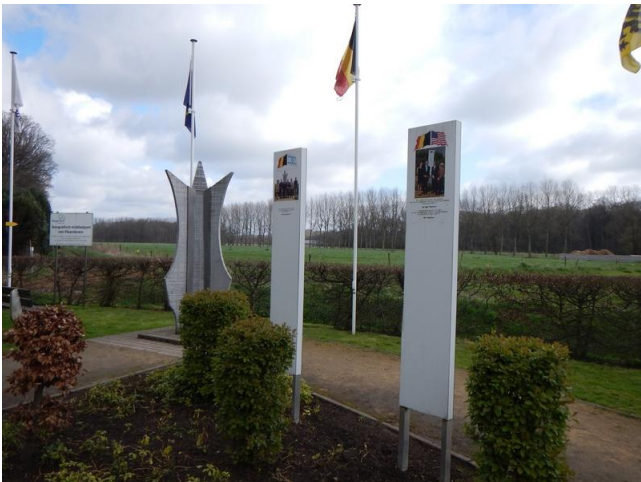
Het middelpunt van Vlaanderen in Opdorp. Het kunstwerk dat het geografische punt symboliseert, is het werk van Roger Van den Eede.

Nu doet een beetje professor dat meten en rekenen natuurlijk niet zelf. Zo werden daarmee vier studenten burgerlijk ingenieur belast terwijl ze door een assistent op de vingers