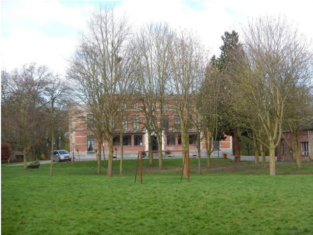
Het PMI De Capelderij. Alias: psychiatrische inrichting in Rooiendijk.

boekje is de bouwstijl „eclectisch“. Een mix van ik-weet-niet-wat, met andere woorden. De oorspronkelijke paardenstallen zien er verwaarloosd uit. Nu heet het daar MPI (Medisch Pedagogisch Instituut) Capelderij. Het kreeg recent enige bekendheid omdat het te zien was in de Vlaamse televisieserie „Stille Waters“ uit 2001. In deze serie is het kasteel een psychiatrische inrichting in het fictieve „Rooiendijk“. De tuinen, de inkomhal en de traphal kwamen dan in beeld.