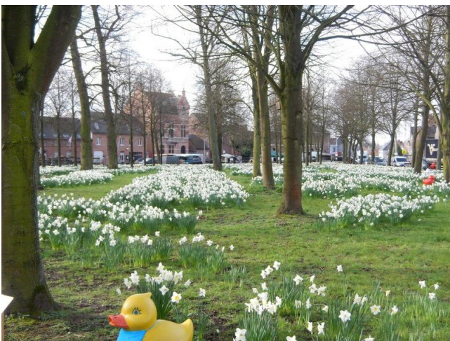
Een stukje van de Dries in Opdorp. Met de ontelbaar vele narcissen. En één van de vele eendjes.

kans is zeer groot dat je „Sint-Niklaas“ als antwoord krijgt. Vraag het mijn eerbiedwaardige encyclopedie uit 1953 die zichzelf „Prins“ noemt, vraag het de flitsende Wikipedia van vandaag en je krijgt hetzelfde antwoord. Vraag het mij en ik zal zeggen dat ze het verkeerd voorhebben! Het grootste marktplein van ons landje is niet de Grote Markt in de Sint-Niklaas maar wel de Dries in Opdorp. De eerste markt moet het doen met een oppervlakte van 3,2 hectare, het plein in het verder bescheiden Opdorp zou 3,7 hectare groot moeten zijn. Hoewel... 3,7 hectare is toch 37 000 m 2 ? Op een andere plaats vond ik dan weer 5 000 vierkante meter... Hoe dan ook: groot is de Dries daar in Opdorp alleszins. En dat is nog niet alles wat het plein te bieden heeft. In deze tijd van het jaar staat het daar vol bloemen. Narcissen. Allemaal witte en volgens de toeristische folders 500 000 in getal! Biedt iemand meer? Ik heb ze niet geteld, dat niet, maar bijzonder is het wel. Bovendien staan er tussen de bloemen kunstwerken. Sommige daarvan permanent, andere zijn van tijdelijke aard en ieder jaar wordt er voor deze laatste een thema gekozen. Het zijn ooit al kikkers en konijnen geweest en dit jaar zijn het eendjes die overal tussen gebloemde staan te kijken. De meest diverse soorten, kleuren en formaten. Eenden die zelfs de Schepper niet wist te bedenken.