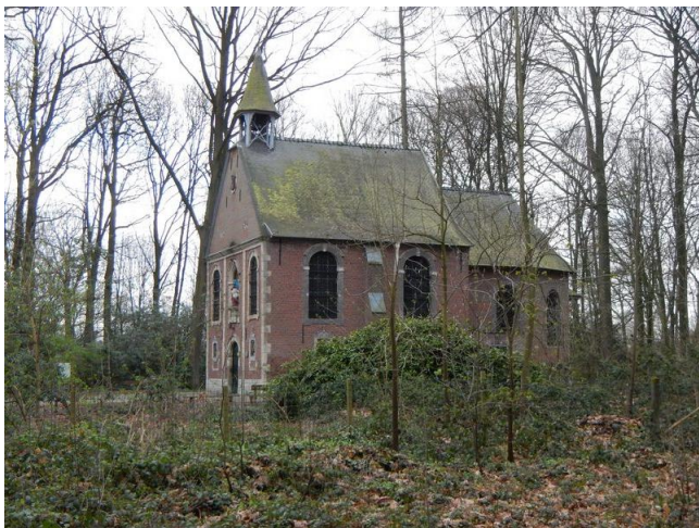
De Boskapel in het Buggenhoutbos