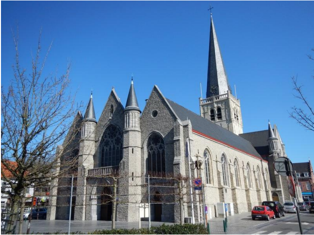
De kerk en de markt in Waregem

vermeld in 826. Deze naam en de nederzetting waarnaar die verwijst moeten echter al veel ouder zijn want het is duidelijk dat er een Frankische root in schuilt. In de Gallo-Romeinse periode (ten tijde van Asterix) moeten in Waregem verschillende nederzettingen aanwezig geweest zijn. Er zijn daar namelijk meerdere archeologische vondsten gedaan: pijlpunten, scherven van vaatwerk en munten. Ik zag onderweg trouwens een jongmens die, gewapend met een metaaldetector en een spade, de boorden van een akker aan het afstruinen was. Misschien in de hoop nog een Romeinse muntschat te vinden. Ik heb het hem niet