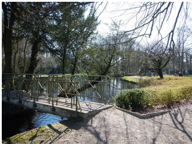
Een vijver in het stadspark

Het kasteeldomein van Baron Casier is niet het enige park binnen de stadsgrenzen van Waregem. Er is ook het Regenboogpark dat niet minder dan 40 hectare groot is. Ooit was dit stuk grond een moeras waar niets mee aan te vangen was. Dat kwam doordat de Gaverbeek ieder jaar overliep en de grond waterziek achterliet. Het heeft heel wat bodemsaneringen, ophogingen en draineringen gekost om er het huidige parkgebied van te maken.