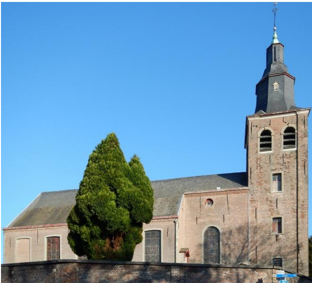
De Sint-Machutuskerk in Wannegem-Lede