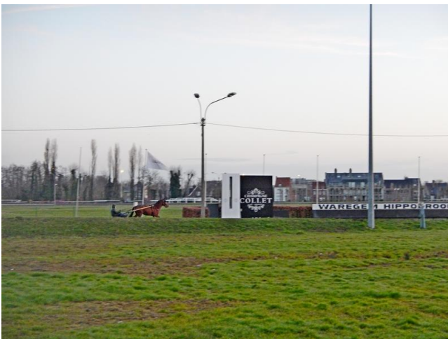
Nog niet eens zeven uur in de morgen en iemand is hier al een paard aan het trainen!