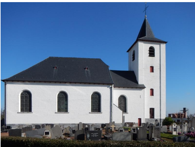
Het opvallend witte kerkje in Moregem

Op de grens met Oudenaarde bevinden zich de restanten van een openlucht vier-schaar. Dat is iets bijzonder in de Belgische rechtsarcheologie. Nergens in ons landje vind je dergelijk overblijfsel van de vroegere rechtspleging nog in deze vorm. Er staat een pilaster met verweerde versierselen en het wapenschild met leeuwenkoppen van