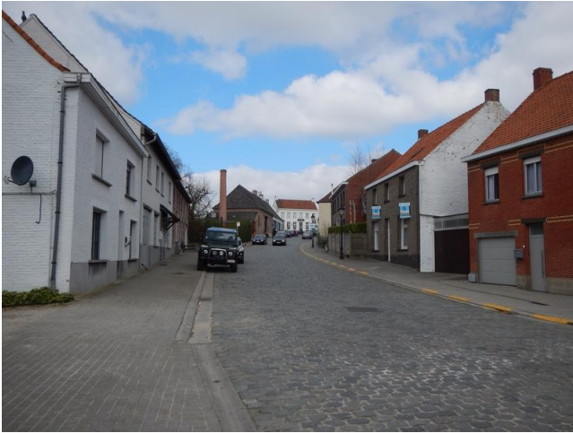
Nokereberg. Niet direct indrukwekkend.

kasteel dat die naam draagt. In het kasteel van Nokere staat ook een verzameling koetsen uit de 18 e en de 19 e eeuw. Op de eerste zondag van juli kan die verzameling bezichtigd worden ter gelegenheid van de Nokerse Zomerfeesten.