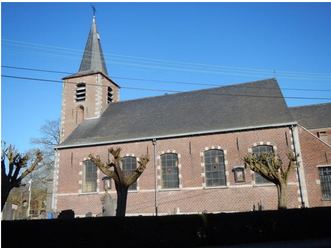
De kerk in Ooike

hier altijd al de belangrijkste bezigheid geweest. Naast de productie in huisnijverheid van lijnwaad.