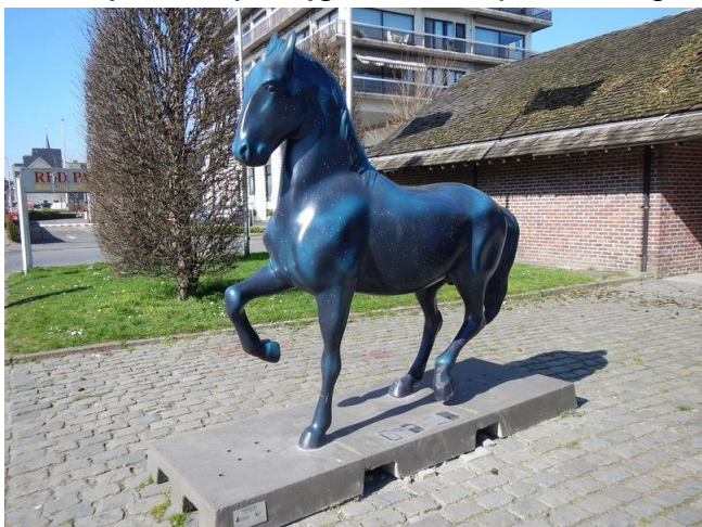
Het paard vóór de hippodroom in Waregem. Indien het niet van plastic is, lijkt het er toch verdacht veel op.

klinkt zijn larmoyante „zulke paardjes wil ik niet“. Totdat zijn moeder, der dagen oud geworden, het aardse bestaan eraan moet geven en er voor de deur een koets verschijnt bespannen met vier paarden. Maar ook die paarden wil de, intussen, jonge man niet. Nooit tevreden, blijkbaar.