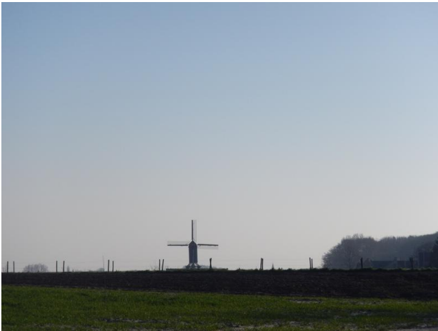
De Schietsjampetter- of Houtavemolen vanuit de verte.

molen op de dieplader werd gehesen (je kan zo'n ding nu eenmaal niet eventjes op een imperiaal vervoeren) verscheen daar onze koddebeier die de werklieden sommeerde om terstond de werkzaamheden te staken en de molen terug te plaatsen. De nieuwe eigenaar, met de nodige papieren in de hand, betwiste dat met klem. Waarop de veldwachter, zonder argumenten gevallen maar trouw aan zijn broodheren, het dienstwapen trok en een paar kogels in de molenkast joeg! Consternatie alom en het transport werd afgelast. Waarop een jarenlang juridische klucht werd opgevoerd die er uiteindelijk in resulteerde dat de molen toch van de ene naar de andere Machutusgemeente verhuisde. Eind goed, al goed? Nee hoor. De molen was vanouds uitgerust met houten pestelroeden. „Roeden“ dat zijn de lange balken die de wieken uitmaken. En pestelroeden zijn helemaal uit hout en uit meerdere delen opgebouwd. Een eeuwenoud systeem dat echter niet van belangrijke nadelen gespaard blijft. Zo gingen bij deze molen de roeden meermaals kapot. Bij de laatste restauratie werd dan gekozen voor een controversiële maar zeer moderne oplossing. Wel nog houten roeden maar toch een nieuw prototype. Het is gemaakt in tropisch hardhout (bilinga), versterkt met inox staven en epoxyhars. Zeer duurzaam maar ook zeer zwaar! Hetgeen niet iedereen ge-