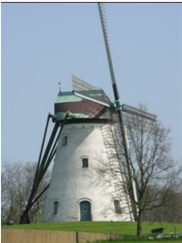
De Bergmolen boven op Tiegemberg