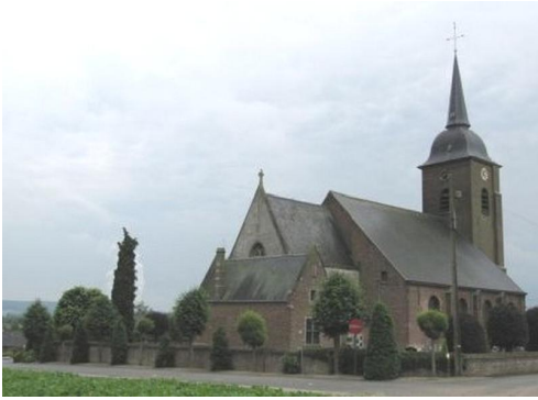
De Petruskerk in Kaster

af van de abdij van Corbies. Een abdij die trouwens een belangrijke rol heeft gespeeld in de geschiedenis van het dorp. Eerder dan deze kerk stond er een andere maar die is in 1818 afgebroken. Het was een primitief gevalletje met maar één beuk in het middenschip met een achtkante middentoren. Dat vonden ze blijkbaar toch nogal minnetjes en dus werd er later een zuidelijke beuk bijgebouwd. Zo rond 1800 was de kerk zeer bouwvallig geworden, en in 1815 moest zij aan de binnenkant met boomstammen worden ondersteund. In plaats van ze te laten instorten werd ze dan maar afgebroken en werd er al in 1818 begonnen met