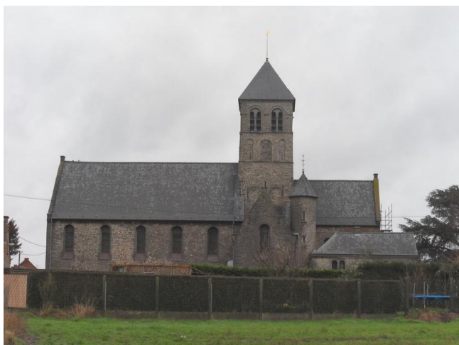
De kerk in Waarmaarde

Wat in het voorbijgaan het meeste opvalt aan Waarmaarde is de kerk. Groot en in onvertelbaar grijs natuursteen. Te zien aan de vrij lage, vierkante toren moet de kerk ook oud zijn. Hetgeen blijkt te kloppen.