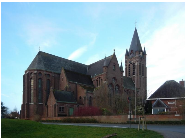
De mastodont van Avelgem