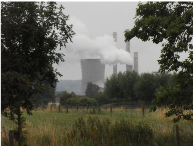
De thermische centrale van Ruien in betere tijden. Toen ze nog (een beetje) werkte.

Waarmaarde ligt vlakbij Ruien en daar staat, je kan er onmogelijk naast kijken, hetgeen ooit de grootste niet-nucleaire elektriciteitscentrale van België was. Was, inderdaad, want er stijgt geen dikke damppluim meer op uit de koeltoren. Wat er al een hele tijd zat aan te komen schijnt nu een feit te zijn: de centrale ligt stil.