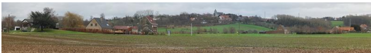
Een Avelgems panorama. Ongeveer in het midden van het beeld is het kerkje van Kwaremont te zien.

Ze worden „Ruggenaars“ genoemd, daar in Avelgem. Tenzij het iets te maken heeft met een gehucht van dat dorp dat, inderdaad, Rugge heet, weet ik niet waar die spotnaam vandaan kan komen. Nog minder wat die te betekenen heeft.