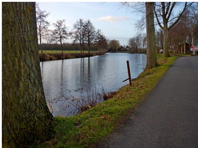
Een afgesneden meander van de Schelde

Een stukje van de tocht over het grondgebied van Avelgem liep over een hoofdzakelijk strak, recht pad. Het liet zich raden dat dit ooit de bedding was van een spoorweg of een tramlijn. Inderdaad: voor fietsers begint in Avelgem wat de Trimaarzate heet. Die Trimaars