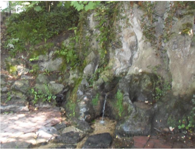
De miraculeuze bron in het park op de Tiegemberg

worden dat het wonder inderdaad geschiedde?