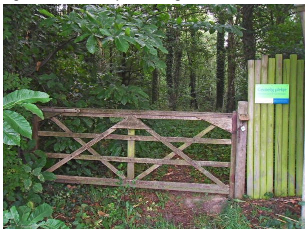
De toegang tot Bassegembos. Enkel toegankelijk met een gids.

Je kan niet zeggen dat het hier in de omgeving van Tiegem stikt van de bossen. In tegendeel. Ja, de Tiegemberg is uitbundig begroeid met allerlei houtachtig gewas van diverse aard en soort maar verder... Tussen Kaster en Tiegem, althans langs de weg die voor de wandeling was uitgestippeld, ligt evenwel het Bassegembos. Helemaal geïsoleerd, wild ogend en niet bijzonder groot. Het bos is ook niet vrij toegankelijk en daar zijn goede redenen voor.