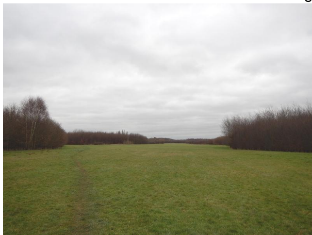
Niet moeilijk je voor te stellen dat dit ooit een (deel van) een vliegveld is geweest.

In het licht van de steeds toenemende oorlogsdreiging uit het oosten, legden in 1939 Belgi-