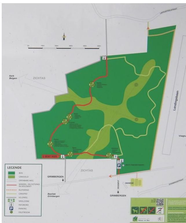
Een kaartje van het oude vliegveld in Grimbergen. Nu grotendeels het Lintbos.

Er moet verder op het vliegveld ook nog een kalibreeschijf voor vliegtuigkompassen uit de Tweede Wereldoorlog te vinden zijn. Helemaal ongeschonden bewaard en ook al uniek in Europa.