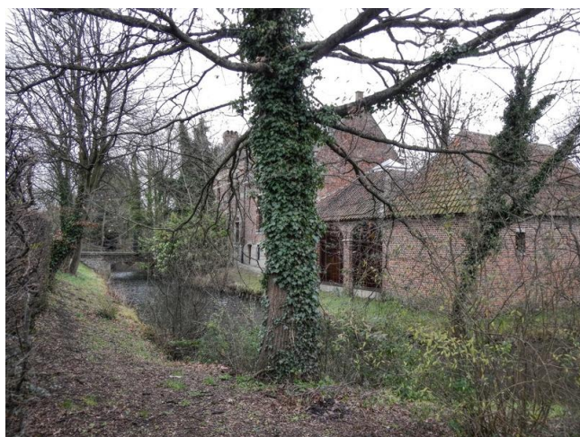
De omwalde Oude Pastorie in Nieuwenrode

Dat de „Oude Pastorie“ in Nieuwenrode een flink gebouw is, verwonderde me niet zozeer.