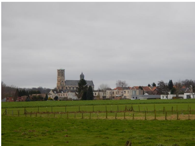
De Sint-Servaesbasiliek in Grimbergen uit de verte

De parochie Beigem was ooit het persoonlijk bezit van de bisschoppen van Kamerijk. Het dorp heeft zijn deel gehad van verwoesting en brandstichting. Zowel in een ver verleden als in een meer recent tijdsgewricht. In 1592 werd Beigem al eens grotendeels verwoest. Beigem is nog landelijk maar dat verandert snel want ook hier wordt er druk verkaveld en neemt het residentieel karakter toe.