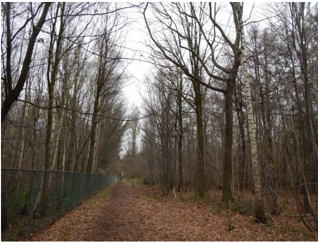
De dreef doorheen het Velaartbos naast de ijsfabriek