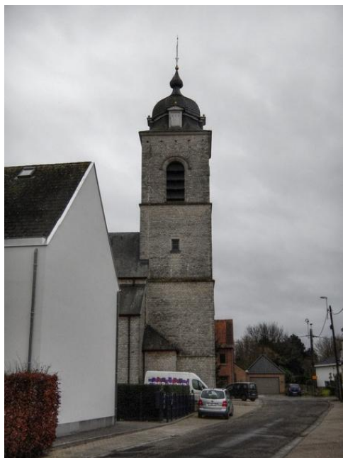
Beigem. De kerk met de rare muts

De kerk werd tijdens de Eerste Wereldoorlog, al in 1914, door de Duitsers in brand gestoken. Wat er nu staat werd in natuursteen in 1924-1925 heropgebouwd. Na de brand bleef