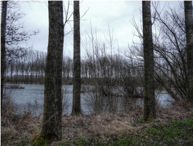
Een put zoals die is achtergebleven nadat de klei was ontgonnen.

Er liggen langs de rivier meerdere uitgestrekte putten. Daarvoor is met name de ondergrond van de Scheldevallei verantwoordelijk. Het is wat de klei-ontginningen van de steenbakkerijen hebben achtergelaten. Die nijverheid is hier al geruime tijd ter ziele. Onrechtstreeks kreeg ik daar ook mee te maken. Zowat veertig jaar geleden, toen ons voornemen om zelf een huis te bouwen door de architect zover concreet was gemaakt dat het op pa-