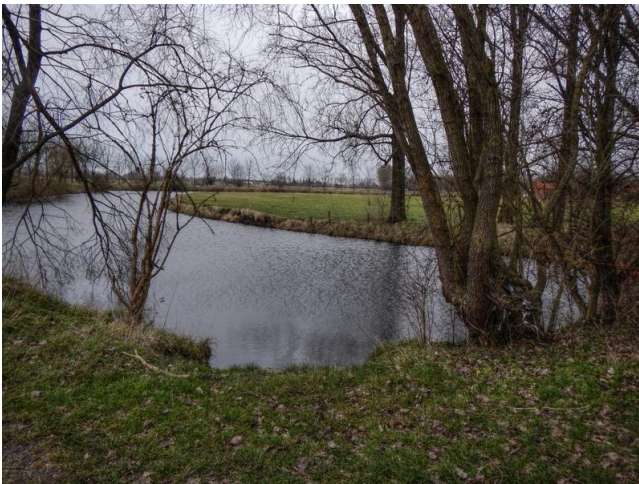
Een meander die van de Schelde werd afgesneden

de Boven-Schelde. Het beheer verloopt in samenwerking en in overleg met de plaatselijke landbouwers die de meersen maaien en ze laten begrazen. Daardoor verschraalt de bodem zodat er binnen afzienbare tijd een veel groter aantal plantensoorten zal voorkomen. Ook worden er houtkanten aangeplant. Waarmee de vogels dan weer gelukkig zijn. Een wat merkwaardige vogel die hier voorkomt is de gekraagde roodstaart. Die nestelt hier, aan deze kant van de Schelde en vertikt het aan de overkant te gaan wonen!