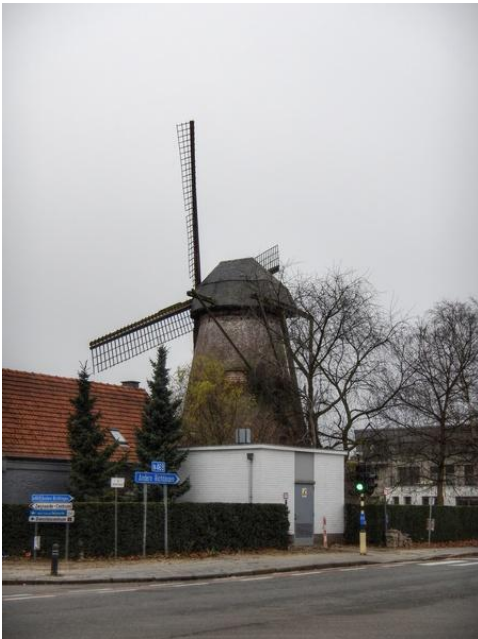
De Molen Sonnevile in Zwijnaarde

Eigenlijk staat hij daar wat verloren in die totaal verstedelijkte omgeving: de windmolen. Meer dan een ornament is het ook nog nauwelijks want sinds lang werkt dit relict uit andere tijden niet meer.