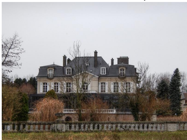
Het kasteel van Zwijnaarde zoals het er nu uitziet.

Zwijnaarde was van 1344 tot 1696 eigendom van de abten van de Sint-Pietersabdij in Gent. In alle bescheidenheid noemden ze zich de heren van Zwijnaarde. Wie het lang heeft, laat het lang hangen en dus lieten ze daar een buitenverblijf bouwen. Het staat er nu nog en het is bekend als het „Kasteel van Zwijnaarde“. Al is het lang niet meer het kasteel waarin de abten verbleven. Het blijkt een ware feniks te zijn die ondanks herhaalde ver-