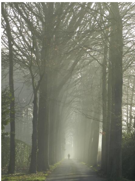
Dikwijls streng rechte dreven.

De plaatsnaam „Tillegem“ wordt voor het eerst vermeld rond 1140 in een cijnsrol die geen datum draagt. De betekenis van de naam is niet moeilijk te achterhalen: het is het heem bij de „tille“ of de plaats bij de brug. Tillegem was dus oorspronkelijk een versterkte plaats bij een brug over de Kerkebeek.