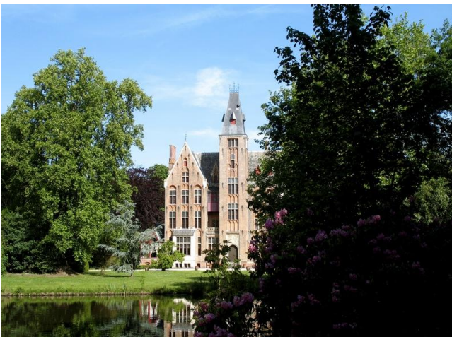
Het kasteel van Loppem.

Loppem heeft een kasteel. Dat is nu eens niet een wat te groot gegroeid huis maar een heus, echt kasteel. Bepaald geen kleintje. Toen ik er langs kwam was het nog donker en dus kan ik geen eigen foto ervan voorleggen. Het armzalige flitsje van mijn