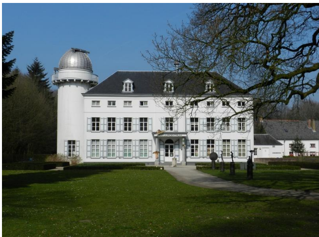
Het kasteel van Beisbroek. Nu een natuur-educatief centrum.

De stichting van het domein hebben we te danken aan Boudewijn met het Hapken, eerste graaf van Vlaanderen. Al is het verband met de abdij van Sint-Andries dan niet ver te zoeken. De graaf schonk namelijk in het begin van de 12 e eeuw het „Bencebruch“ aan de pas opgerichte abdij van Sint-Andries. Het gebied omvatte 115 hectare vochtige gronden en moerassen.