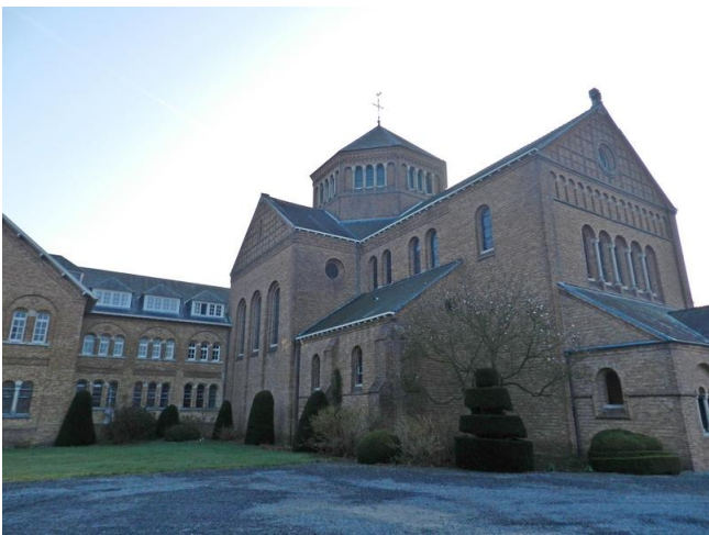
Enkele van de gebouwen van Onze-Lieve-Vrouw van Bethanië in Loppem.

De geschiedenis van de priorij van Onze-Lieve-Vrouw van Bethanië is zeer nauw verbonden met die van de Sint-Andriesabdij van Zevenkerken. Een plaats waar we straks