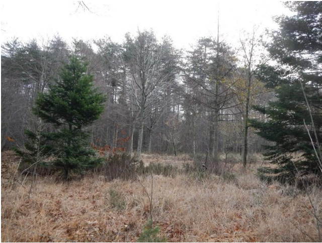
Vrij ongerepte natuur in het domein van de abdij van Zevenkerken.

met de abdij onderhouden wordt door Natuurpunt Brugge. Het is een mooie uitbreiding van het heide-lappendeken in Sint-Andries en Sint-Michiels.