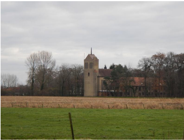
De kerktoren bij Ter Loo