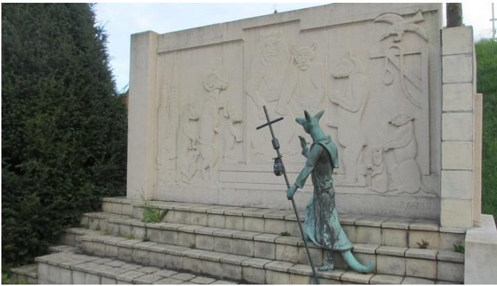
Reintje als boeteling en bedevaarder. Bij de Gentpoort

deemoedig zijn zonden gaat opbiechten voor het hof van koning Nobel en hij voorgeeft ter bedevaart te willen gaan om voor zijn wandaden te boeten. Wat wel het minste van zijn bedoelingen was. Verder vond ik op mijn tocht ergens tussen de struiken bij het Fort Bedmar een bord met het relaas waar Reynaert met Beleyne de Ram en Cuwaert de Haas op stap gaat om de vermeende schat bij Kriekeputte te gaan ophalen.