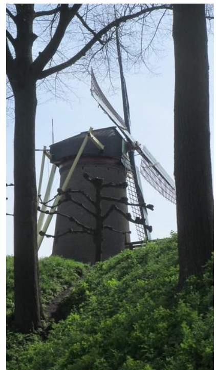
De Stadsmolen, hoog op de wallen.