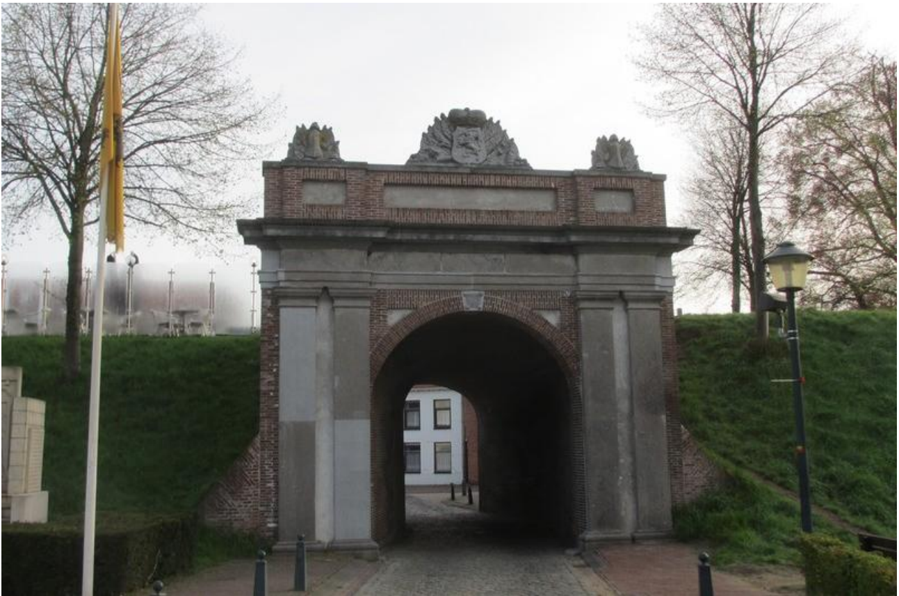
De Gentse poort met het Generaliteitswapen bovenaan

De versiering bovenop de poort is het Generaliteitswapen, het teken van de Verenigde Nederlanden.