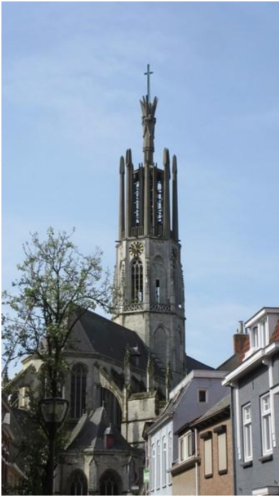
De Sint-Willibrordusbasiliek met de eigenaardige toren.

Weliswaar in een steeds wisselende stijl. Dat verwoesten gebeurde niet altijd door mensenhand. Eén keer is de bliksem zo ongenadig op de toren ingeslagen dat die daardoor erg beschadigd werd. Als gevolg van dat alles bestaat de toren nu uit vier min of meer afzonderlijke delen. Het eerste gedeelte, vermoedelijk uit de 13 e of 14 e eeuw, gaat grotendeels schuil onder het dak van de kerk. Van de in 1402 gebouwde achthoekige toren is alleen maar de onderste verdieping overgebleven. Het gedeelte tussen de balustrade en de wijzerplaten is een restant van de door architect Cuypers gebouwde toren. Tijdens de bevrijding van Hulst door de Poolse 1 e Pantserdivisie in 1944 werd de torenspits nog eens vernield. Voorlopig voor het laatst. Boven op de toren werd later een betonnen bouwsel geplaatst. Het geheel stelt stemvorken voor die de klokken omringen en helemaal van boven staan engelen naar het kruisbeeld gekeerd. Het kunstwerk is met de naam „de Prediker“ bedacht. Niet iedereen is even gelukkig met de stijl van de markante spits die heel anders is dan die van de rest van het gebouw. Desondanks is de Sint-Willibrordusbasiliek uitgeroepen tot mooiste kerk van Nederland. Naar het schijnt is bij zonnig weer het kleurenspeel door de met de hand gebrandschilderde ramen werkelijk