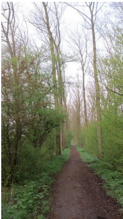
Boven op de Liniedijk

Er is behalve de indrukwekkende wallen en grachten in Hulst nog wel meer aan militaire verdedigingswerken van weleer te zien. De Liniedijk, om maar iets te noemen. Tijdens de Tachtigjarige Oorlog was er een periode dat de vijandelijkheden even werden opgeschort. Dat staat bekend als het Twaalfjarige Bestand. Gedurende die periode werd een „Linie van Communicatie“ aangelegd die de vesting Hulst verbond met de forten van Moerschans, De Rape en Zandberg. Tegenwoordig is zo'n communicatielijn een draadje met vier geleiders of een glasvezelkabel. Ten tijde van het Bestand kon men er zich nog niet met zoiets vanaf maken en moest men andere middelen inroepen. Het werd een zogenaamde „bedekte weg“. Dat betekende een weg (uiteraard) die door een dijk van de vijand werd afgeschermd. Die dijk ligt er nog steeds en hier, vlakbij de stad, is hij nog zeer manifest aanwezig. In het Belgische Stekene, even verderop, zijn er nog slechts rudimenten van te zien. Boven op de dijk ligt een pad dat op en neer gaat in een zeer groen decor.