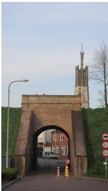
De Bagijnepoort of Graauwse poort

Het was allemaal goed en wel dat een stad door hoge wallen en brede grachten tegen belagers werd afgeschermd, in betere tijden moest men ook in en uit de stad raken. Daartoe werden in de wallen de stadspoorten gebouwd.