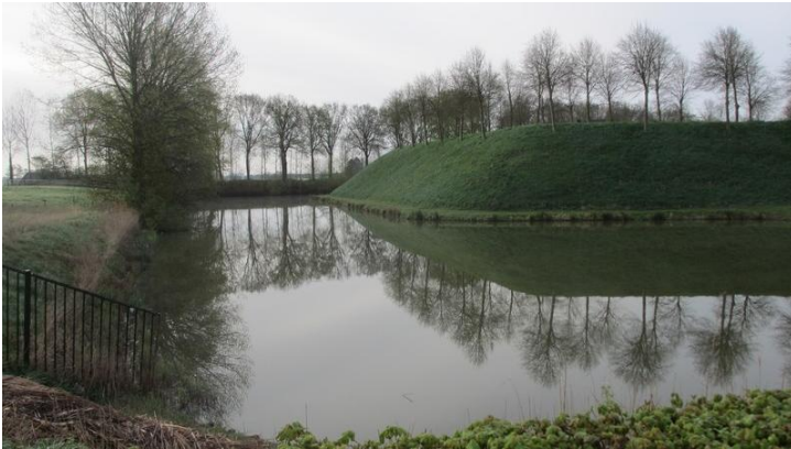
Een klein stukje van de omwalling in Hulst.

En luchtfoto van het huidige Hulst toont het duidelijk: hier hebben we te maken met een vestingstad. Een vesting was in vroegere tijden een verdedigingswerk waar een permanente militaire bezetting aanwezig was die de stad moest verdedigen wanneer dat nodig was. Ofwel kon het leger van daaruit uitvallen doen om belagers op hun falie te geven. Maar ook optrekkende troepen konden er terecht want ze vonden er een relatief veilige plek.