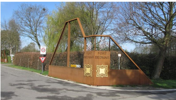
Zo kan je nog zien dat dit de site is waar Fort Bedmar gelegen was.

Ik werd op mijn tocht geconfronteerd met een aantal borden die het opeens hadden over de grachten van Fort Bedmar. Grachten? Bij nader inzien lagen er enkele kasseistroken die moesten evoceren dat daar de binnengracht, dan wel de buitengracht van het Fort Bedmar had gelegen. Ware het niet zo geweest dat bij het kruispunt van twee straten een zeer opvallende palissade van roestig staal had gestaan, ik had helemaal niet geweten dat daar ooit het bewuste fort had gelegen. Het is nu... een reusachtig grote camping. Een treffende illustratie van de misdadig achteloze manier waarop België met historische sites placht om te gaan. Geef het in handen van ondernemende particulieren en die maken er een winstgevend potje van. Zoals hier. Fort Bedmar was een onderdeel van de Bedmarlinie. Die op zich dan weer