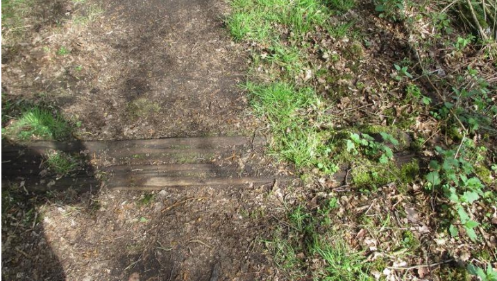
Een eikenhouten dwarsligger die op het wandelpad is blijven dwarsliggen.

Een paar borden onderweg maakten duidelijk dat hier eertijds een spoorlijn heeft gelegen. In 1860 vroegen de ingezetenen van het kanton Hulst en de gemeenteraad van Axel aan de koning van Nederland om tussen te komen in het aanleggen van een spoorlijn om Mechelen en Terneuzen te verbinden. Dat werd nodig geacht voor het aan de man brengen van de landbouwproducten uit Zeeuws-Vlaanderen. Bovendien kreeg de haven van