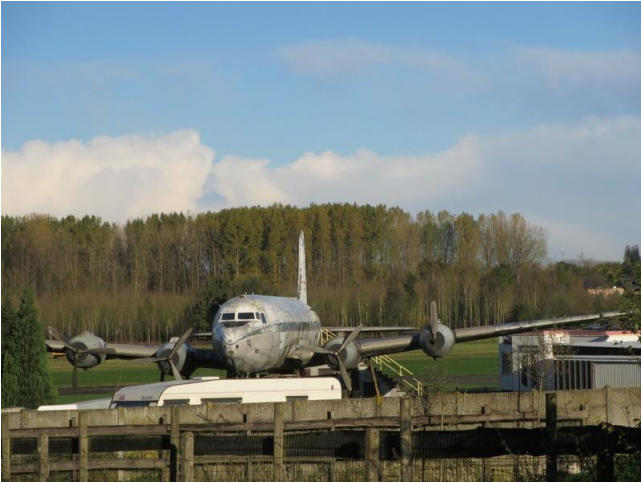
De C-54 Skymaster bij het vliegveld in Overboelare