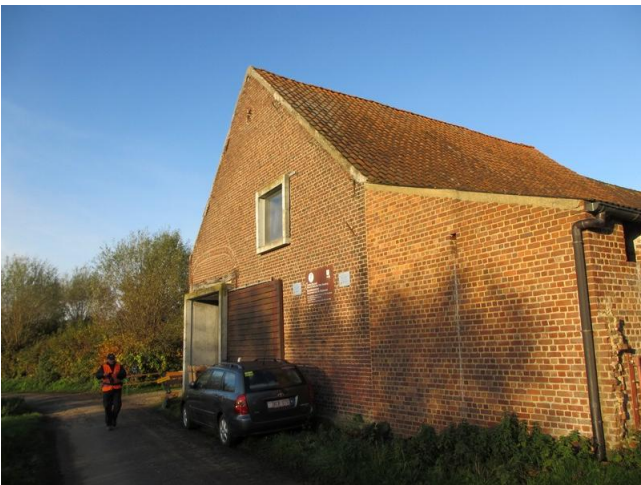
Het weinig uitnodigende onthaalcentrum van de Rietbeemd: de Sint-Antoonshoeve.

Je hebt hier de Mark . Of La Marcq omdat het stromende water zich uiteraard niets aantrekt van de verdelingen die de mensen zich lieten invallen. Dan is er ook nog de Dender. Allebei zijn het rivieren al is er een flink verschil in grootte te onderscheiden. Bij zoverre zelfs dat sommigen de Mark niet als een rivier beschouwen maar als een beek. Ieder zijn waarheid.