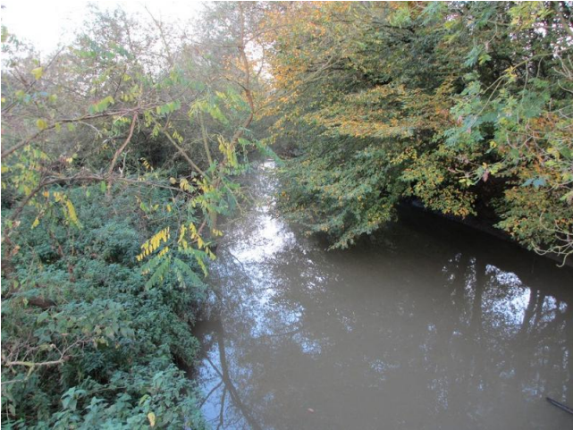
De Mark. Aan de kleur van het water zou men niet zeggen dat dit riviertje visrijk is. Toch schijnt dat zo te zijn.

plaats te bieden aan grootschalige landbouw, industriële varkenskwekerijen, waterspaarbekkens, zandopspuitingen, en zelfs een autosnelweg. Het was dan ook een soort niemandsland. Het gebied lag ten slotte op de grens van drie provincies en in twee taalgebieden. In een land als België is dat om problemen vragen. Maar toch kwam het goed.