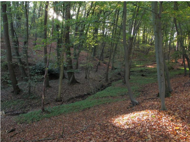
In het Boelarebos

Volgens de verhalen planten die van de Buizemont hun aardappelen reeds voor de Eerste Toog. Het kostte wat zoeken om te weten te komen wat die uitspraak eigenlijk mocht betekenen maar het blijkt dat die „Eerste Toog“ een jaarmarkt is in Geraardsbergen. Die vindt