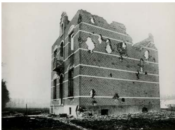
Door artillerievuur zwaar beschadigde woning langsheen de Wakkerzeelsestraat te Wespelaar.

In augustus en september 1914 ondernam het Belgisch leger twee uitvallen vanuit de vesting Antwerpen, met als doel de Duitse opmars naar Parijs te vertragen. Beide keren kwam het tot hevige gevechten langs een breed front, met zware confrontaties in het gebied tussen het kanaal Leuven-Mechelen en de Dijle. De twee uitvallen droegen er toe bij dat de Duitsers een halt werd toegeroepen aan de Marne. Naast de militaire verliezen veroorzaakten de gevechten en de woedende reacties van de Duitsers onnoemelijk leed bij de burgerbevolking. In 1993 slaagden Gust Vandegoor en Roger Casteels in een onderneming die specialisten voor onmogelijk hielden: een grondige, alomvattende reconstructie van de krijgsverrichtingen tussen Zemst en Aarschot, en een bundeling van een reeks vaak onuitgegeven getuigenissen over de gruwelijke gebeurtenissen die de burgers in de gevechtszones te verduren kregen.