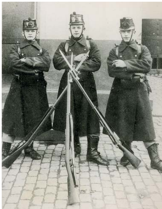
Soldaten van het 9de Linierregiment in 1914. (Collecties Koninklijk Legermuseum – Brussel).

De Eerste Wereldoorlog in het dagboek van de Tildonkse ursulinen : 128 bladzijden – meer dan 60 illustraties. Prijs: 15 euro