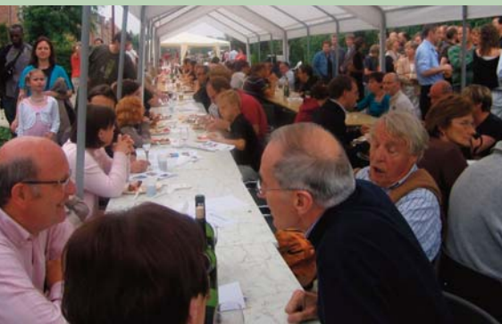
Straatfeest met braai op 9 juni te Kontich