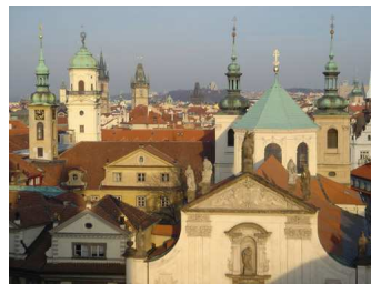
Stad van de Honderd Torens

De stad is nauwelijks aangetast tijdens de oorlog waardoor het een groot openlucht-museum is. Het historische centrum staat sinds 1992 op de Werelderfgoedlijst.