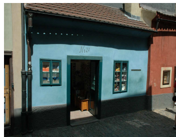
Huis Franz Kafka

De bekende schrijver Franz Kafka woonde hier een tijdje in nummer 22.