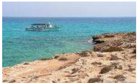
Sandy Bay, Agia Napa

den zijn het Nationale Museum en de Kathedraal van St. John met zijn fresco's en Byzantijnse iconen.