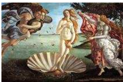
"de geboorte van Venus", Botticelli

Tempel van Aphrodite ligt zo'n 15 kilometer ten oosten van Paphos.