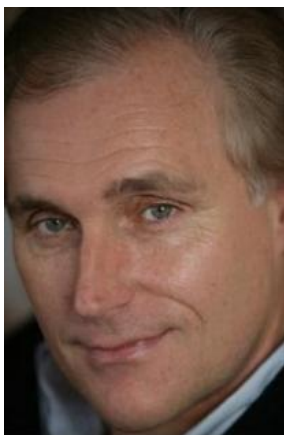
Arthur Japin