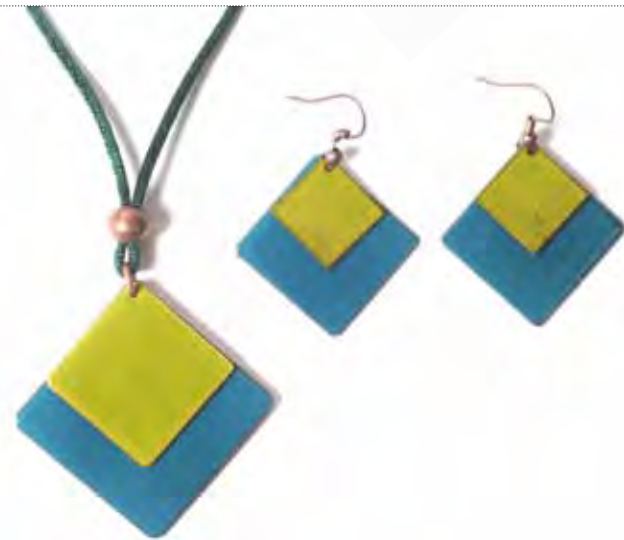
Juwelen in geëmailleerd koper uit Chili • Hanger, € 22,50 (76624) • Oorringen, € 15,00 (76625)