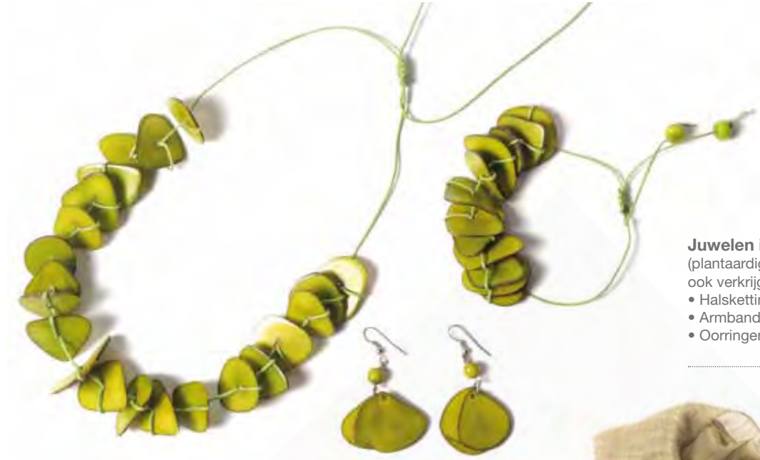
Juwelen in schijfjes tagua (plantaardig ivoor) uit Ecuador ook verkrijgbaar in blauw en rood: • Halsketting, € 24,50 (76590) • Armband, € 12,50 (76593) • Oorringen 3 schijfjes, € 10,50 (76596)