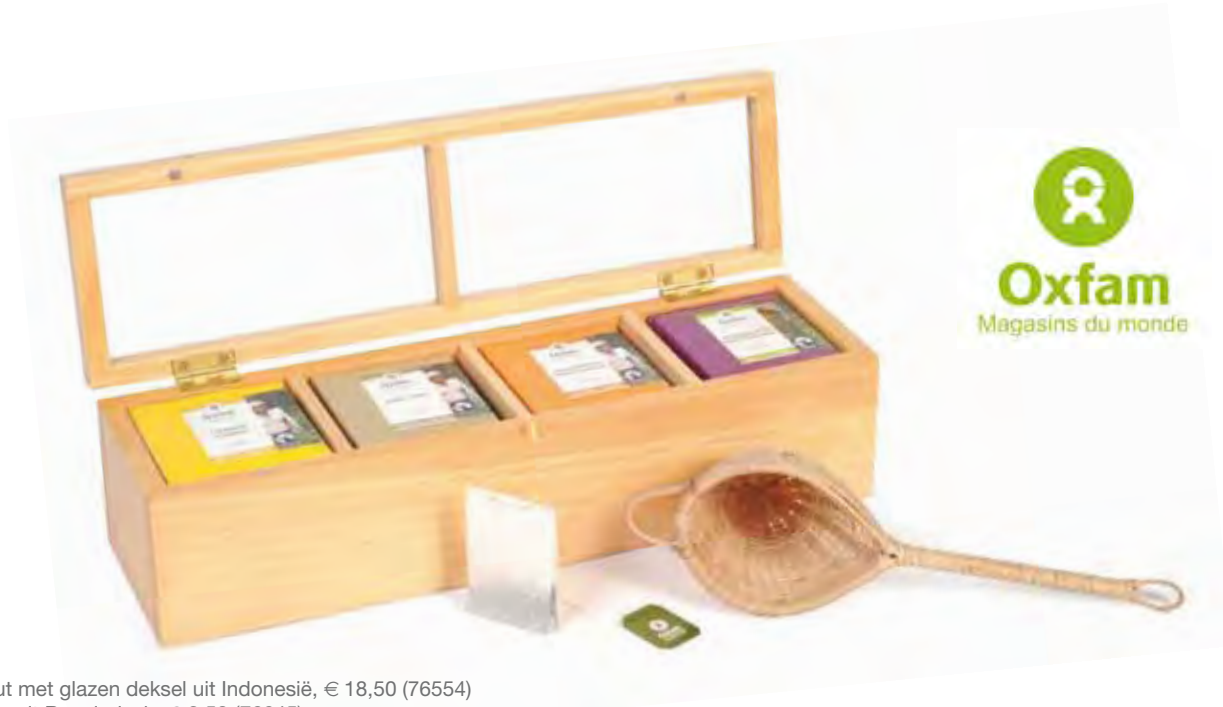
Theedoo's in hout met glazen deksel uit Indonesië, € 18,50 (76554) Theezeef in rotan uit Bangladesh, € 2,50 (76645)