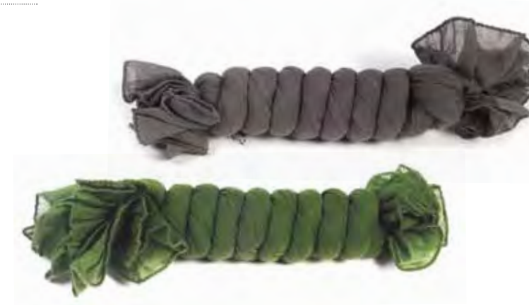
Sjaals in gekreukeld katoen uit India , € 10,90 ook in andere kleuren verkrijgbaar: donkergrijs (76637), groen (76638)