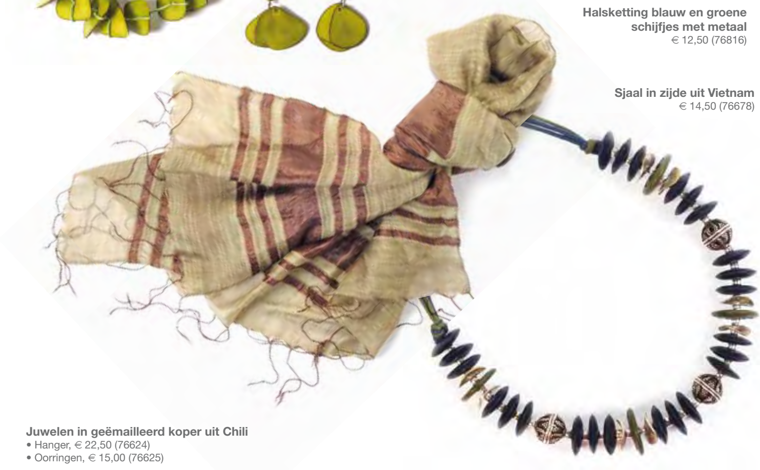
Halsketting blauw en groene schijfjes met metaal € 12,50 (76816)