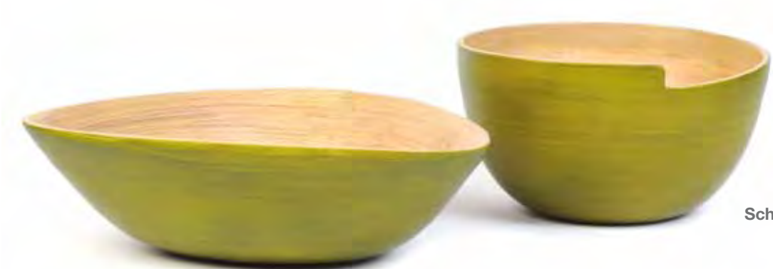
Schalen in bamboe uit Vietnam , ook verkrijgbaar in donkerrood en paars • driehoekig, € 17,00 (76702) • rond Ø 20cm, € 14,50 (76701)