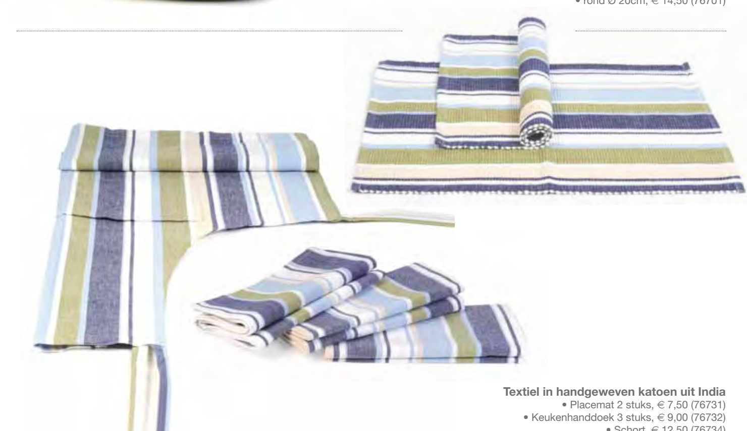
Textiel in handgeweven katoen uit India • Placemat 2 stuks, € 7,50 (76731) • Keukenhanddoek 3 stuks, € 9,00 (76732) • Schort, € 12,50 (76734)