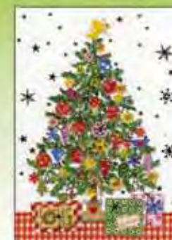
Pakket van 6 kaarten

Te koop in pakketjes van 6 of 10 exemplaren met telkens 2 motieven versierd met glitters en reliëf en bijpassende enveloppen.