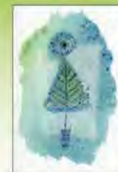
Pakket van 10 kaarten