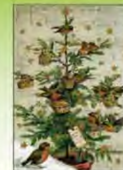
Pakket van 6 kaarten