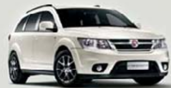
Fusion White PWH