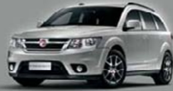
Avantgard Metal Grey PS2