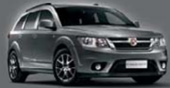
Progressive Grey PAJ