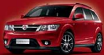
Charleston Red PRA

COULEURS MÉTALLISÉES / METAALKLEUR COULEUR TRIPLECOUCHE / DRIELAAGSE KLEUREN