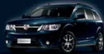
Fathom Blue PPS