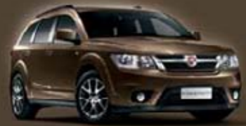
Country Brown PTM