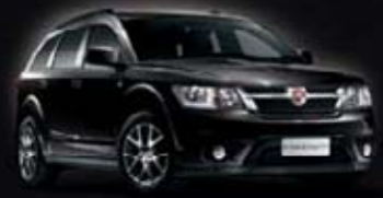
Underground Black PXR