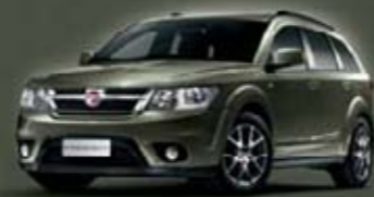
Calypso Green PFP