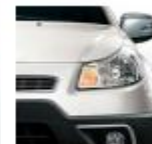
983 Gelato White