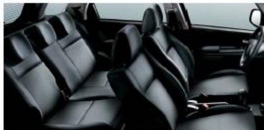
421 Tissus/Stof Striped Grey Cloth