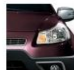
198 Dolce Violet