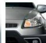
976 Maestro Gray