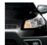
975 Tonore Black