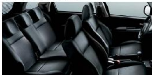
423 Cuir/Leder Black Leather