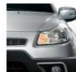
977 Pompei Gray