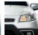
211 Pearl White