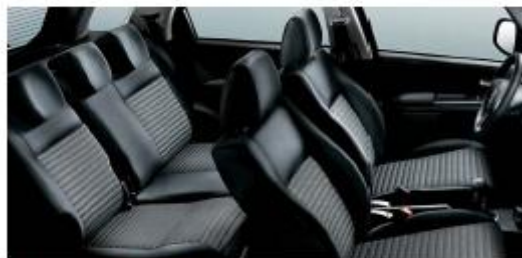
412 Tissus/stoffen Perforated Grey Cloth