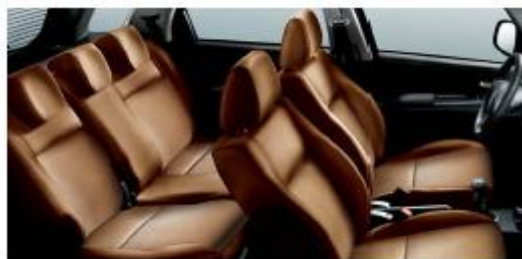
495 Cuir/Leder Light color Leather