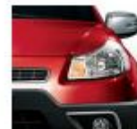
982 Passion Red