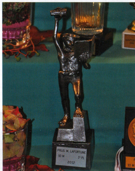
de winnaar kreeg het 'Fonske'