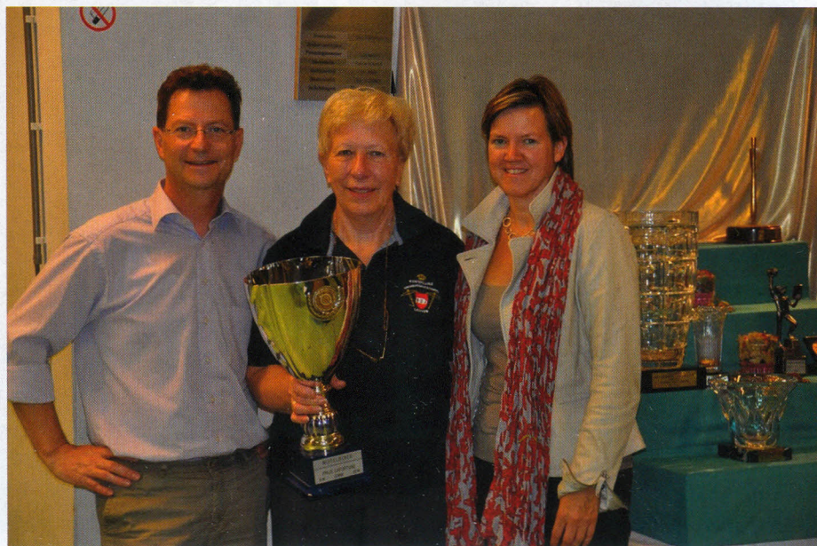
HUZ Leuven was op beide afstanden de beste ploeg en mocht de 'Combiné' in ontvangst nemen