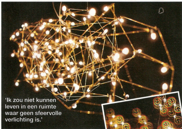
'Ik zou niet kunnen leven in een ruimte waar geen sfeervolle verlichting is.'