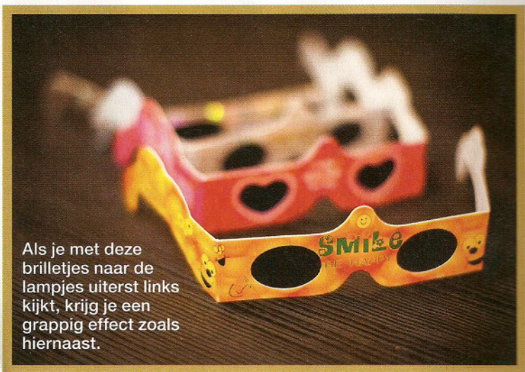
Als je met deze brillemkes naar de lampjes uiterst links kijkt, krijg je een grappig effect zoals hiernaast.

werper of kunstenaar zelf, vooral omdat het vaak op maat gemaakt wordt. 'Mijn man en ik zijn beiden creatief. In onze vrije tijd zijn we vaak bezig met kunst, schilderwerk, fotografie of het ontwerpen van meubelstukken. Ik heb schone kunsten gestudeerd, net zoals mijn schoonvader. Alle schilderijen hier zijn van zijn hand. Ook mijn zoon heeft op zijn tiende tekeningen gemaakt die ik nog steeds geweldig vind. Hij is een grote toekomstige kunstenaar, volgens mij. Hoewel hij nu meer geïnteresseerd is in videogames.'