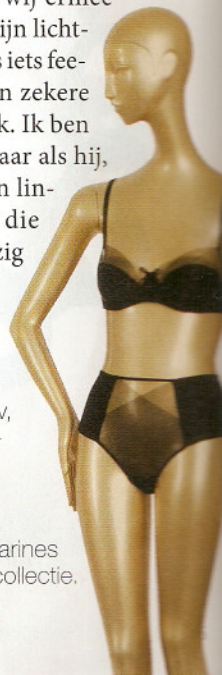
Een setje uit Carines huidige wintercollectie.

In 'Geheime kamers' gluren we wekelijks binnen in het huis van een toffe m/v, die ons toont wat hem/haar drijft, boeit en raakt.