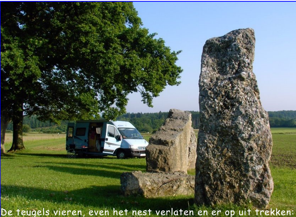
De teugels vieren, even het nest verlaten en er op uit trekken: